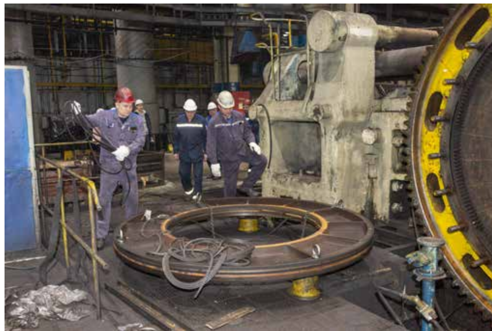
У ремонтников во время новогодних каникул забот хватает