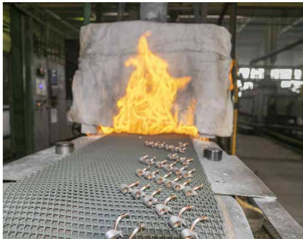
Уникальная печь пайки в термическом цехе завода двигателей снова в строю

Восстановленное оборудование после новогодней вахты передано производителям. Запуск прошёл в рабочем режиме. Следующий цикл ремонтных работ намечен на майские праздники.