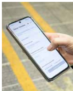
...и мобильные приложения для водителя на планшете и на смартфоне