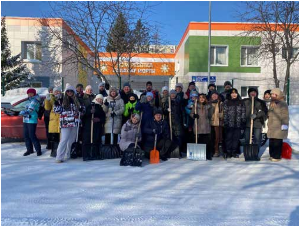
Волонтеры взялись за лопаты, чтобы очистить от снега двор Дома малютки

— Пять лет назад, когда создавалась «Лига добрых дел», в ней насчитывалась всего 40 молодых камазовцев, а теперь она объединяет больше 350 сотрудников