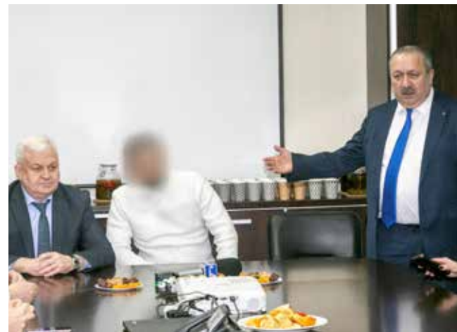
Солдатам передали пожелания вернуться домой с победой