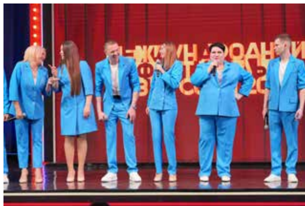
«Полный привод» запомнился публике не только смешными юморесками, но и яркими костюмами

Зал тепло встретил выступления камазовских команд и наградил их громкими аплодисментами.