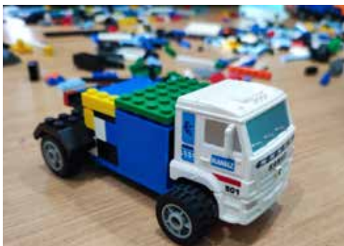
О таком симпатичном КАМАЗе мечтает каждый школьник

Самые активные участники конкурсов были награждены призами, а камазовцы унесли с собой поздравительные плакаты, подготовленные школьниками к 55-летию автогиганта, и воспоминания о тёплой встрече зимним декабрьским днём.