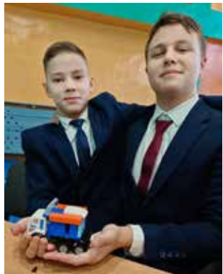
Вырастем — соберём настоящий