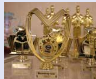
У каждой номинации свой оригинальный кубок