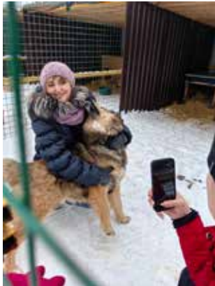
Питомцы приюта для животных очень тепло откликаются на ласку

Ребята активно помогали и бойцам, находящимся в зоне СВО: плели маскировочные сети, изготавливали окопные свечи,