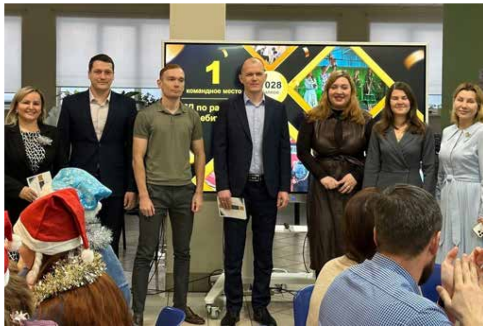
Подразделение директора по работе с потребителями стало лучшим в командном зачёте программы

А приз победителям предоставлялся на выбор — пройти обучение в Москве, Санкт-Петербурге или Казани, либо взять путёвку в один из российских санаториев, среди которых «Приморье» в Геленджике.