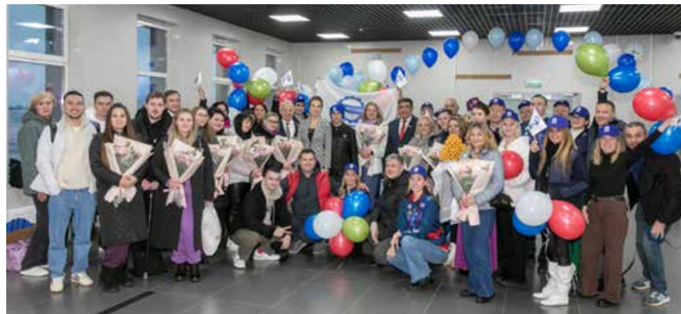
По прибытии встречающие сделали с кавээнщиками общую фотографию