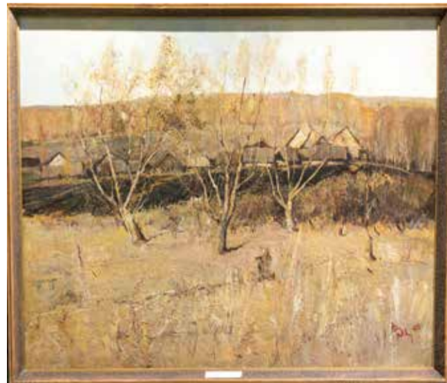
Трепетной грустью окутан «Осенний мотив», приобретённый Государственным музеем изобразительных искусств РТ