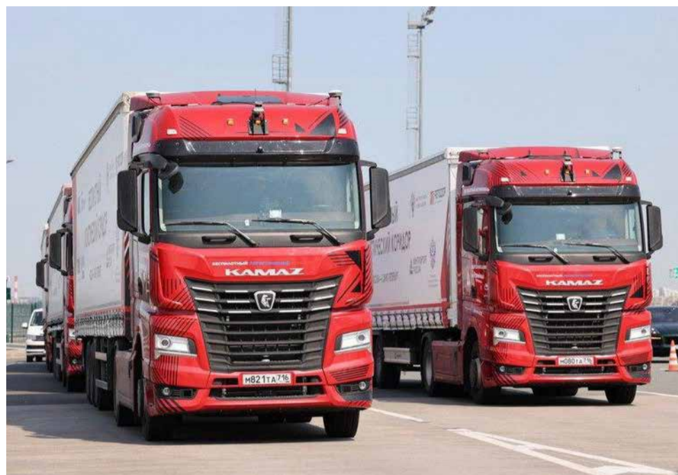
Каждый оборот колеса, вовлечённого в проект «КАМАЗа», формирует доход владельца ЦФА

— Какие дополнительные расходы нужно иметь в виду инвестору? Есть ли комиссия за вывод средств?