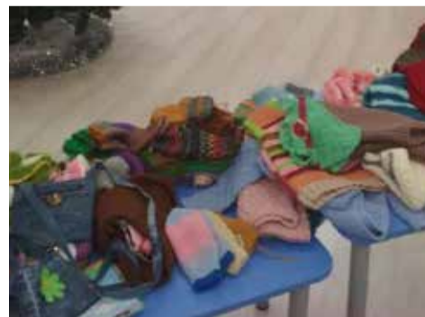
...и получить в подарок теплые вещишки

годарностью принимают благотворительную помощь ветеранов «КАМАЗа», оказанную от всего сердца.