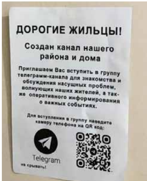
В домовый чат вступить полезно, но делать это нужно правильно

► Дополнительно защитите мессенджер паролем через защиту приложений мобильного телефона, чтобы никто не смог получить доступ к перепискам, кроме вас.