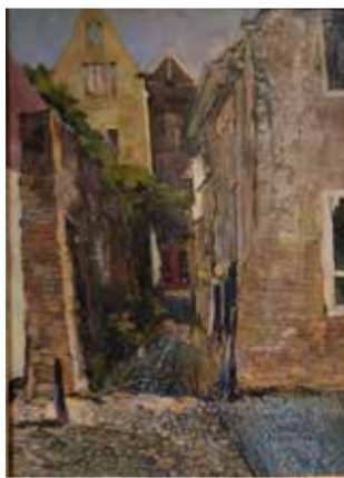
Улочки голландского Девентера пленили мастера, каждый кирпичик старинных домов выписан с любовью и вдохновением

Выставка будет работать до 2 февраля, а дальше судьба коллекции под вопросом. Пока картины приютит фонд городского отделения Союза художников, но городу нужен постоянный музей изобразительных искусств. Набережные Челны в своё время дали шанс реализоваться многим начинающим живописцам, и это культурное наследие надо сохранить и приумножить.