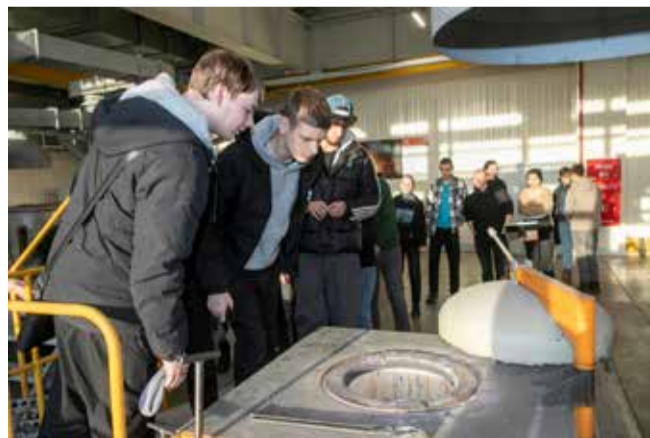
Плавильная печь вызвала особый интерес у студентов