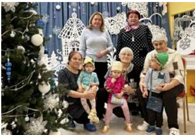
Малышам в радость побыть с бабушками...