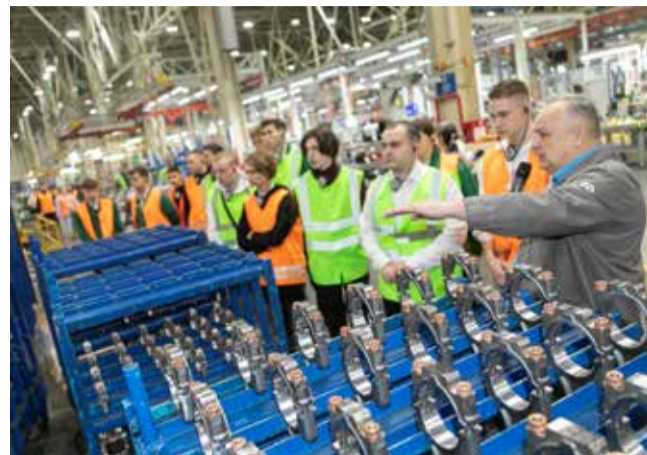
Первое, что увидели представители студотряда на «движках», — арматурно-сборочное производство

— Я учусь на повара, но мне захотелось увидеть что-то