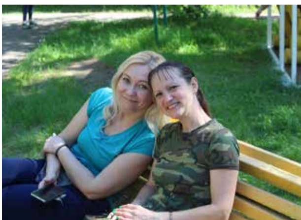
Ничто так не поднимает настроение, как встреча с подругой

Прогулки на свежем воздухе. В парке или в лесу надо проводить от 30 минут в день, но если нет такой возможности, прогулять-