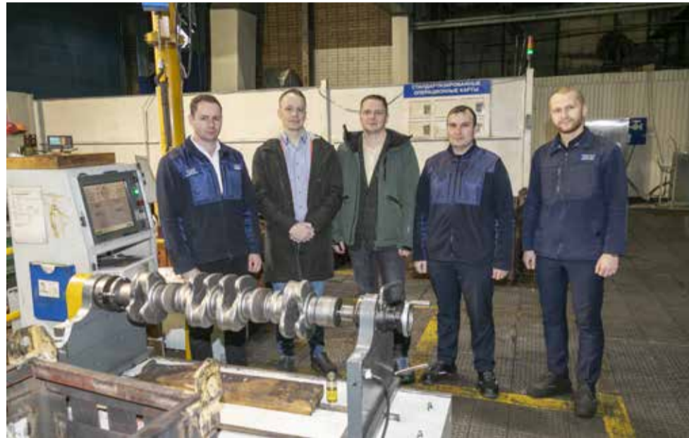
Команда ЦИТ и кузнечного завода реализовала проект с самым внушительным экономическим эффектом

Для молодых сотрудников компании такие проекты — это реальная возможность не только воплотить идею, но и получить неоценимый опыт в процессе её реализации, существенный материальный бонус и перспективы карьерного роста. В этом году информационные встречи в подразделениях будут продолжены, список компаний, входящих в группу технологической цепочки «КАМАЗа», расширился, а значит, и проектов будет больше.