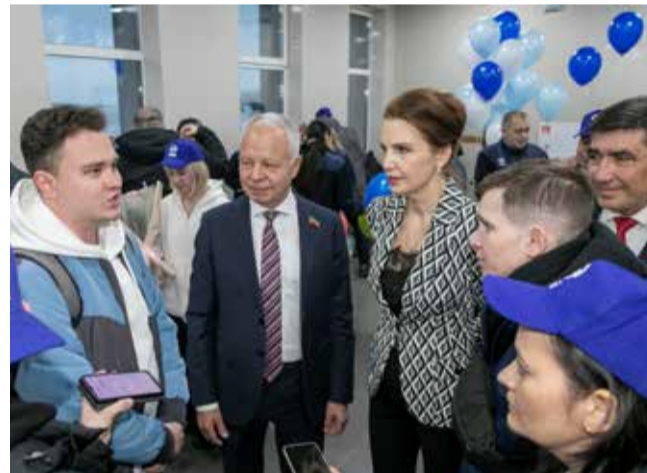
Капитаны команд поделились впечатлениями от выступлений на «КиВиНе»

— Хронометраж в четыре с половиной минуты накладывал определённые ограничения на выступление и его содержание. Но мы с этой задачей справились. Для нас это был дебют в таком масштабном мероприятии. Сам фестиваль оставил положительные впечатления и дал заряд на новый сезон.