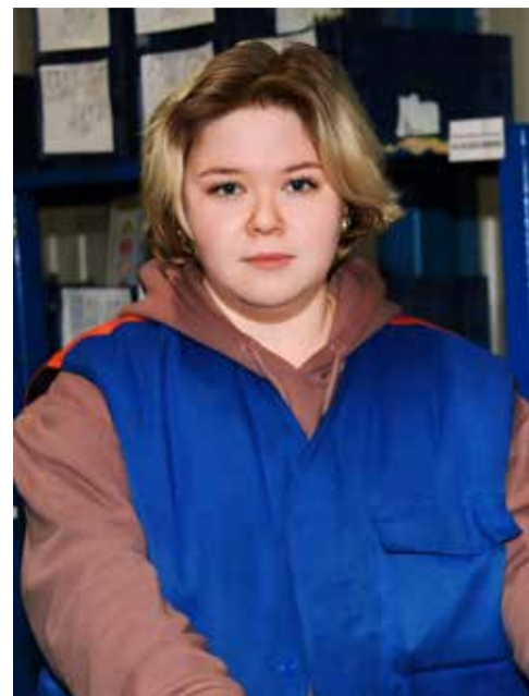
...а в логистическом центре — за обеспечение агрегатного производства необходимыми материалами и комплектующими

классной камазовской команде легло на благодатную почву.