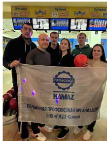
Логисты «КАМАЗа» одержали уверенную победу в турнире по боулингу

Я понимаю, что постоянно попадаю на уловки маркетологов. Как с этим бороться? Просто удалить из телефона приложения маркетплейсов, но возвращаться к пешим походам по магазинам не хочется, да и экономия от покупок на распродажах, что бы там ни говорили, существенная. Так что я пока не готова отказаться от этого удобного и полезного времяпровождения. Пусть скидка будет больше!