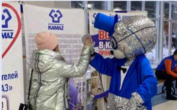
Встретить дружелюбного медведя — к удаче

В преддверии Татьянинного дня, который отмечается 25 января, студентов ждал приятный сюрприз: у входа в колледж их встречал... мишка. Главный символический российский зверь к ребятам отнёсся со всем своим плюшевым дружелюбием — весело махал лапами и щедро делился обнимашками. А сотрудники завода двигателей угощали будущих технарей вкусняшками. Утро перед парами определённо задалось!