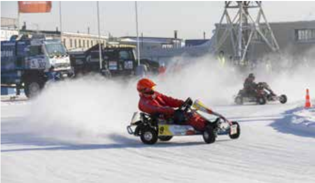
Своё мастерство каждый гонщик проверял на крутых поворотах