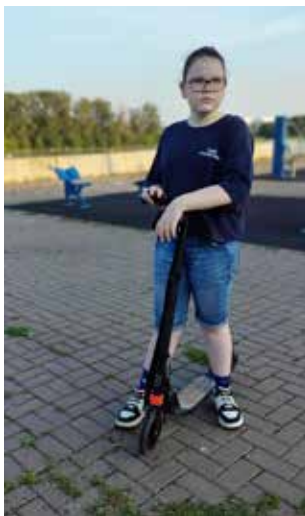
Самокат, купленный на маркетплейсе, верно отслужил сезон и готовится к следующему

По итогам команда логистического центра «КАМАЗа» одержала уверенную победу, набрав 827 баллов. Немного отстали от них дизельисты: со счётом в 715 баллов они ворвались в финальную тройку игроков и заняли третье место.