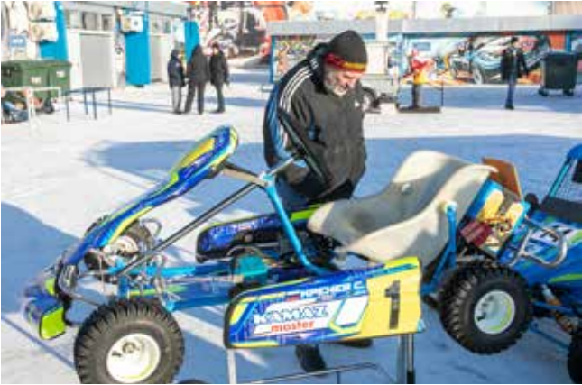
Гости внимательно рассматривали все детали электрического карта