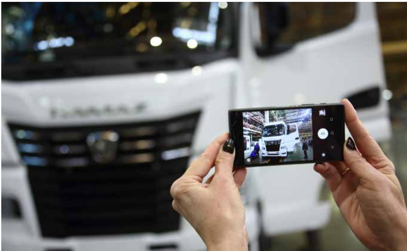
Одна из важных задач на 2025 год — снижение рекламационных дефектов

Цели «КАМАЗа» декомпозируются в цели процессов. Так, по направлению «Качество» нужно обеспечить IPHV3mis (количество рекламационных дефектов на 100 единиц автотехники по результатам трёх месяцев эксплуатации) для автомобилей поколения K3 не более 4,172; для «Производства отливок» — не более 0,073; для «Производства штампованных поковок» — не более 0,11, для «Прессово-рамного производства» — не более 0,541. Есть цель обеспечить количество дефектов на автомобиле (DPV) по грузовикам поколений K3 — K5: для «Производства силовых агрегатов» — не более 0,397; для «Инструментального обеспечения» — не более 0,01, а для «Внутренней логистики» — не более 0,077. Или вот необходимо снизить количество рекламационных дефектов автомобилей в эксплуатации с пробегом до 1000 километров на 20% — такая задача стоит для процесса «Внутренняя логистика».