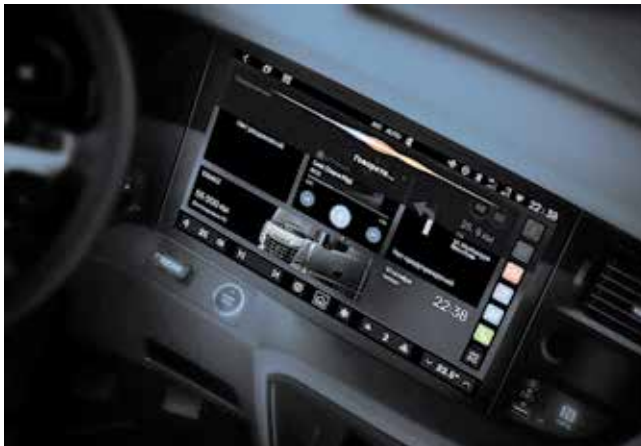
«КАМАЗ» — первый российский автопроизводитель, который внедряет голосовое управление функциями транспортного средства

Партнёром по разработке голосового помощника в бортовой информационной системе КАМАЗ выступила компания «Энбисис» из Томска. Она специализируется на речевых технологиях и является разработчиком платформы Enois, с помощью которой автопроизводители создают узкоспециализированные голосовые помощники под конкретные модели и головные устройства.