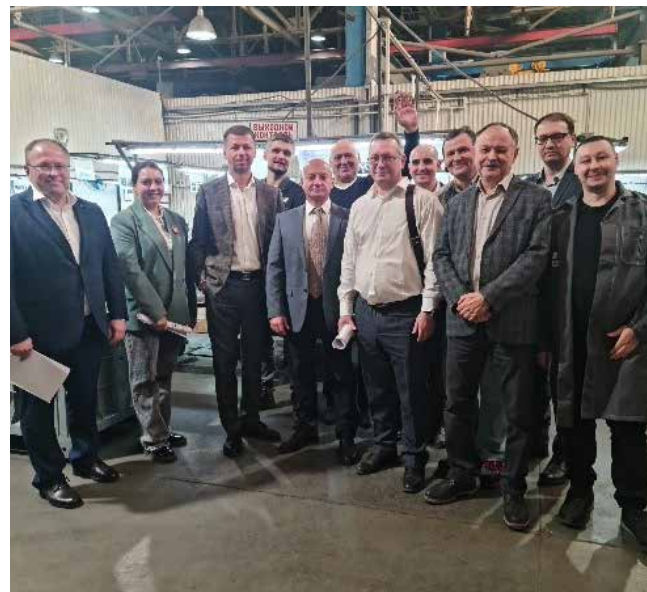
Делегация представителей «КАМАЗа» принимает участие в оценке процесса производства «Биформ Плюс»