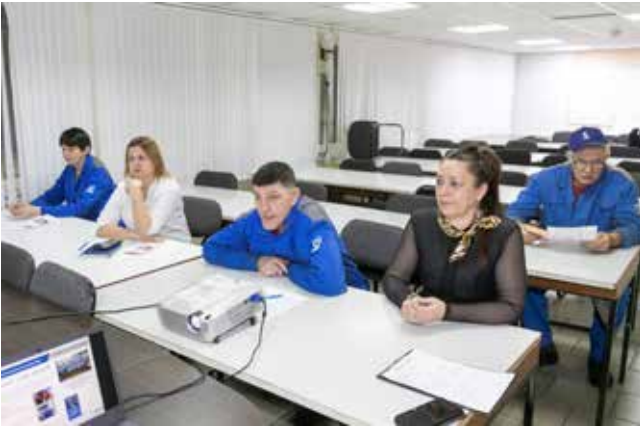
На информационных встречах новички больше узнают о своём заводе

Для знакомства недавно трудоустроенных заводчан с «КАМАЗом» специалисты отдела кадров подготовили презентацию: привели интересные факты об автогиганте, разъяснили, какие основные заводы входят в состав компании и какую