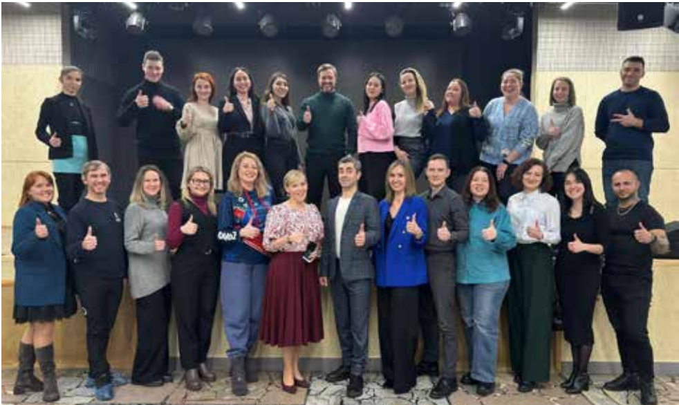
Участники не только показали свои навыки, но и получили ценные советы по вокалу

Занятия с преподавателями по постановке голоса, правильного дыхания и проработки звуков для тех, кто по итогу кастинга попал в сборную автогиганта, начнутся с февраля.