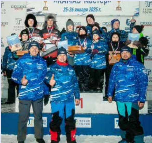
Победители получали призы из рук именитых гонщиков команды «КАМАЗ-мастер»