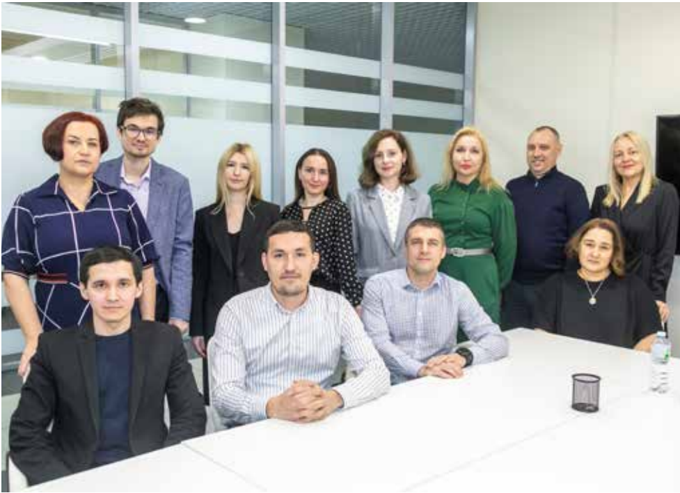
Благодаря усилиям этого коллектива экспертов по переговорам за прошедший год удалось получить эффект порядка полумиллиарда рублей

Специалисты блока по закупкам постоянно следят за динамикой изменений цен на рынке. Задача усложняется, когда цены начинают расти, а аппетиты поставщиков зачастую растут ещё быстрее. Встречаются и монополи-