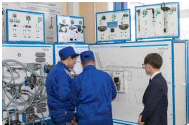
...и разберётся в любой схеме стартера автомобиля