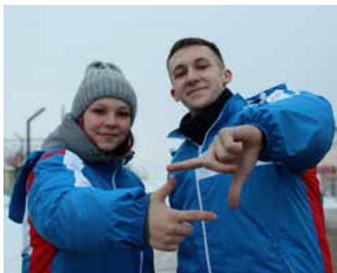
Сегодня мы десантники

В рамках акции прошли и профориентационные встречи со школьниками — представители Российских студенческих отрядов рассказали им о направлениях и традициях движения, провели творческие и образовательные мастер-классы и организовали спортивные соревнования по волейболу. А завершилась Всероссийская акция «Снежный десант» концертом для местных жителей.