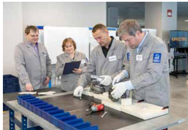
Участникам придётся разобрать турбокомпрессор, чтобы найти дефекты...

Возникло обсуждение о правильной установке втулки, чтобы она не проваливалась в корпус турбокомпрессора. Участники обратились к принципу «3 НЕ»: на этапе «Не производи брак» посчитали необходимым проводить тренинги для обучения рабочего; «Не передавай брак» — ввести дополнительную визуализа-