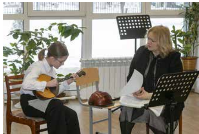
Отборочный тур — хорошая возможность показать себя и получить советы от столичных педагогов

Подробный материал об этом событии читайте в следующем номере.