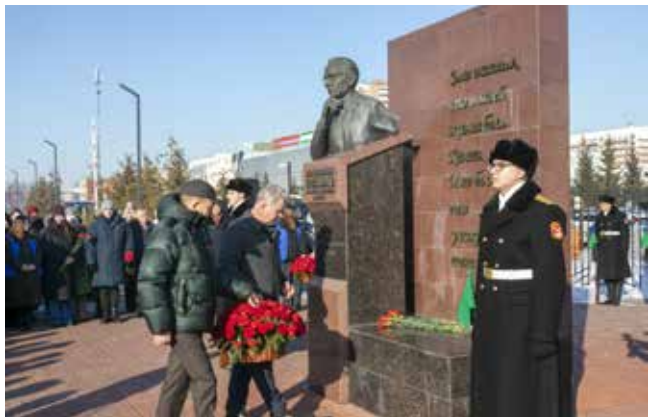
Возложение цветов к бюсту Льва Борисовича Васильева — знак глубокого уважения

Не обошлось на митинге и без поэтической строки: