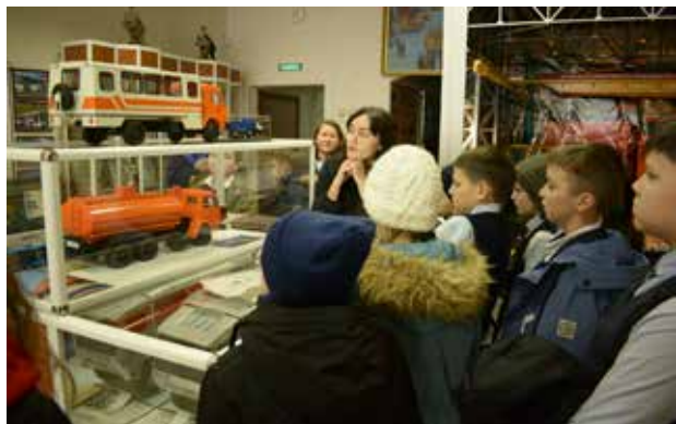
Любознательным ребятам оказалось интересно всё

В завершение экскурсии гости посетили заводской музей. Здесь они узнали, как создавался и развивался Нефтекамский автозавод, а также поиграли в викторину. День прошёл познавательнее некуда!