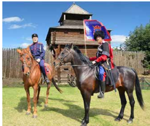
У казаков особое отношение к коням

в различных событиях города, фестивалях. Атаман подытоживает разговор тем, что молодой «Станице Челны» предстоит пройти огромный путь, но казаки не боятся трудностей.