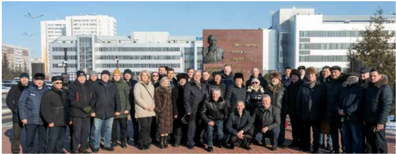
Это фото на память тоже станет историческим