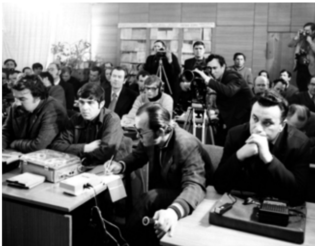
Долгожданное событие вызвало неподдельный интерес представителей прессы