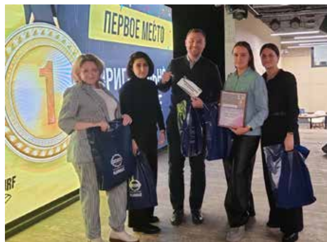
Команда из «АЗК» стала победителем первой интеллектуальной игры 2025 года

По итогу всей игры на третьем месте расположилась команда «Сутки наши» из логистического центра. Вторую позицию занял коллектив «Всё то золото — что мы!» (литейный завод). Самыми эрудированными оказались представители команды «Оригинальное название»