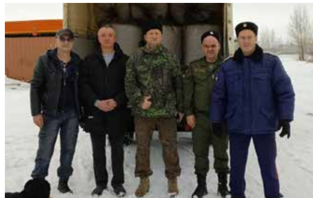
Челнинские казаки отправляют помощь своим бойцам, находящимся в зоне СВО