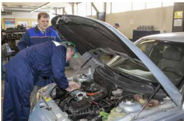
Хороший автомеханик без труда проведёт диагностику машины...