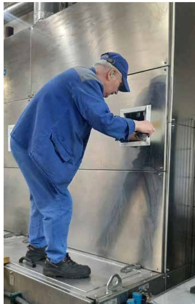
Ревизионные люки позволяют проводить наладку моечной машины в шесть раз быстрее

— Это, по сути, небольшие окна, которые дают доступ к нужным частям машины. Снимать части корпуса больше не нужно — открыл окошко, про-