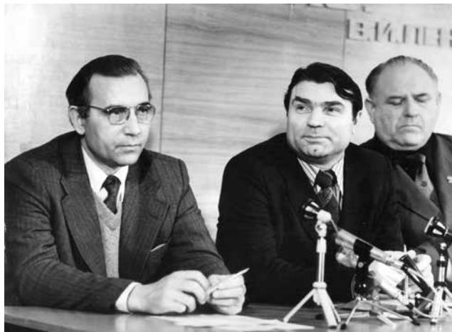
Отвечая на вопросы о предстоящем пуске ГСК корреспонденты получили от первых руководителей «КАМАЗа» и «Камгэсэнергостроя»

тральные, республиканские и городские газеты вышли с заголовками-путешествиями: «Счастливых дорог, «КАМАЗ»! («Комсомольская правда»), «В добрый час! («Рабочий КАМАЗ»), «В добрый путь, «КАМАЗ» («Комсомолец Татари») и рапортами: «КАМАЗ» — главный конвейер действует!» («Правда»), «Есть «КАМАЗ» № 1! («Камские зори»). Корреспонденты не сдерживали ликования, вот лишь несколько цитат: «16 февраля главный конвейер «КАМАЗа» ожил по-настоящему. Заработал!», «Это новая яркая страница в летописи отечественного автомобилестроения», «Сбылось то, о чём мечтали, чем жили все эти трудные, напряжённые годы». А вместе с ними ликовала и вся страна!