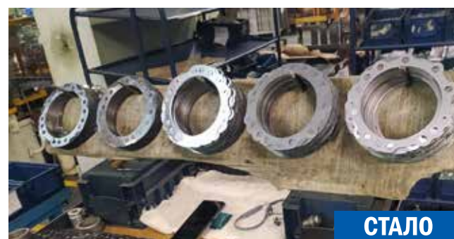
Визуализация моделей прокладок для сборки редуктора помогла сэкономить время и выиграть в конкурсе «Лидер PSK»