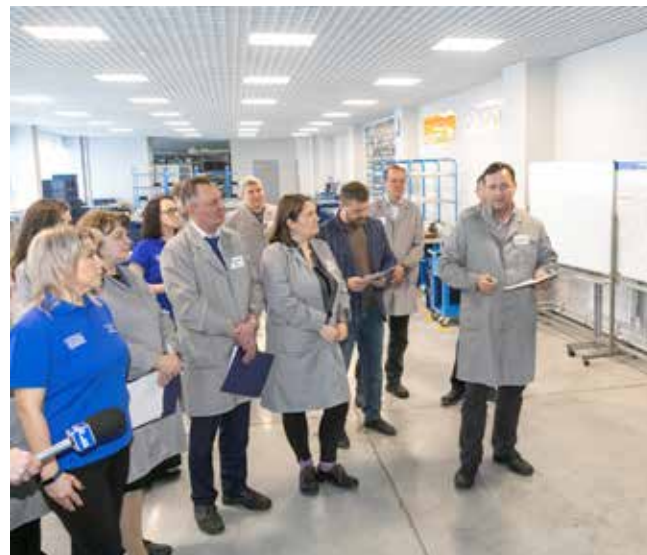
...а затем предложить варианты, как не допускать их в будущем

цию при установке втулки. При этом требуется ещё и проконтролировать, правильно ли сотрудник начал работать после обучения. А этап «Не принимай брак» предусматривает осмотр узла.