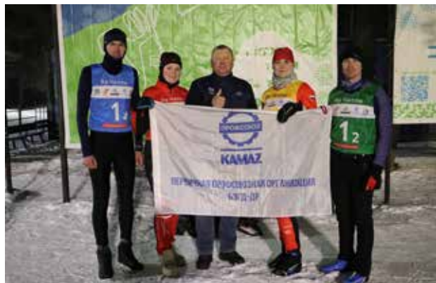
Команда БЗГД — ДР — сильнейшая в этом состязании

Награждение победителей пройдёт 23 февраля на первенстве «КАМАЗа» по лыжным гонкам в рамках Спартакиады-2025.