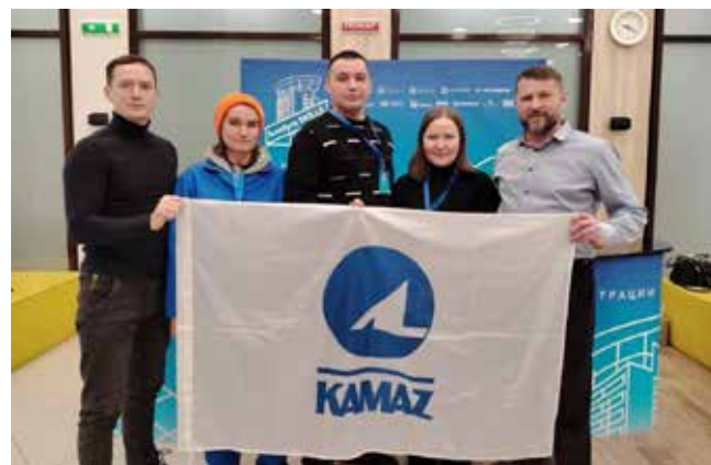
Камазовцы привезли из Елабуги четыре медали