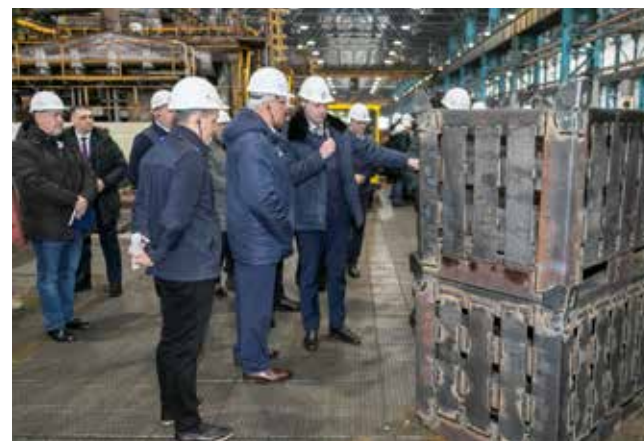
В КРМ тары не только восстанавливают, но и сами производят

до нужной температуры. Подать заявку можно будет с электронных терминалов.