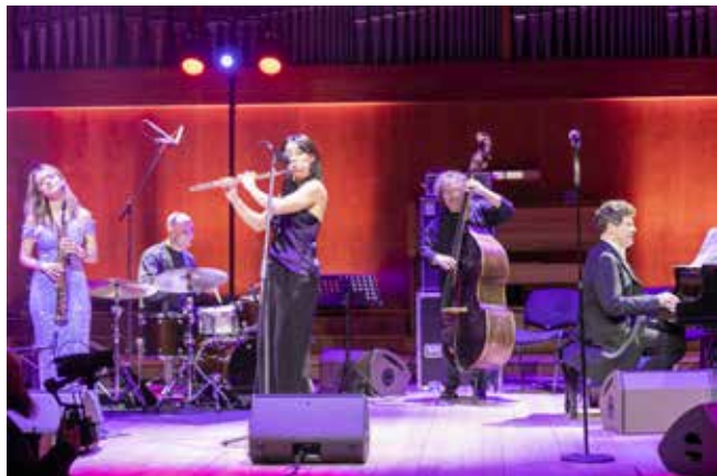
Этим вечером в джаз-бэнде были и девушки