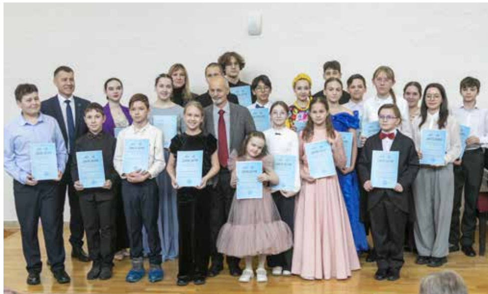
Все конкурсанты получили дипломы участников отборочного тура

ратила внимание своей подопечной, какие части композиции ей нужно усилить, подсказала, какие медиаторы лучше использовать.