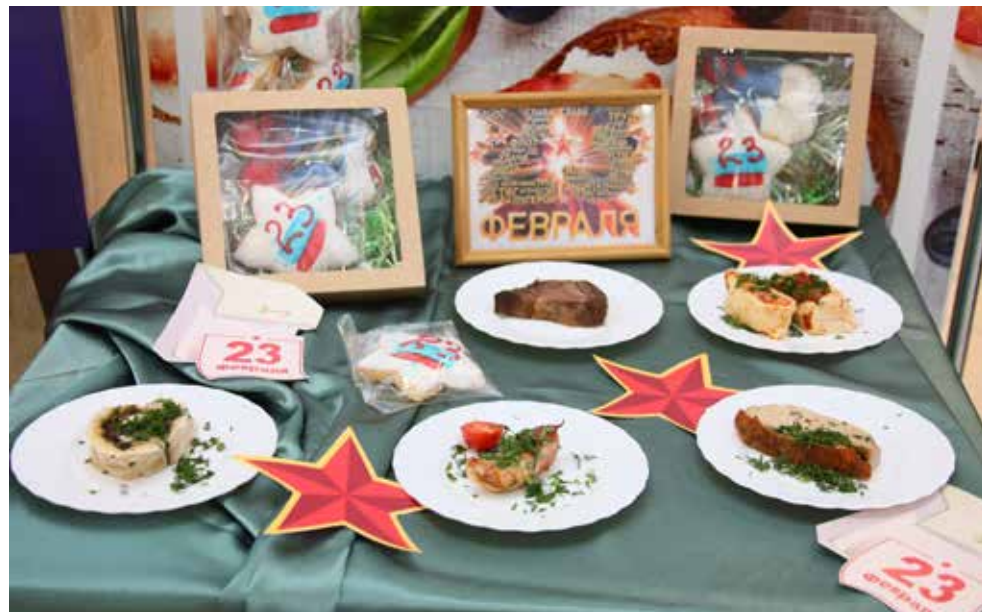
Камазовские столовые предлагают широкий ассортимент полезных и вкусных блюд

Как восполнить дефицит белка? Необходимо, чтобы каждый день на столе были мясо, рыба, птица, печень, яйца, творог (животные белки), а также горох, фасоль, чечевица, орехи (ра-