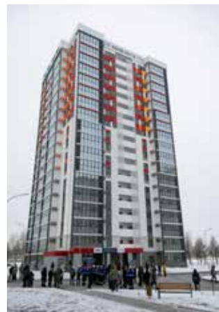
Жить в этом доме будут молодые и иногородние камазовцы

Примечательно, что и улица, на которой расположен новый жилой комплекс, имеет название 55-летия «КАМАЗа». И с новых домов здесь начинается отсчёт: номер 1 — сдан!