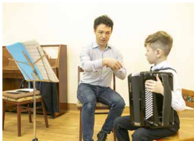
Правильная постановка руки важна при игре на баяне