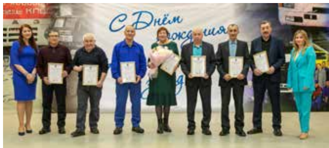
В день рождения АвЗ заводчан чествовали за многолетний добросовестный труд, профессионализм и ответственность

В прошедшую пятницу на АвЗ отметили 49 лет со дня сборки на конвейере первого большегруза. 16 февраля считается днём рождения автомобильного завода.