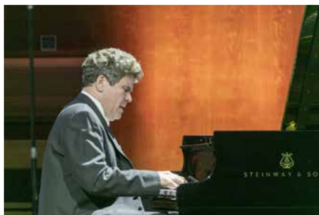
Маэстро порадовал челнинскую публику собственной премьерой, исполнив «Чакону» Баха