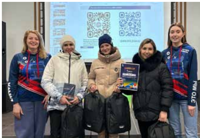
Команда профкома БПЗГД — ИД — победитель в автоквесте

показали макет гендирекции «КАМАЗа», так и не воплощённый в жизнь, и пред-