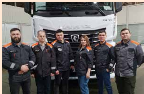
Больше всего делегацию «Урала» впечатлил уровень локализации камазовского производства

Стороны намерены сотрудничать и дальше, ведь обеим компаниям приходится решать одинаковые проблемы, связанные с дефицитом кадров, переориентацией логистических потоков, увеличения выпуска продукции. Материал об особенностях работы производственной системы «Урала» читайте в ближайшем номере «ВК».