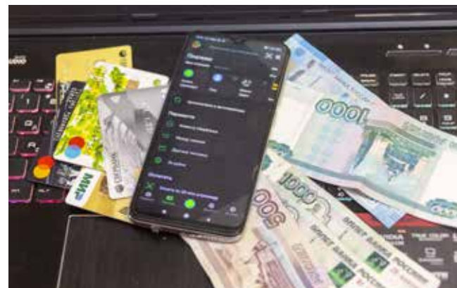
Электронные переводы, конечно, удобны, но с ними надо быть аккуратнее

Третья схема заключается в том, что неизвестный перевёл деньги и просит вернуть их на тот же счёт. Если согласиться, можно лишиться собственных денег: ведь одновременно с тем злоумышленник через банк отменяет свой перевод. То есть сумма в итоге спишется