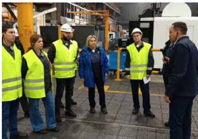
На производственном участке обсуждать опыт внедрения инструментов ПСК можно на конкретных примерах

Стороны уверены: сотрудничество необходимо продолжать, оно полезно для обеих компаний, активно развивающих бизнес.