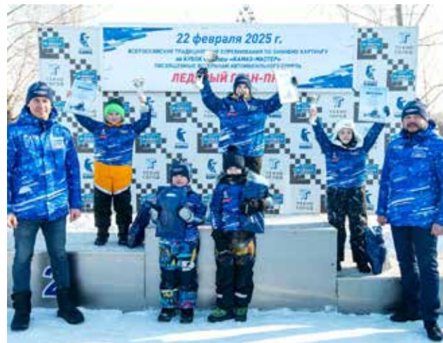
Победителей награждали именитые гонщики «Синей армады»

Подготовил Кирилл Свиридов.