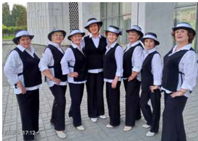
Вот они, «Романтики»

У клуба есть и собственная часовая концертная программа со своим концерансье, вокальными и танцевальными номерами. Ежегодно танцевальный клуб «Романтики» даёт более 50 бесплатных концертов. Активных артистов выступления, по их признанию, очень вдохновляют. Ведь танцы — это своего рода общение с людьми, а аплодисменты от благодарных зрителей и вовсе бесценны.