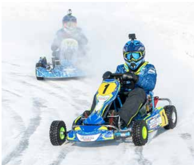
Блогеры не упустили возможность снять захватывающие кадры с гонки на камеру GoPro

Подать угощению и настроение. А как не расцвести улыбке, когда на столах и самоварах, и соусы, и варенье, и другое угощенье! Масленичные радости камазовцы уплетают за обе щёки и, пользуясь случаем, могут порцию из столовой прихватить и домой. Гуляй, Масленица!