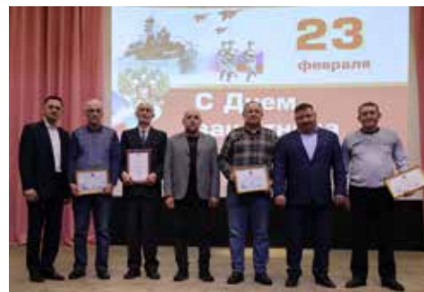
Награды от руководителей получили достойнейшие дизелисты

Завершилось мероприятие общей фотографией, которая сохранила этот день в истории завода. Концерт стал поводом не только выразить благодарность коллегам-мужчинам, но и послужил для укрепления корпоративного духа всего коллектива.