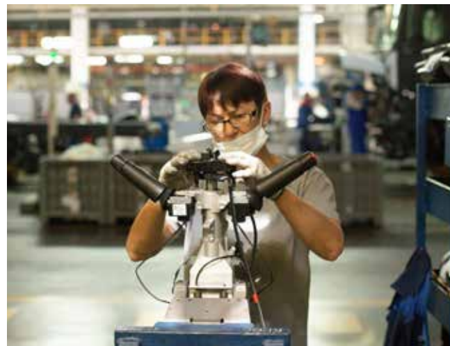
Очки защитят глаза при проведении самых разных видов работ

Но никакие меры не спасут от травмы, если, к примеру, не воспользоваться очками, предоставленными для защиты глаз. Так, 9 декабря слесарь-ремонтник ПРЗ, выполняя ремонт прессы в цехе изготовления лонжеронов, без очков выбивал молотком винт для замены неисправного узла. В глаз вместе с брызгами технической грязи попало инородное тело, работник был госпитализирован с тяжёлой травмой — прони-