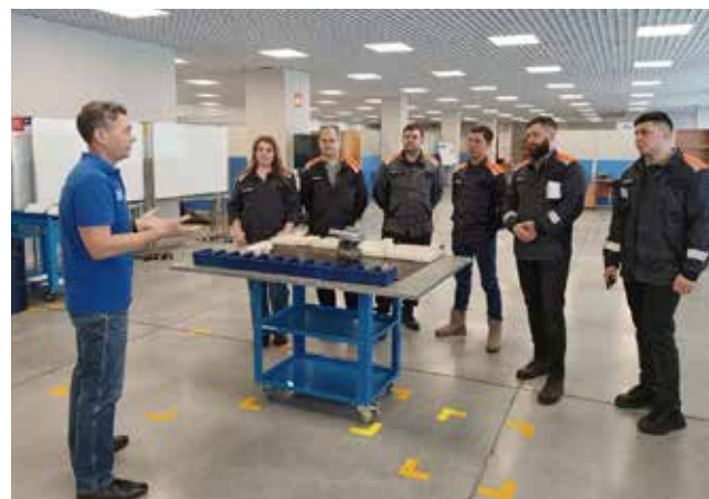
Гости с «Урала» с удовольствием приняли бы участие в тренинге