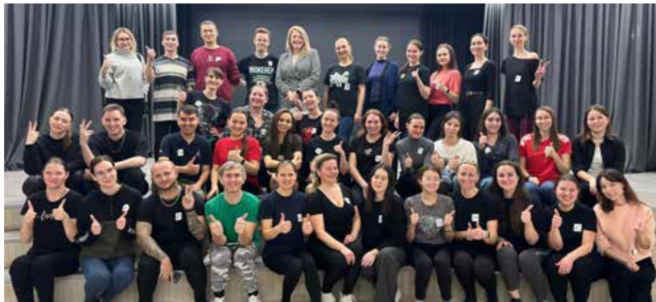
40 камазовцев решили попробовать свои силы в кастинге

Подготовка к предстоящему республиканскому фестивалю «Наше время — Безнен заман» в самом разгаре. Вслед за певцами сборную «КАМАЗа» пополнили танцоры.