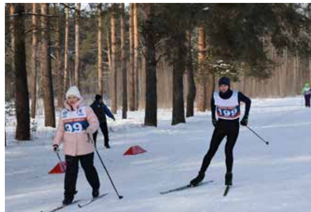
На старт, внимание... Лыжню!

Для всех участников и зрителей в этот день работала полевая кухня, где