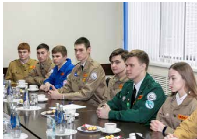
Студенты признались, что стали частью большой команды

— «КАМАЗ» отличается тем, что его строила, а потом и запускала молодёжь вашего возраста. Это очень важно, потому что одно дело прийти на готовое производство, а совсем другое — создать его с нуля собственными руками и трудиться на нём. Они заложили фундамент, сформировали крепкую и дружную