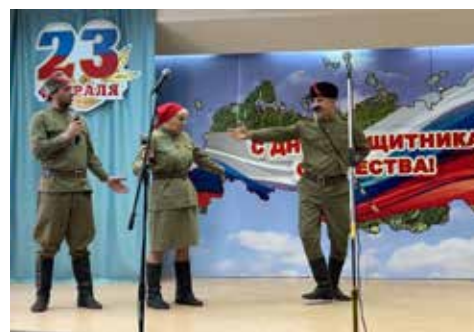
С 23 февраля работников ЛЗ поздравил Чапаев и его друзья