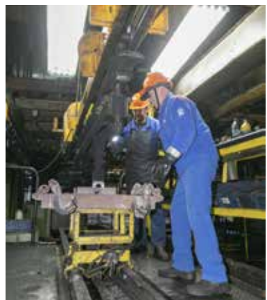
При ремонте оборудования важен опыт и смекалка

набора персонала позволит оперативно решать и другие вопросы, например, за счёт работы в выходные дни благоустраивать территорию тех же ремонтных боксов и мастерских. Уровень оказания услуг должен быть выше, чем у сторонних исполнителей, ведь те же ремонты как оборудования, так и помещений будут выполняться и в своих подразделениях. Со временем сформируется база данных участников проекта, а площадка «Биржи труда» переедет в мобильное приложение KAMAZ Mobile, а значит, набор персонала станет более оперативным.