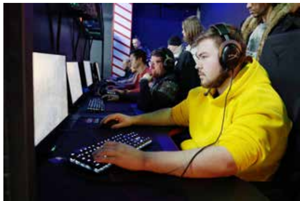
Внешнее спокойствие игроков обманчиво, на самом же деле идёт настоящая битва