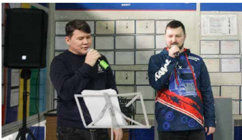
Караоке хорошо тем, что радость от пения получают и профессионалы, и любители

После окончания музыкальной паузы заводчане, направляясь на рабочие места, продолжали напевать любимое и дорогое сердцу. Тут же поступило предложение почаще нести музыку прямо на производственные участки. Осталось определиться с поводом и местом проведения очередной караоке-сессии.