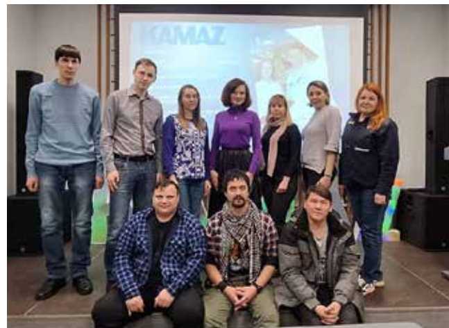
В хорошей компании и со сложными документами разобраться проще

Камазовцы активно задавали вопросы: их интересовала оплата дополнительных выходных дней, положенных за вредные условия труда, предоставление оплачиваемых отгулов в случае ДТП, отпуск по уходу за родителем, нуждающимся в помощи. Самые непростые