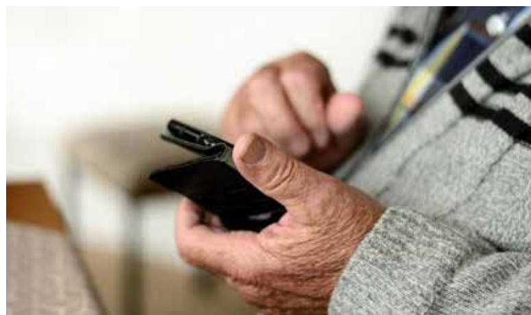
Звонок от незнакомца? Насторожитесь!

В рамках этой схемы во время звонка мошенники сообщают пожилым людям, что их деньги находятся под угрозой. Атака идёт по всем фронтам: звонят якобы с «Госуслуг» и говорят, что банки запросили кредитную историю, чтобы оформить на него кредит, потом подключается «менеджер банка», который подтверждает, что пенсионеру выдали кредит на большую сумму, затем звонок переводят на «специалиста из Центробанка», который предлагает перевести деньги на некий безопасный счёт, чтобы уберечь их