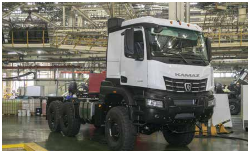
Для нового большегруза КАМАЗ-65954 нет преград, которые бы он не преодолел

Прочный передний бампер с изменённой нижней частью защитит кабину и обеспечит увеличенный угол въезда. Обладатель двигателя Р6 мощностью 560 л.с. может тянуть полуприцеп-тяжеловоз со строительной техникой — грейдером или