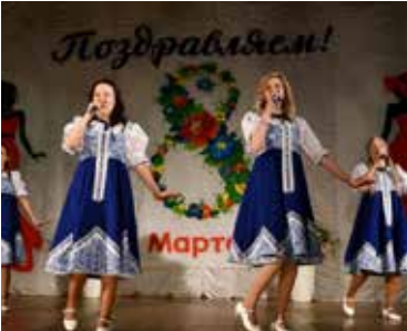
Концерт получился отличным

Покидали концерт виновницы торжества в приподнятом настроении.