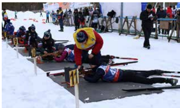
На соревнованиях биатлонистов ждали два огневых рубежа