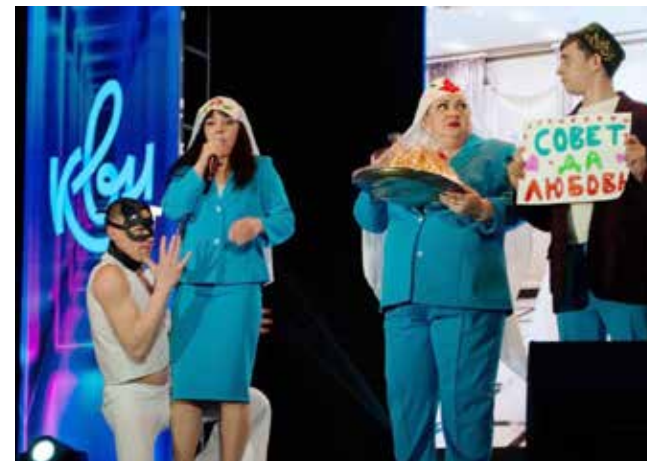
В миниатюре «Полного привода» артист зашёл не в ту дверь и... оказался на нике

— Вот подъезжаем мы на КАМАЗе к ДК химиков, а охранник подбегает и кричит: «Нету здесь места!» Обидно как-то получается — в Казани для КАМАЗа места нет, — размышлял на сцене