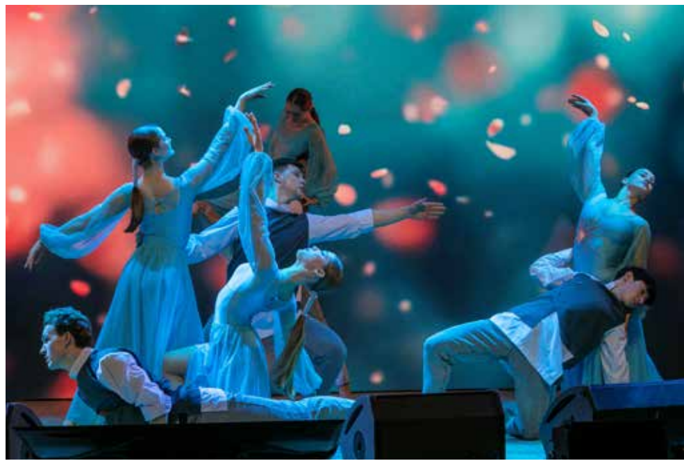
Ансамбль танца «Татарстан» привнёс лёгкости и красоты: выступление одетых в невесомые одежды девушек и обходительных юношей заворовало зал