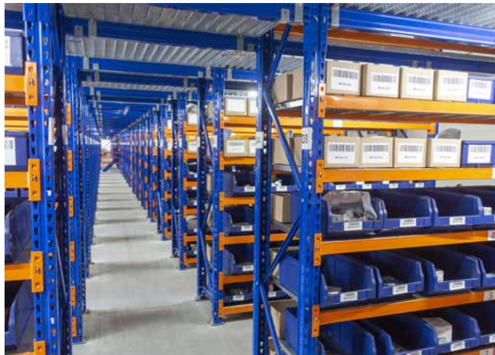
Наряду с лучшими эталонными офисными и производственными участками теперь будет оцениваться лучший эталонный склад

— В новом положении особое внимание уделено состоянию рабочих мест камазовцев. Наряду с лучшими эталонными офисными и производственными участками теперь будет оцениваться лучший эталонный склад. Заявки на участие в конкурсе в этой номинации могут подать коллективы РИЗа, подразделений блоков по закупкам, по продажам и сервису, логистического центра, ООО «КАМАЗ-Энерго», ВТК «КАМАЗ» и «АвтоЗапчасть КАМАЗ». В чек-листе оценки претендентов на победу в номинации «Лучший эталонный склад» 34 пункта. Особое внимание будет уделяться визуализации оборудования для хранения деталей, инструментов, комплектующих, отслеживанию ключевых показателей эффективности по исполнению заказа, улучшению эргономики рабочих мест. Такие показатели как подача кайдзен-предложений и участие в конкурсе «Лидер PSK» теперь обязательны при подаче заявки в номи-