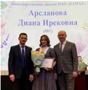
Лучшие работницы удостоены почётных грамот и благодарностей

Также публику порадовала и вокальная группа «Лира» завода двигателей. Их выступление стало ещё