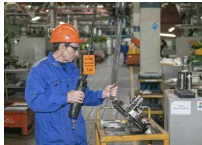
Герой качества выполняет ежедневный план на 130–150%