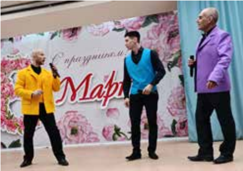
На литейном не было недостатка в мужских признаниях

Разбавляли восторженную риторику вредные советы от двух конференсье о том, как подготовиться к 8 Марта, как выбрать подарок и отпраздновать. К примеру, как вы, милые дамы, относитесь к крему для бритья в качестве подарка? Не торопитесь возмущаться: в его пользу есть неоспоримый, по мнению ведущих, аргумент — гладко выбритый муж. Ещё один эффективный метод придумать подарок — представить, что сам хотел бы получить к 23 февраля, и провести