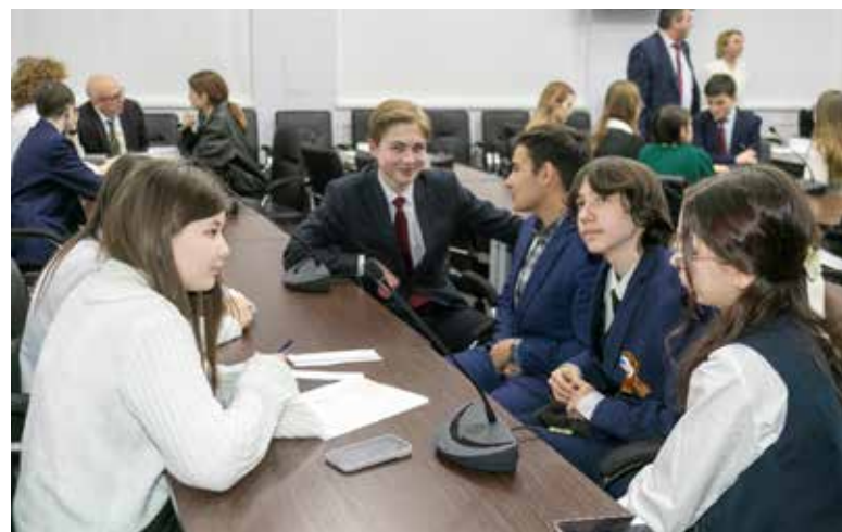
Интеллектуальный турнир — это интересно

А в завершение встречи ребят ожидал интеллектуальный турнир «Право и всё, что с этим связано», организованный сотрудниками службы правового обеспечения дочерних обществ ЦПО. Ученикам предстояло ответить на интересные вопросы про законы, угадать фильм по описанию и многое другое.