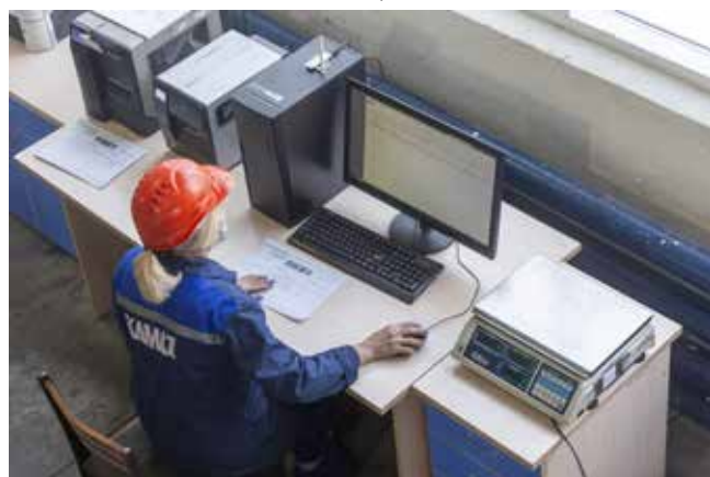
В новом положении особое внимание уделено состоянию рабочих мест

— Действительно, разработка идеи, будь то предложение по улучшению или кайдзен-проект, требует времени и внимания, и здесь важна роль руководства — насколько оно заинтересовало в снижении потерь и оптимизации процессов. На победы в номинациях «Лидер PSK» начального и среднего звена управления могут претендовать только руководители, активно внедряющие личные кайдзен-проекты и вовлекающие персонал в процесс улучшений, а значит, продвигающие корпоративную культуру. Работа над улучшениями — это постоянный процесс. Каждый кайдзен делает нашу работу безопаснее, удобнее, качественнее, выигрывают от их реализации все. А конкурс — это шанс вписать своё имя в историю «КАМАЗа» и получить материальное вознаграждение.