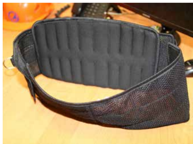
Экзоскелет, используемый в ЛЦ, — простой удобный пояс

рят границы человеческих возможностей, позволят выйти на новый уровень продуктивности, а это как раз то, что необходимо «КАМАЗу».