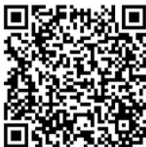
По этому QR-коду можно пройти опрос