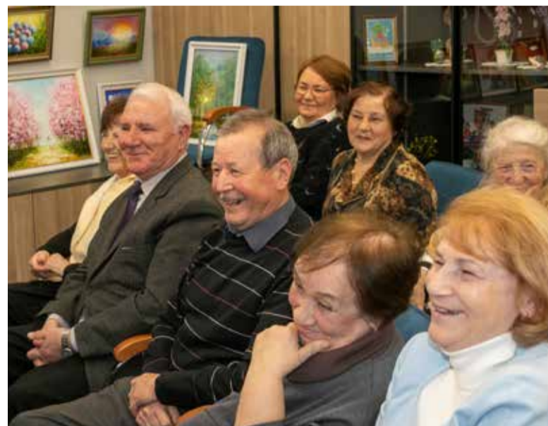
...и это доставляет им радость