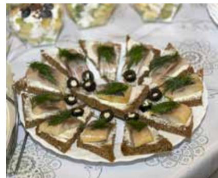
Сельдь — источник омега-3 и хорошего настроения

Другой вопрос — качество продуктов. Важно быть уверенным, что в