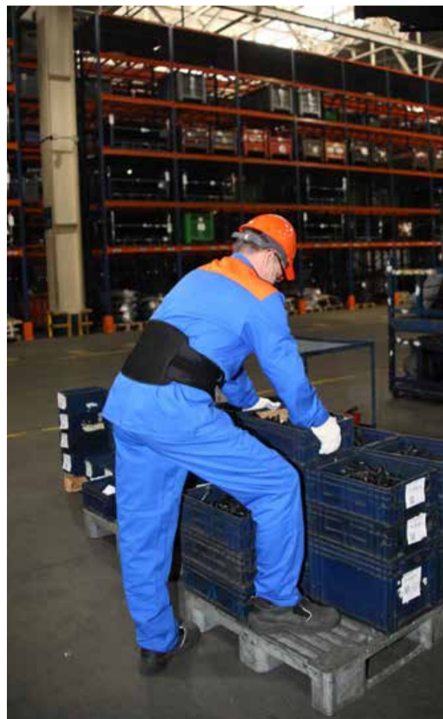
Перетаривать и переносить детали с таким поясом гораздо легче

Получив обратную связь от пользователей, в логистическом центре решили открыть проект с масштабированием опыта в подразделениях компании. В этом году планируется закупить 68 пассивных экзоскелетов, которые будут направлены для работы сотрудникам логистических зон, распо-