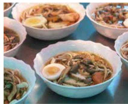
В супе рамен много витаминов и жиров

сливочном масле нет вредных примесей, а растительное хранилось в надлежащих условиях, ведь длительное хранение в тепле и на свету приводит к его окислению и делает такой продукт опасным для здоровья.