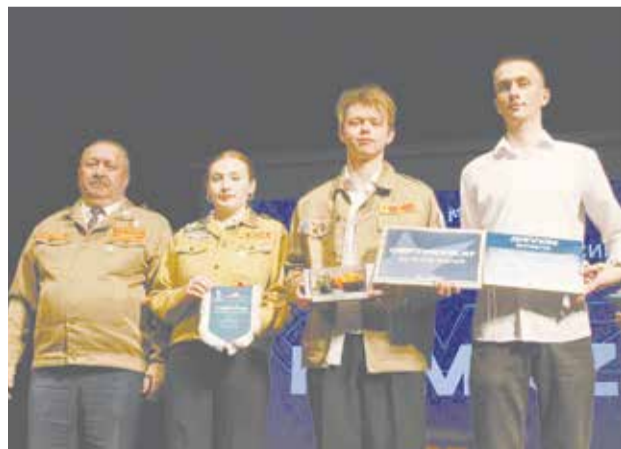
Лучшим студотрядам вручили дипломы, сертификаты и модельки КАМАЗов

На сцене они поздравили победителей зимнего этапа. Лучшим студотрядом признали ССПРО «Тесла», по комиссарской деятельности — ССПРО «Сармат», а по производственным показателям — ССПРО «Марий Эл».