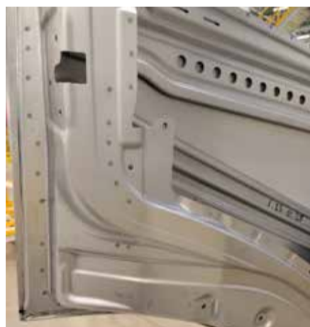
Специалистам завода каркасов кабин удалось сделать на новом контуре двери аккуратную вальцовку

Он уверен: у этого продукта большое будущее — в перспективе эта модель поколения K5 успешно заменит кабины поколения K3, которые широко использовались на КАМАЗах не один десяток лет. В совокупности с «Компасом» вид нового транспорта сможет закрыть всю нишу развозных и специальных автомобилей, надо только завоевать симпатии потребителей. Этот большой путь ещё предстоит пройти другой команде руководителей и специалистов компании.