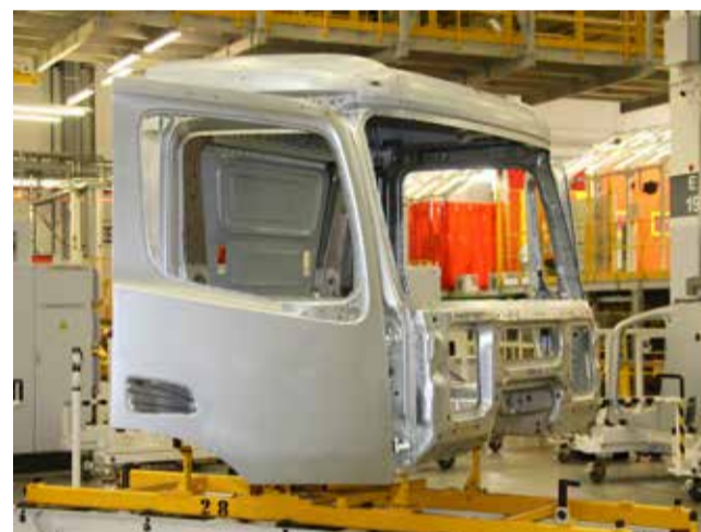
Первое, что бросается в глаза в конструкции кабины, — двери с вырезом под колёсную арку

Технологи признаются: некоторые задачи поначалу ставили их в тупик, не раз приходилось обращаться за помощью к коллегам из НТЦ, но решение всё же удавалось найти. Каркас новой кабины соответствует всем требованиям по качеству. Возможности линии сварки каркасов расширились, теперь на ней производят дополнительный тип каркаса кабины и дверей для поколения K5. Всего освоено четыре типа каркаса кабины. Продуктовый портфель