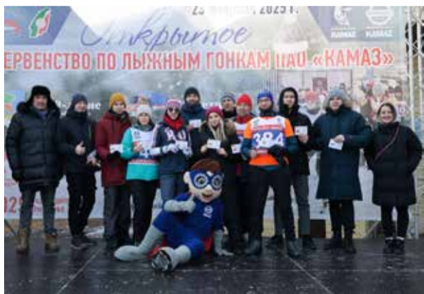
12 камазовцев готовы к труду и обороне на «отлично»

С 2025 года можно получить налоговый вычет за выполнение нормативов ГТО. Его размер за год составит 18000 рублей. Но если же вы платите налог по ставке 13%, то возможно вернуть 2340 рублей. Чтобы получить вычет, сначала необходимо сдать нормативы, получить знак отличия или подтвердить ранее полученный, а затем в том же году пройти диспансеризацию.