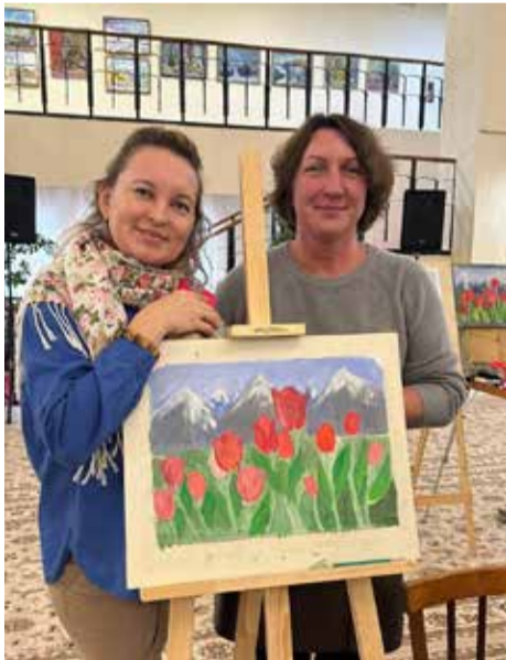
Картины с настроением получились у всех

Ну а после вдохновлённые примером участницы встали за мольберты и взяли в руки кисти. Им предстояло гуашью написать картину «Горы и тюльпаны» — дело это хоть и непростое, но справились все. К концу мастер-класса у каждой участницы была собственноручно созданная картина — свои творения начинающие художницы забрали домой, на память о прекрасно проведённом выходном дне в хорошей компании.