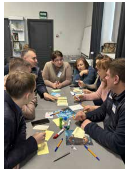
Тренеры по качеству поделились своим опытом и наметили планы сообщества

Речь зашла и о необходимости создать стандартизированную площадку для работы с группой тренера по качеству со всеми нужными техническими возможностями. Ещё обсудили материальную и нематериальную мотивацию тренеров. Кроме того, собравшиеся поговорили о дальнейшем развитии сообщества, упомянув посещение заводов для обмена опытом друг с другом, а также создание единой базы необходимых материалов для тренеров.