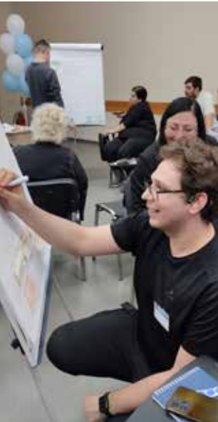
За разработку системы развития наставничества конкурсанты взялись с азартом

— Говорят, будущее за технологиями, но не надо забывать о том, что важно уметь передать опыт их использования, — подчеркнул он. — Вы, воспитывая смену, делаете нашу компанию сильнее. Помните об этом, и пусть ваши ученики чаще благодарят вас за верность профессии и участие в их судьбе.