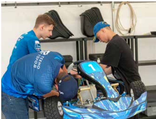
Учиться на механика можно уже с 14 лет

Вот это мотивация для челинских ребят! От них требуется энтузиазм и любовь к технике, а знаниями и поддержкой их обязательно обеспечат. Такая она, школа механиков.