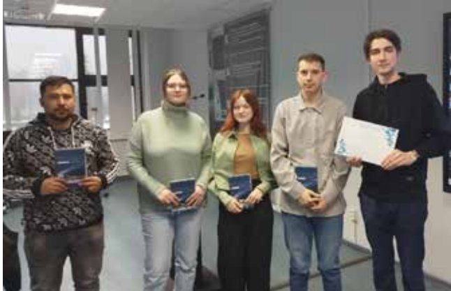
Студенты, знающие историю «КАМАЗа», получили памятные подарки

рекламные буклеты о блоке продаж. Пусть будут под рукой, ведь до защиты диплома этим студентам всего пара месяцев.