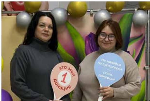
Эти девушки приняли участие в акции впервые

По словам Ахмедзяновой, следующая акция запланирована на май-июнь.