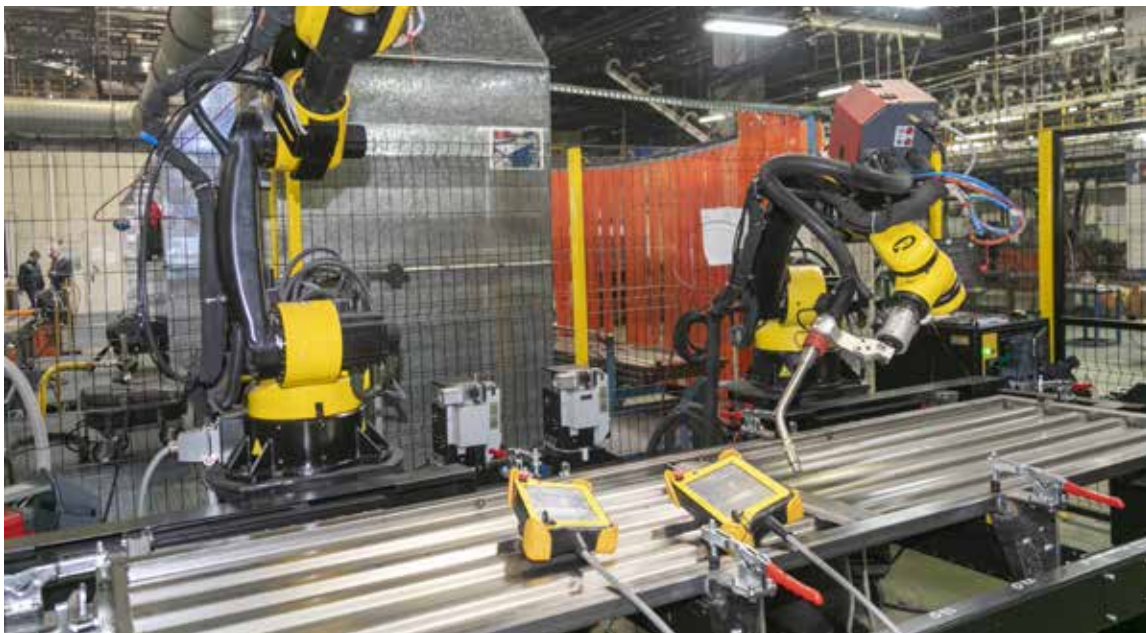
ПРЗ — один из лидеров по оснащению робототехническими комплексами

Успех реализации планов во многом зависит от инициативы и активного участия в проектах руководителей начального звена управления. Они, в свою очередь, как никто другой заинтересованы в улучшении условий труда, повышении эргономичности рабочих мест, устойчивом развитии производства. Но, чтобы успешно интегрировать новые технологии, важно отладить все процессы. Время на подготовку есть.