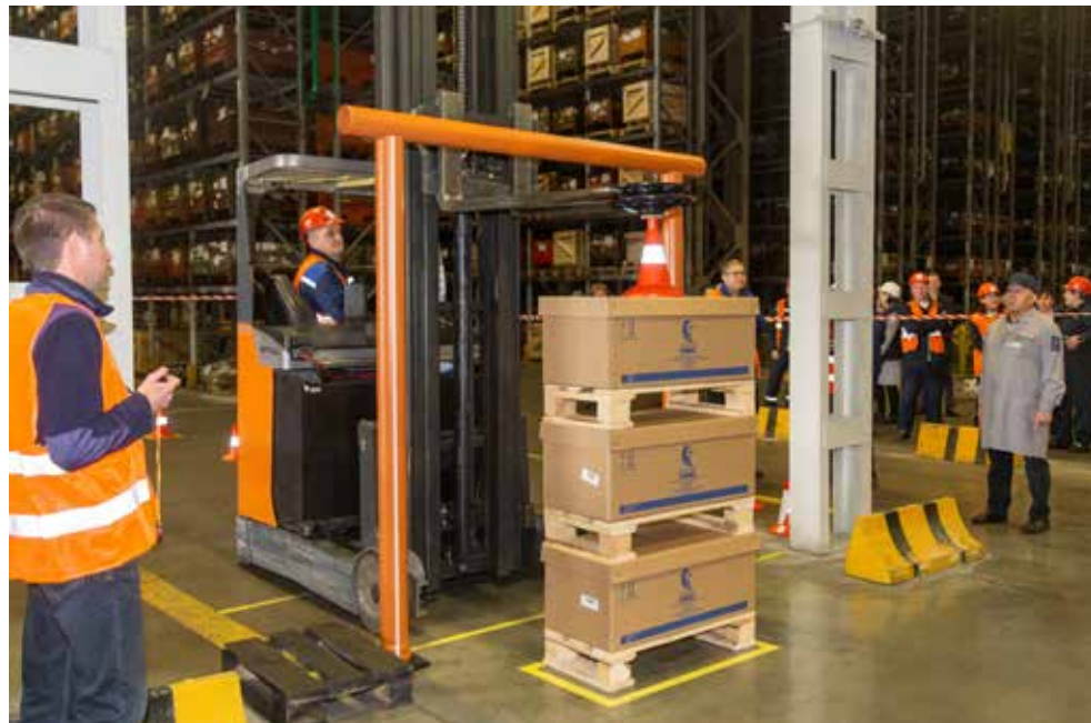
Установить тарелочки на конус — задача сложная, ведь нужно найти баланс, чтобы конструкция не рассыпалась

— Каждое задание имитирует определённый процесс. Вот, например, возьмём башню с тарелками. Тарелки устойчивы только в одном положении, поэтому от конкурсантов требуется точность в их установке, — поясняет Рашат Шайхуллин. — На своих рабочих местах водители должны аккуратно оставлять грузы на стеллажах, чтобы они не упали.