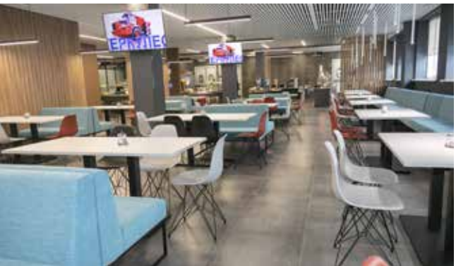
Ну чем не кафе?