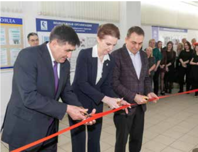
Ленточка торжественно перерезана, в столовой распахнуты двери