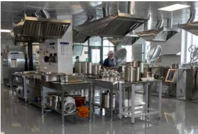
Кухня в обновлённой столовой оснащена самым современным оборудованием