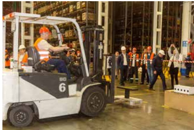
С филигранной точностью каждый конкурсант закрывал мишени в биатлоне

— Мы не стали применять санкции в отношении участников. Например, если конкурсант роняет конус или тарелку на пол, он может выйти из транспорта, поднять их, вернуть на исходную позицию, выполнить не получившееся действие ещё раз. Но время у него идёт... — обращает внимание на такую деталь соревнования главный судья и добавляет: — При этом есть небольшая сложность конкурса. В этом году водители соревнуются не только на погрузчиках, но и на ричтраке. Мы ввели его неслучайно: в «АЗК» нам нужны универсалы, умеющие работать на разном транспорте. А конкурс — это своеобразный стимул к получению новых навыков.