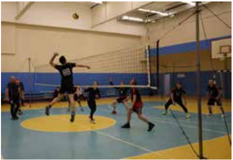
Сильные удары — украшение любого матча

Следующие матчи намечены на сегодня, 21 марта. БЗГД — ДР сыграет с РИЗом, «РД» померится силами с ЛЦ, КЗ будет противостоять ЛЗ.