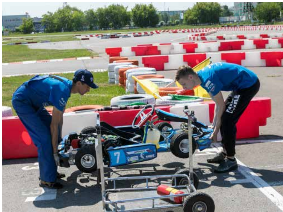
Работа на соревнованиях даст возможность набраться опыта

— В рамках секции мы готовим специалистов широкого профиля для работы на спортивных соревнованиях. Во-первых, конечно, ребята узнают об устройстве карта, из каких узлов он состоит, как происходит настройка техники в различных условиях. К примеру, давление в шинах регулируется в зависимости от температуры воздуха и влажности. Карбюратор тоже можно настроить под расход топлива — нюансов в этом деле очень много, и именно в них дети будут с нашей помощью раз-