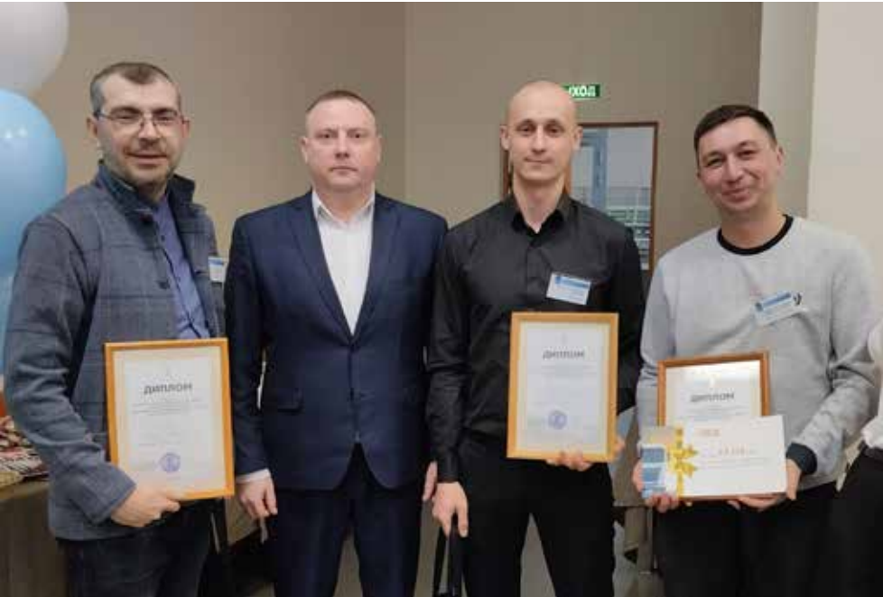
Вот они, призёры конкурса «Наставник-2025»!

В конце прошлого года молодой рабочий прошёл обучение по корпоративной программе «Подготовка наставника». А полтора месяца назад был назначен мастером цеха сборки кабин поколения К5. Наверняка сделать этот шаг по карьерной лестнице помог и опыт наставника.