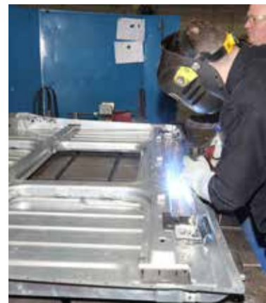
Новая плоская крыша для каркаса кабины К5 была собрана на опытно-промышленном заводе НТЦ

блока развития появилась новая её модификация с плоской крышей без спального места.