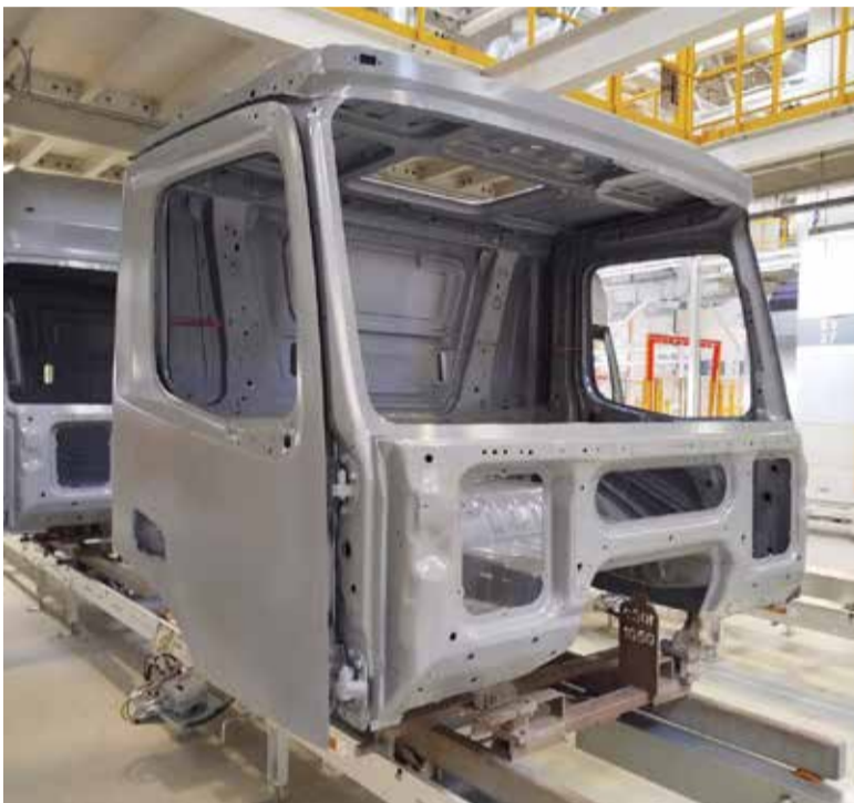
Новый каркас — полностью оригинальная разработка камазовцев

На опытно-промышленном заводе НТЦ изготовили новый каркас кабины К5 с плоской крышей. Этот продукт дополнит линейку автомобилей для МЧС, а также семейства этого поколения. Новая конструкция кабины открывает и новые горизонты для использования КАМАЗов в России и дружественных странах: на автомобилях с крановой установкой, авторефрижераторах, коммунальной технике.