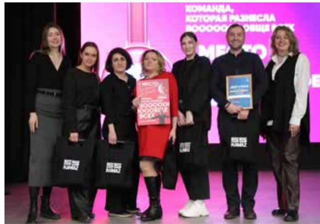
Команда «АЗК» набрала 50 баллов и стала победителем квиза

не было, поэтому вопросы оказались из разных сфер и областей, проверяющие знания и логику игроков. К примеру, «Правда ли, что женское сердце в среднем бьётся быстрее, чем мужское?» (ответ: правда).