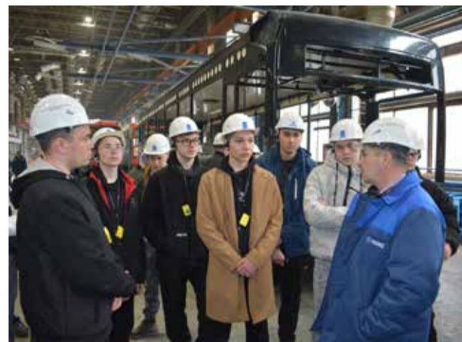
Сварщики «НЕФАЗу» очень нужны

Так что знакомство с «НЕФАЗом» определённо задалось. И, возможно, совсем скоро кто-то из студентов решит вернуться на завод для прохождения производственной практики. Увидеть увидели, осталось попробовать!