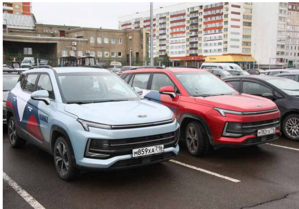
Корпоративный каршеринг — это удобно

Все автомобили застрахованы по ОСАГО и КАСКО, так что в случае возникновения ДТП страховые выплаты покроют нанесённый ущерб — от пользователя требуется лишь оформить все соответствующие документы... Ну и бережно относиться к доверенному ему имуществу и своей безопасности, конечно. Несмотря на это, оператор сервиса настоятельно рекомендует проводить фотофиксацию автомобиля до и после пользования услугой (это возможно сделать посредством мобильного приложения), она станет неоспоримым доказательством состояния автомобиля как до, так и после аренды.