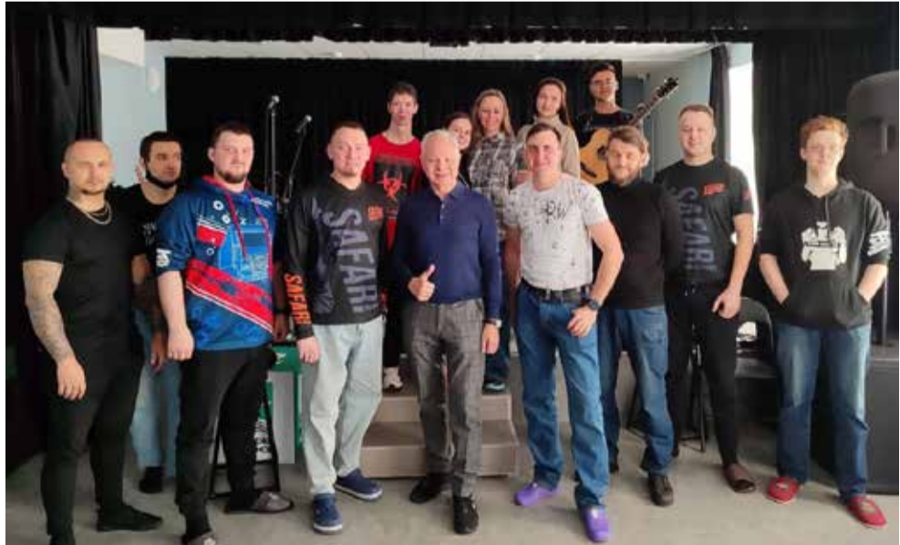
Участники кастинга получили ценные советы от профессиональных музыкантов

Как рассказывает начальник отдела по работе с молодёжью профкома «КАМАЗа» Лидия Касимова, впереди участников ждут индивидуальные занятия. На них профессиональные музыканты будут оценивать навыки игры на инструментах. В дальнейшем планируются репетиции.