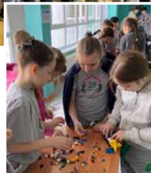
Конструировать стремятся даже девочки

Завершился День «КАМАЗа» награждением победителей творческих конкурсов «КАМАЗ будущего» (конкурс рисунков), «Я и КАМАЗ» (конкурс селфи), «Про КАМАЗ» (конкурс мини-стихов). Самые активные и талантливые получили дипломы и сувениры, более того, каждому школьнику вручили подарки от «КАМАЗа». Кроме того, все желающие смогли