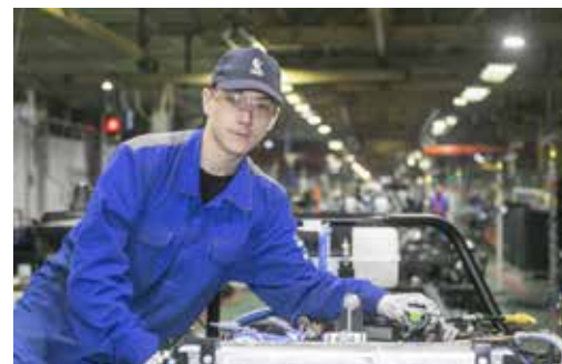
На «КАМАЗе» всегда рады молодёжи

Я искренне благодарен нашему коллективу за неравнодушие. Верю, что вместе мы найдём выход из любой ситуации и справимся с любыми вызовами. История подтвердит: их на веку «КАМАЗа» было немало... Но разве это когда-нибудь нас останавливало?