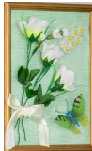
Объёмная картина выполнена до того реалистично, что, кажется, даже лёгкий запах цветов чувствуется от одного взгляда на неё

Волковой, в котором ярко изображаются «муки творчества» — когда хочется всего и сразу, было бы время и желание. Прозвучали от мастериц и строчки авторства Зинаиды Торопчиной: