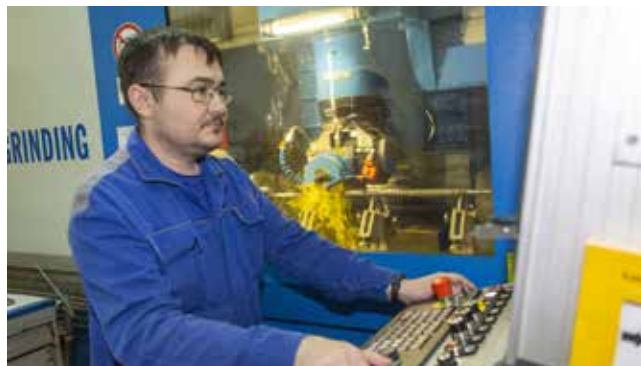
Специалисты РИЗа осваивают любое оборудование

Ещё хочу отметить нашу активную работу с колледжами и училищами. Под наши нужды готовятся группы токарей и фрезеровщиков. Надеюсь, что если не 100% этих молодых специалистов придут к нам, то большинство.