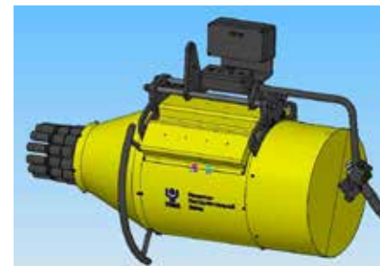
Собственная разработка рязовцев — 12-шпиндельный гайковёрт — поможет в работе на заводе мостов