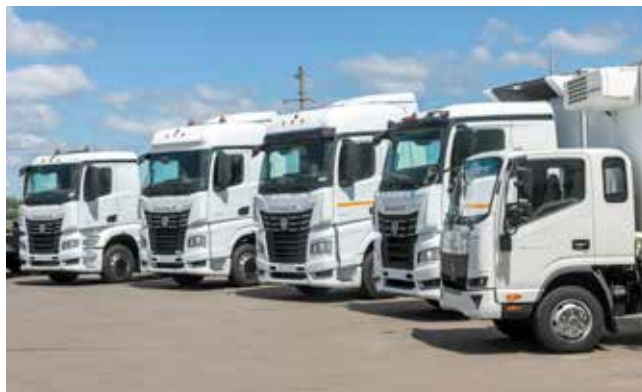
В ближайших планах предприятия — расширение линейки K5

работы, когда наши зарубежные партнёры вынуждены были по политическим причинам покинуть наш рынок. Разумеется, это повлекло за собой нехватку части комплектующих, необходимость в срочном порядке осваивать производство новых деталей или искать им замену. Весь коллектив «КАМАЗа» в этот момент показал себя с наилучшей стороны — мы справились, не ушли в простой и продолжаем развивать модельный ряд нашей автотехники. Вторым вызовом стал, конечно, рост гособоронзаказа, когда резко выросла трудоёмкость и интенсивность работы. Я гор-