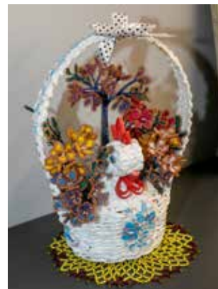
Такая корзинка украсит любой интерьер

Ко встрече в Литературной гостиной подготовили участницы и тематические стихотворения. Прорекламировали мастерицы «Гимн хомяка» Анны