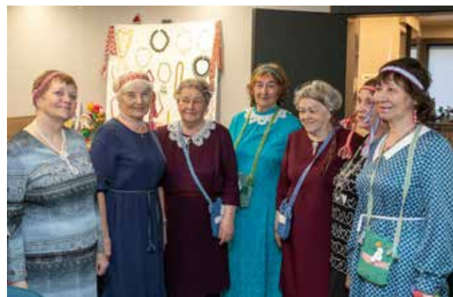
Умело исполненные задумки можно смело носить и в обычной жизни