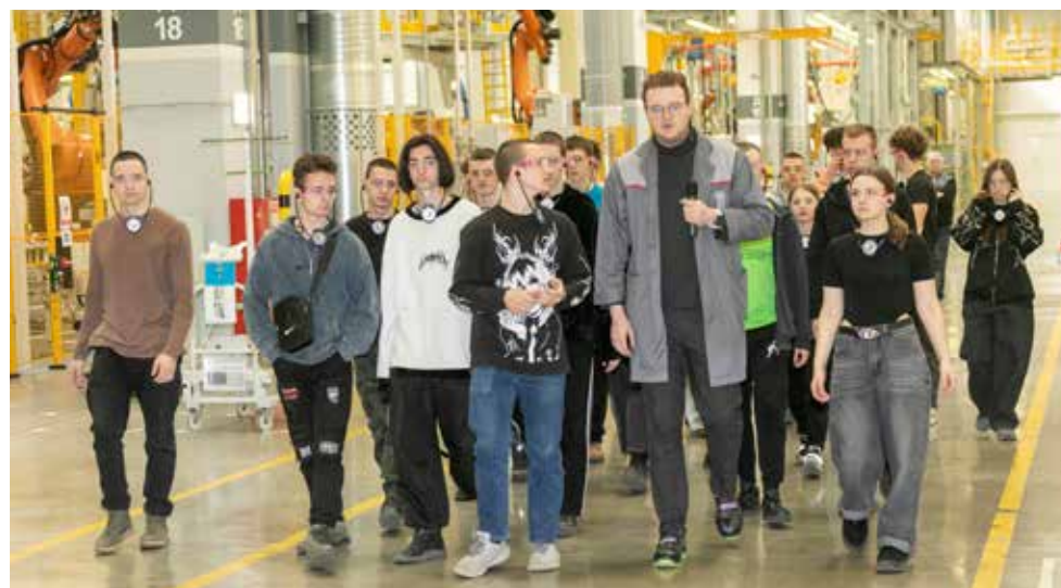
На заводе каркасов кабин поражает автоматизация производства, и становится понятным, что без образования в будущем не обойтись

На площадке «КАМАЗ-Автоспорт» наверняка сбылась чья-то мечта поближе познакомиться с пилотами «Синей армады». Оказалось, в их команде, как и на полигоне НТЦ, много молодых инженеров-конструкторов,