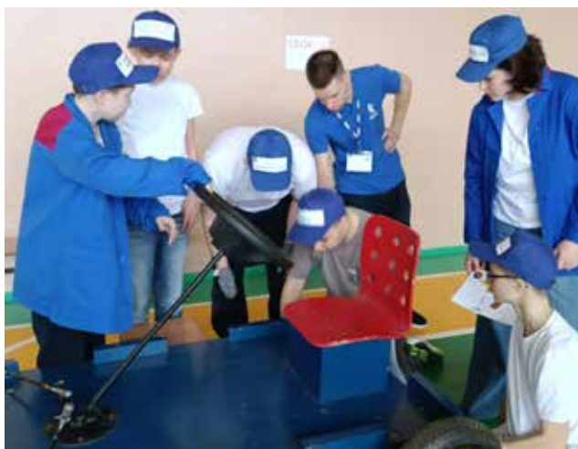
Примерять профессии лучше всего в деле, например, в сборке болида

Прошедшая неделя для учеников школы № 23 началась с праздника — в гости пришли шефы с пресово-рамного завода и устроили День «КАМАЗа». Но, как известно, любой экспромт требует основательной подготовки: предварительно школьники получили домашнее задание и, судя по оценкам заводского жюри, справились с ним отлично!