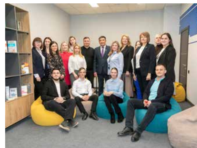
Это фото положило начало истории общих достижений

ством для отдыха и неформального общения был разработан службой главного дизайнера «КАМАЗа», а о его наполнении полезным содержанием позаботилось руководство и профком. После опроса сотрудников сюда были закуплены книги, популярные настольные и развивающие игры, а кубки