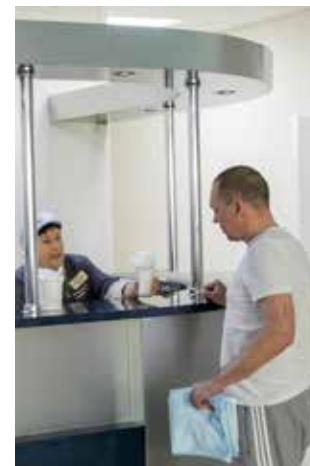
В клинике-санатории прилагают все усилия для оздоровления камазовцев

— Для полного восстановления, конечно, необходимо более продолжительный курс лечения, но нашим специалистам удаётся главное — повысить функциональные возможности организма, восстановить силы. К тому