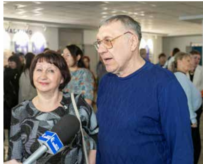
Супруги Платоновы, отдавшие РИЗу более 40 лет, пожелали родному предприятию ещё долгой успешной работы

(«Вместе»). Ещё со сцены прозвучало стихотворение в адрес ветеранов РИЗа: