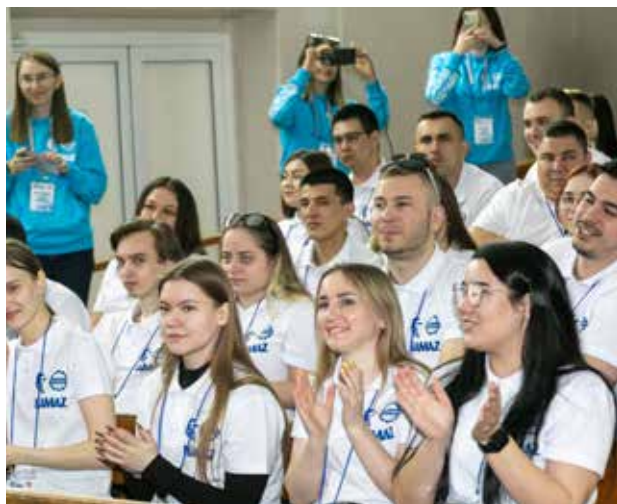
Молодые камазовцы соберутся на форуме в девятый раз

13 апреля организаторы запланировали образовательный блок, перед обедом состоится импровизационное шоу «КАМАЗ» — движок будущего», а затем пройдёт закрытие форума и подведение итогов.