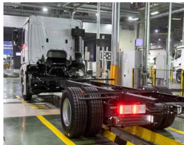
На длинную раму удобно крепить самое разное оборудование

У первого среднетоннажника поколения К5 длинная рама, на которую может быть смонтировано оборудование для рефрижератора, эвакуатора, краново-манипуляторной установки. Возможно, на этот экземпляр будет установлен фургон, он ближе к родной для этого класса грузовиков теме ритейла. А первый выход на широкую публику состоится, как и у его предшественника КАМАЗа-5325, на выставке. Пусть он будет удачным!