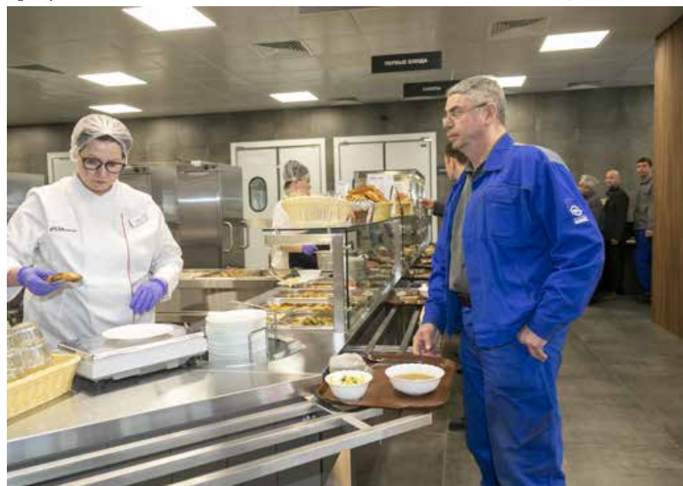
Камазовские столовые предлагают полноценное меню

— Применять на производстве халаты по новым изменениям в законодательстве больше недопустимо. Руководителям, специалистам и ИТР, бригадирам, мастерам выдаются СИЗ с теми же защитными свойствами, как и для работников. Переодеваться можно в мужских и женских раздевалках с достаточным