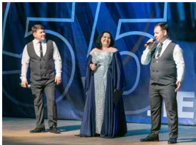
Как не подпеть голосистым артистам?