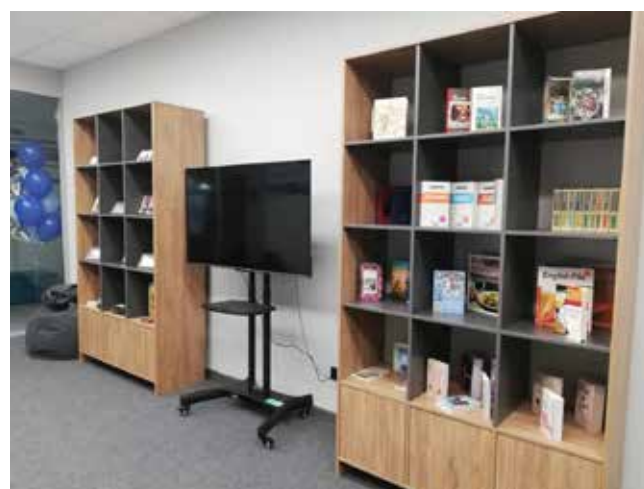
Здесь есть что почитать и чему поучиться