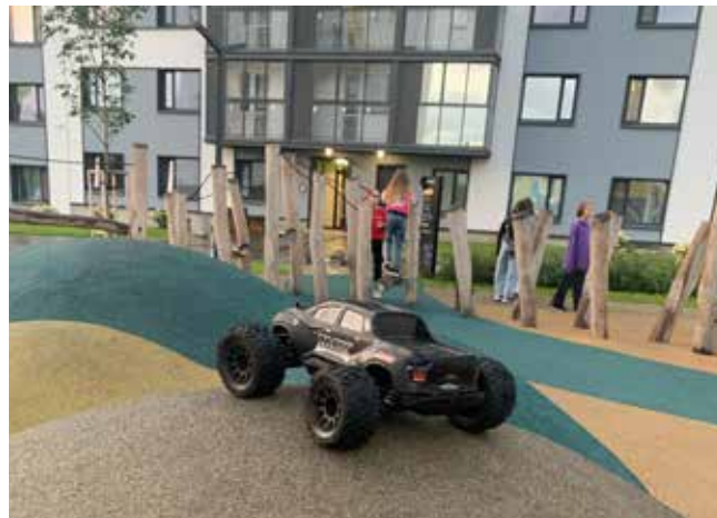
Такой монстр-трак проедет по любому бездорожью не хуже своего полноразмерного собрата

Так что, похоже, наши догадки в начале статьи оказались верными. Можно смело брать на вооружение!