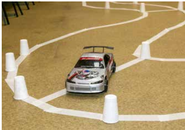
Эта маленькая машинка создана для дрифта

3 апреля на заводе запасных частей и компонентов прошло первое в истории «КАМАЗа» соревнование по RC-гонкам.