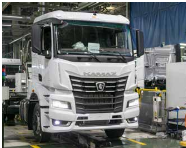
Этот грузовик станет флагманом среднетоннажного семейства

Новое поколение развозных грузовиков, пока представленное в единственном экземпляре, тоже имеет все шансы на покорение сердец ритейлеров, городских и коммунальных служб. Кабина у него ещё более комфортная, с кондиционером, круиз-контролем, бортовой информационной