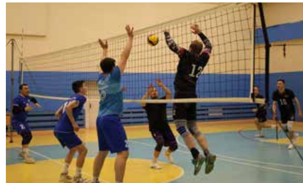
Финал первенства между «ЧВК» и «РД» вышел зрелищным

В полуфинале автомобилисты встретились с «РД», а ЗД сразился с «ЧВК». По итогу этих матчей в финал вышли «РД» и «Челныводоканал», в котором оказались сильнее спортсмены «ЧВК». В матче за третье место боролись ЗД и АвЗ, в итоге дизелисты завоевали «бронзу». Состоялись матчи за малый кубок. Здесь боролись команды, занявшие в группах третьи и четвёртые места. В финале литейщики обыграли волейболистов ЗЗЧИК.