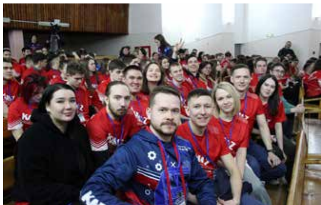
Атмосфера форума? Молодёжная!