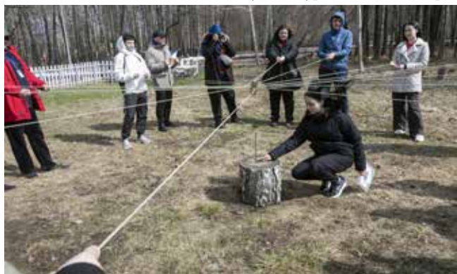
Смотри, в пне уже есть один гвоздь. Значит, и у нас получится забить такой же!

На закрытии форума подвели итоги, каждый получил сертификат участника события, а самое главное, приобрёл новые знания и знакомства.