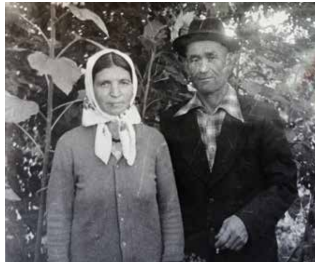
Супруги Хузины всю жизнь шли рука об руку

День Победы пришёл с громогласным объявлением Левитана: «Наши взяли Берлин! Война закончилась!» Народ ликова, высыпал на улицы. Многие