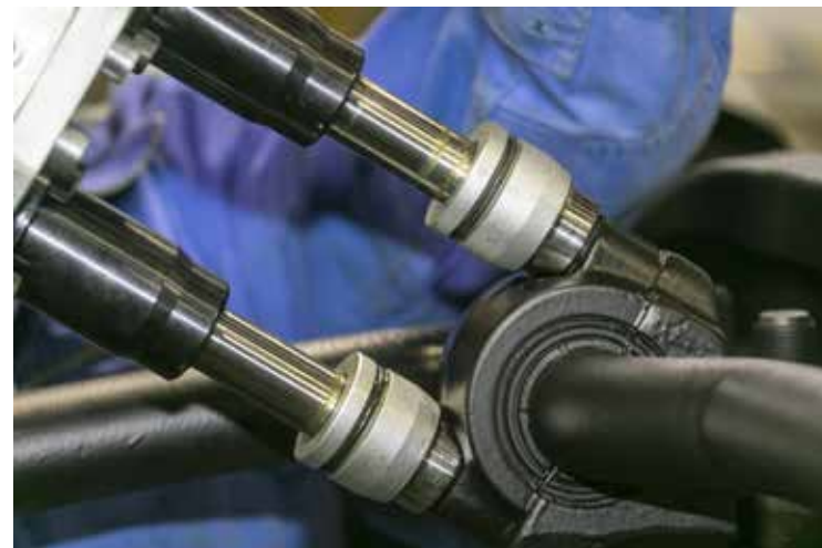
Двухшпиндельный гайковёрт сам контролирует надёжность соединения