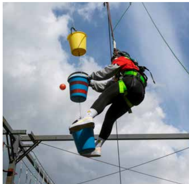
Что сильнее — страх перед высотой или желание побыстрее закинуть в корзину шарики?

На квесте «Легенды КАМАЗа» одни пытались соорудить устойчивую метровую башенку из верёвочки, кусочка скотча, спагетти и маршмеллоу. Другие вставляли паровозиком и выполняли задания ведущего: тоннель означал, что нужно присаживаться, а мост — разводить руки. Темп выполнения ускорялся. Импровизировали на шоу «КАМАЗ — движок будущего». Например, представляли, как звучали бы песни, если бы вся Россия ездил на китайских машинах. А игру «КАМАЗ будущего» разделили на два этапа: на первом проводилась интеллекту-