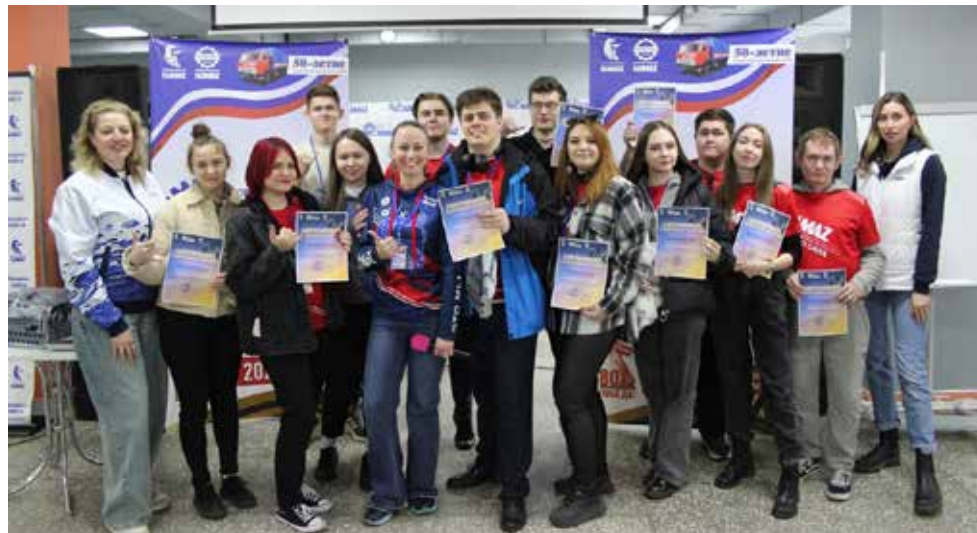
Каждый участник получил сертификат форума