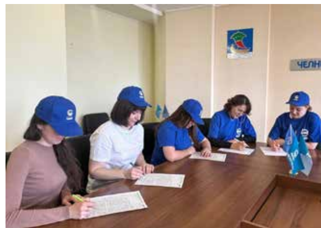
Настоящим знатокам русского языка такой диктант по силам

делений: автомобильного и кузнечного заводов, завода двигателей, БЗГД — ДР, блока по закупкам, депар-