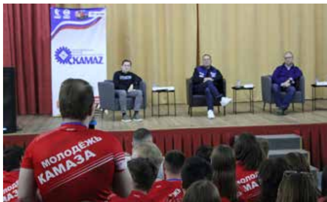
Хоть это и было ток-шоу, но вопросы у молодёжи оказались серьёзными