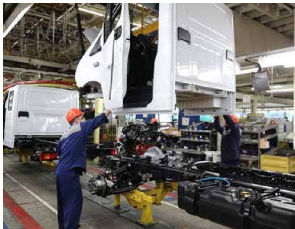
На конвейере ГАЗа активно используются инструменты бережливого производства

ности, то она измеряется балльной оценкой соответствия каждого участка требованиям производственной системы, выставленной аудиторами, и выполнением KPI, где единицей измерения является достижение целевого показателя по чистой прибыли. Таким образом, все в коллективе