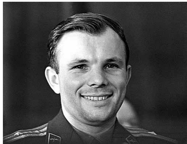
Юрий Гагарин — землянин, проторивший человечеству дорогу в космос