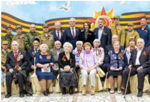
Достоинно встречать День Победы — добрая камазовская традиция

В завершение депутат Госдумы вручила благодарственные письма коллективам трёх клубов при Совете ветеранов за активную жизненную позицию, бескорыстную поддержку и помощь участникам СВО и членам их семей.