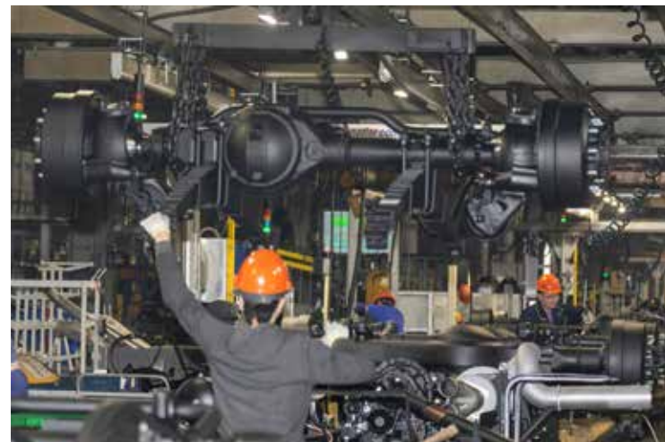
Крепёж всех узлов подвески — дело ответственное

шумно, плавно, для её подвода к идущему по конвейеру шасси не требуется усилий. За три не-