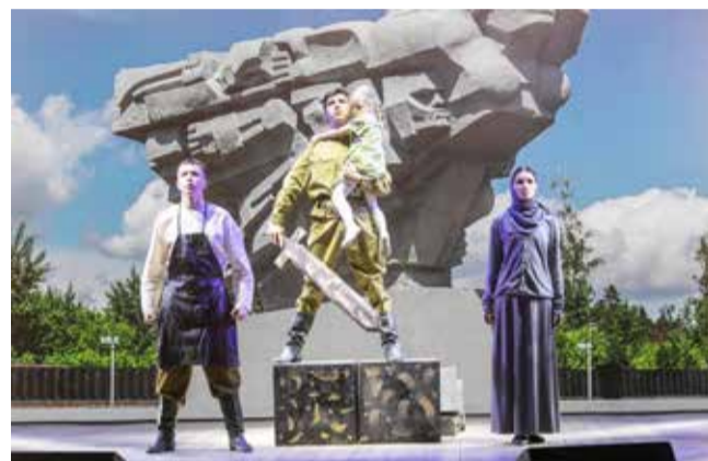
Победа ковалась не только на фронтах, но и руками тружеников тыла