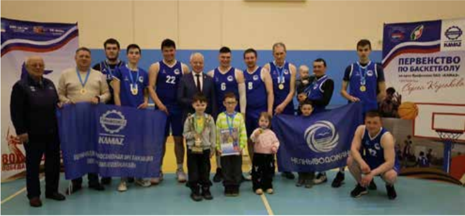
«ЧВК» подтвердил звание сильнейшей команды по баскетболу на «КАМАЗе»

На «КАМАЗе» завершилось первенство по баскетболу в рамках Спартакиады 2025 года в Техколледже им. Поташова. Соревнование организовал профком компании. В турнире, стартовавшем 7 апреля, приняли участие 12 команд, которые организаторы разделили по группам. По итогам в следующий этап вышли БЗГД — ДР, блок закупок, ЛЗ, ПРЗ, «Челныводоканал», ЗЗЧиК, «РД» и ЗД. В полуфинале оказались БЗГД — ДР, ПРЗ, «ЧВК» и ЗД. В матче за третье место сразились дизелисты и баскетболисты НТЦ. Последние оказались сильнее — счёт в игре 40:38. Победителем турнира стал «Челныводоканал», обыгравший ПРЗ со счётом 39:23, причём команды повторили финал прошлого года розыгрыша. Третье место тогда заняли литейщики.