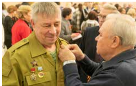
Воин-интернационалист заслужил георгиевскую ленточку

Под занавес вечера казанские солисты исполнили «День Победы», а камазовцы, поднявшись со своих кресел, дружно пропели знакомые с детства строки. Встреча 80-летия Победы началась достойно.