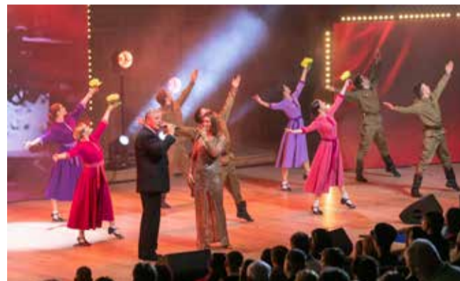
«День Победы» зал слушал стоя

установленных на сцене, сотрудники блока безопасности исполнили песню «Нам нужна одна Победа».