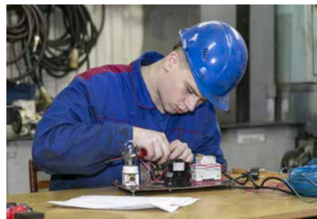
Собрать электрическую цепь требовалось за 20 минут