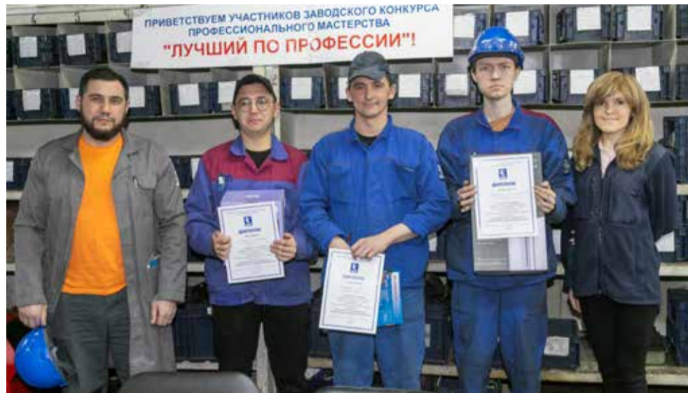
Вот они, лучшие электромонтёры ПРЗ

— В работе электромонтёра самое главное — внимательность и, конечно, аккуратность: нужно и цепь правильно собрать, и провода промаркировать, и обтяжку контактов как следует сделать, — пояснил он.