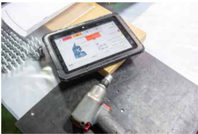
Цифровизация облегчает ручной труд

Победителям в каждой номинации будут вручены почётные грамоты компании. Между тем к этому празднику сделать подарок себе и своим близким может каждый — будьте осторожны, осмотрительны, применяйте только безопасные методы работы. Пусть этот апрельский день накануне каникул станет тёплым, радостным, счастливым. Берегите себя!