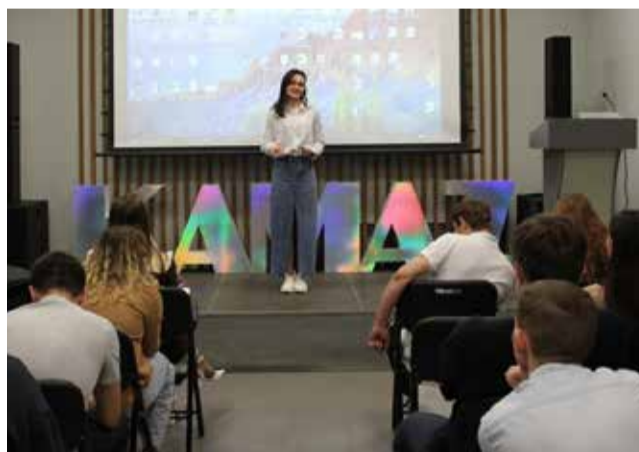
Каждый участник кастинга рассказывал о своих сильных сторонах

22 апреля Совет молодёжи «КАМАЗа» провёл кастинг в команду на XIII Международный молодёжный промышленный форум «Инженеры будущего-2025».