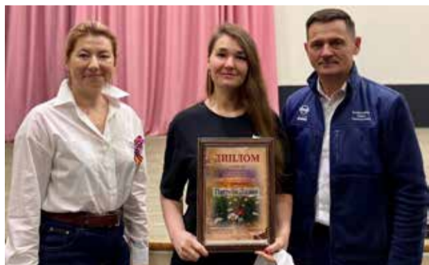
За талантливых детей награды получили родители — после работы обещают передать их адресатам прямо в руки!

Конкурсные видеоролики будут публиковаться в соцсети «ВКонтакте» на странице завода двигателей до 9 мая.