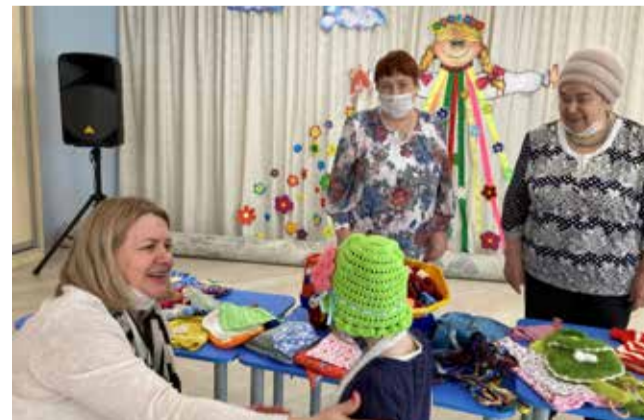
Такие нужные вещи выходят у рукодельниц

филиала республиканского Дома ребёнка. «Мы вяжем и шьём для себя, для родных и близких, дарим друг другу. Но нам захотелось, чтобы наш труд приносил пользу и другим», — рассказала