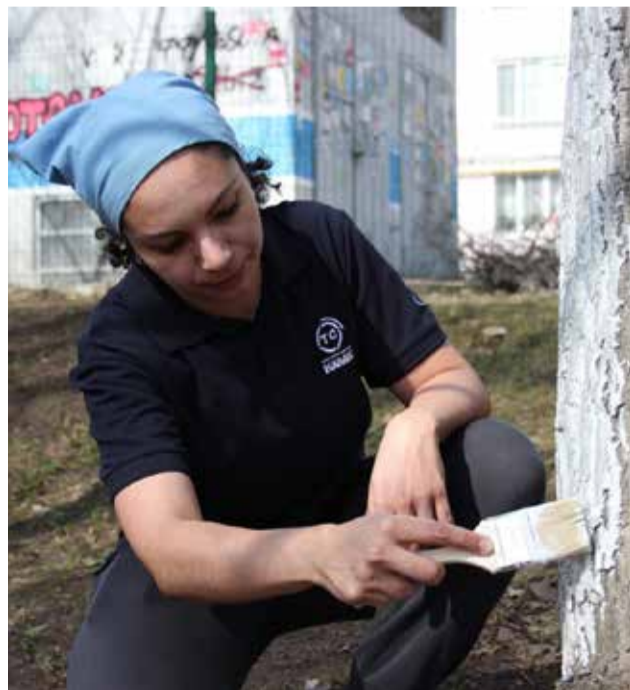
Побелка деревьев входила в список дел на субботнике

Апрель — подходящий месяц для проведения субботника и для добрых дел. 19 апреля такое мероприятие молодёжь города затеяла на территории Набережночелнинского дома-интерната для престарелых и инвалидов, присоединились к этому событию и камазовские активисты.