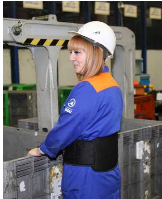
Экзоскелет — один из новейших способов сохранения здоровья работника