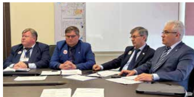
Аудиторы проверили результативность работы системы менеджмента качества

устранение несоответствий, становятся строже. Сейчас подразделениям предстоит оперативная работа над выявленными недостатками. От того, насколько быстро и действенно они отреагируют на эти несоответствия, будет зависеть эффективность текущих процессов и компании в целом.