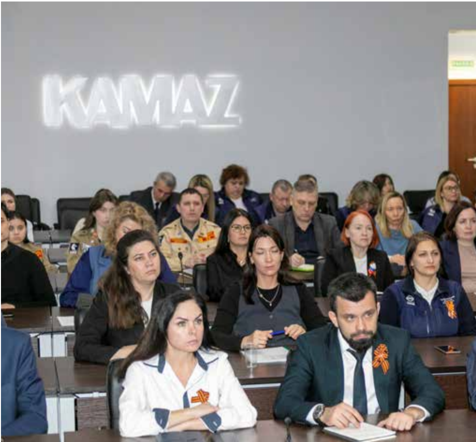
К выступлению гендиректора Ростеха камазовцы отнеслись с максимальным вниманием

Подготовила Эльвира Галлямова.