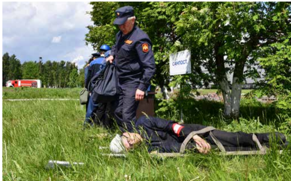
Спасатели выносят пострадавших и совместно с санитарным постом оказывают им доврачебную помощь

Учения показали чёткие и организованные действия всех участников. Слаженно и на хорошем уровне проведена эвакуация, а руководство завода продемонстрировало необходимую компетентность в оперативном реагировании на возможные террористические акты. В целом штабная тренировка и тактико-специальные учения получили положительную оценку.