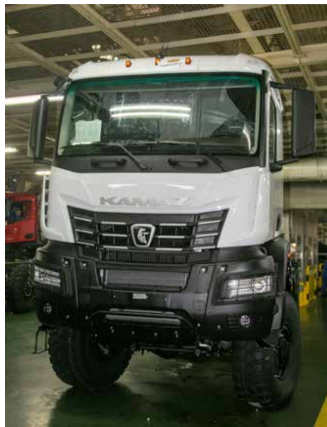
КАМАЗ-65958 и мощный, и манёвренный

Его собрат КАМАЗ-65959 с колёсной формулой 6х6 немного легче — полная масса автомобиля 35 тонн, двигатель у него тоже Р6 мощностью 460 лошадиных сил. Он будет укомплектован самосвальной установкой объёмом 16 кубометров с обогревом выхлопными газами глушителя.