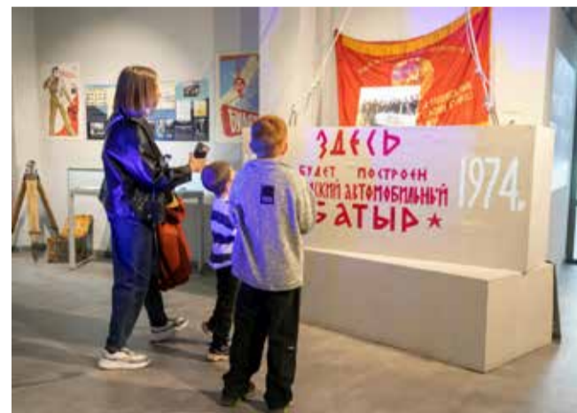
Юных посетителей интересовало, настоящий ли это блок