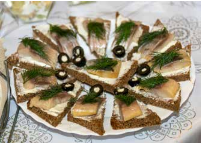
Закуски на хлебе дают огромный простор для творчества

Чтобы подать заявку на участие, надо отсканировать QR-код, указанный в объявлении. При заполнении анкеты необходимо указать причину, по которой