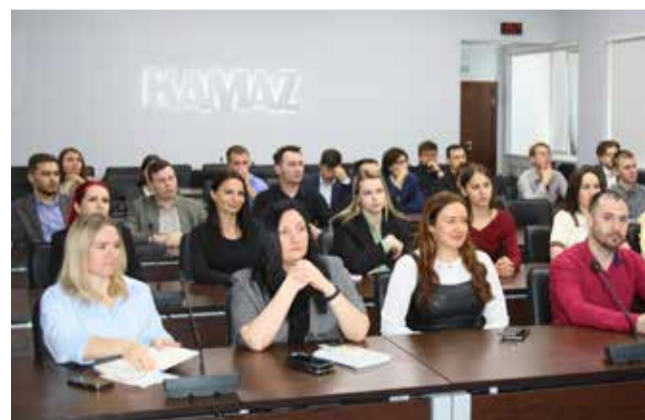
Молодые камазовцы искренне заинтересованы в повышении эффективности работы...

Участников встреч интересовали нюансы в определении цели проекта, порядок расчёта экономического эффекта — он должен быть измеримым и реально достижимым, идеи для офиса. В частности, сотрудники блока развития активно внедряют проекты по разработке приложений, оптимизирующих процесс формирования технологических маршрутов, при этом чаще всего идеи проектов рождаются в процессе решения реальных проблем. Помочь сориентироваться и грамотно составить презентацию помогут также