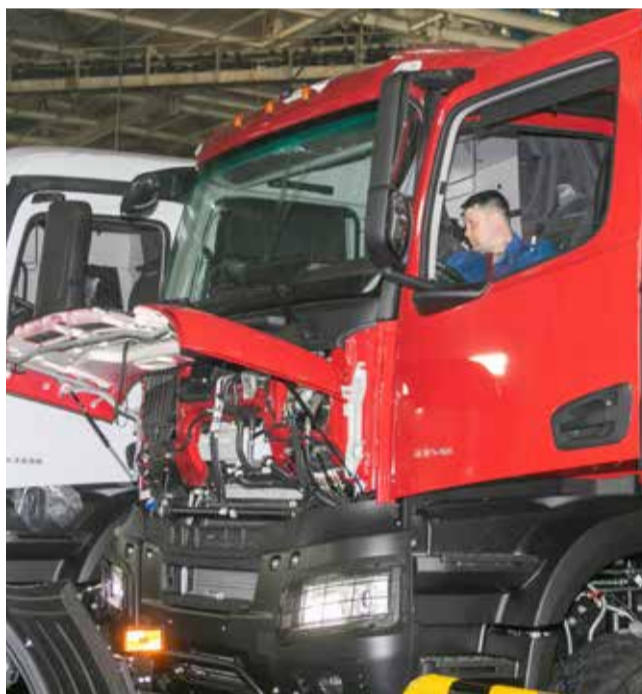
Теперь в линейке самосвалов поколения K5 есть ещё и КАМАЗ-65959

За три последних месяца на автомобильном заводе освоена сборка четырёх новых моделей. До конца года с его конвейера сойдёт ещё несколько новых большегрузов поколения K5.