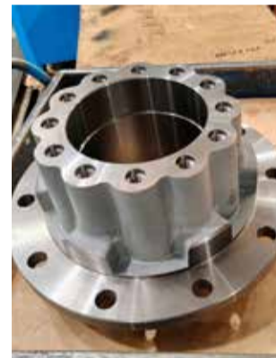
Ступица задних колёс — деталь сложная, но с новым оборудованием обрабатывать её будет легче

Проект «Мосты» — комплексный проект, в котором принимают участие все заводы «КАМАЗа». После его завершения автогигант будет применять гипоидные мосты собственной конструкции, что позволит и дальше создавать новые автомобили с увеличенной грузоподъёмностью.