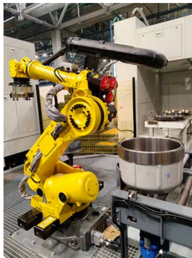
Обработкой деталей для гипоидных мостов под присмотром наладчиков будут заниматься роботы