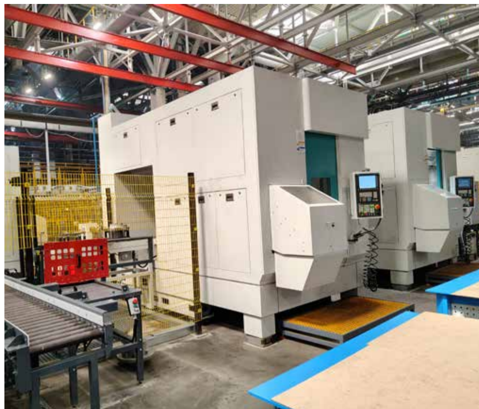
Шесть вертикальных токарных центров позволят осуществлять полную механическую обработку ступиц задних колёс и тормозных барабанов

С этим новым оборудованием и труд заводчан станет легче, и мосты для автомобилей повышенной грузоподъёмности будут освоены в собственном производстве, без закупки их у других производителей.