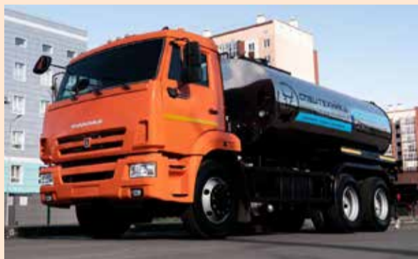
Автогудронатор — первый помощник при строительстве дорог

Знающим людям, работающим в этой отрасли, не нужно объяснять, какую роль в строительстве или ремонте дорожного полотна играет автогудронатор. Без битума и других вяжущих материалов, которые равномерно разливаются перед укладкой асфальта, не обходится ни одно строительство автодороги. Именно этим и занимаются автогудронаторы, созданные на шасси КАМАЗ-65115. Сейчас на площадке осталось всего две такие машины со скидкой 50%. Весна на дворе, время строить дорогу.