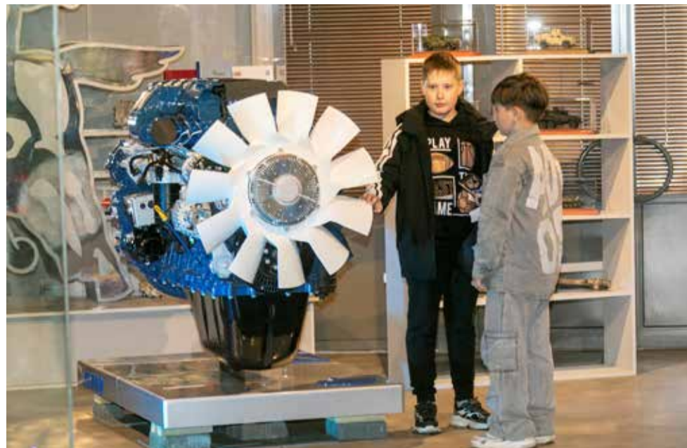
Гости внимательно изучали новинку музея — двигатель Р6

В целом в зале, посвящённом строительству