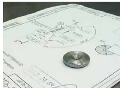
С калибр-кольцом диаметр свёрл замерять можно быстрее

Лучшим эталонным офисным участком признана комната мастеров и замначальника ИЦ-1, производственным — участок бригады 411 ИЦ-3, а складом — ЦИС ИО-5. В номинации «Лучшая команда проекта PSK» победила команда заместителя ди-