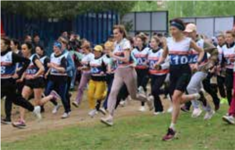
Ежегодно в кроссе принимают участие несколько сотен камазовцев

В 9.00 организаторы состязания начнут выдавать номера заявившимся участникам. Бегуны будут соревноваться в четырёх возрастных категориях: 18–29 лет, 30–39 лет, 40–49 лет, 50 лет и старше. На 10.00 намечено торжественное открытие первенства, а спустя 15 минут на старт выйдут первые спортсмены. В полдень состоится награждение призёров.