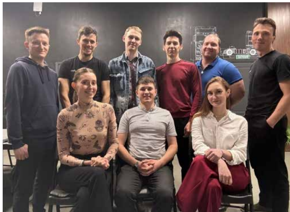
У камазовской команды есть почти месяц на тренировки и репетиции

рии пансионата «Шахтёр» в селе Буньрево Тульской области. Ежегодно событие собирает тысячи студентов вузов и молодых специалистов с предприятий России. В программу форума входят «круглые столы» и дискуссии с участием глав корпораций, директоров предприятий машиностроения, ректоров, политиков. Участники знакомятся с новейшими разработками и технологиями компаний, а также проектами молодых инженеров, конструкторов и учёных. Обсуждается внедрение инноваций и модернизация производств, проблемы техобразования.