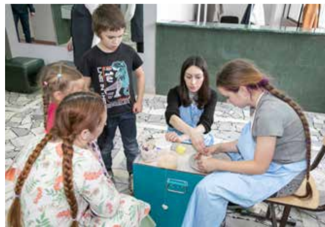
Изготовление плошек на гончарном круге — процесс увлекательный