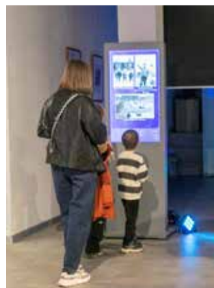
На интерактивном стенде можно было увидеть исторические фото

Отведённое до 22 часов время пролетело незаметно. Пополнившие свой багаж знаний о «КАМАЗе» и городе посетители благодарили сотрудников музея за проведённые экскурсии и выставки, а те в ответ приглашали прийти в гости ещё раз.