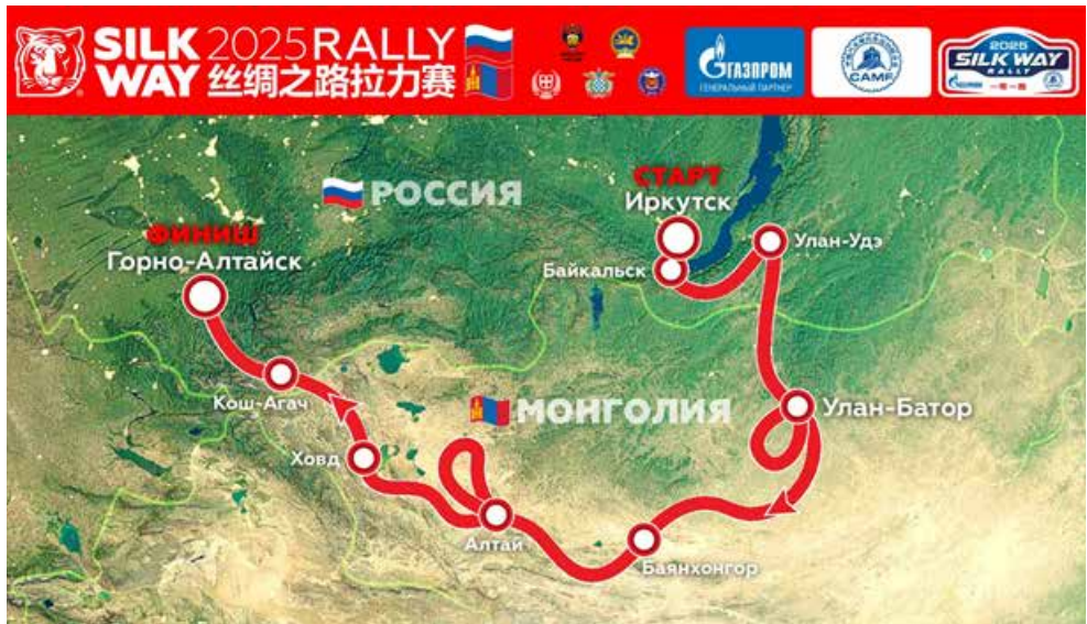
Ралли-марафон протяжённостью 4792 км станет хорошей проверкой для техники