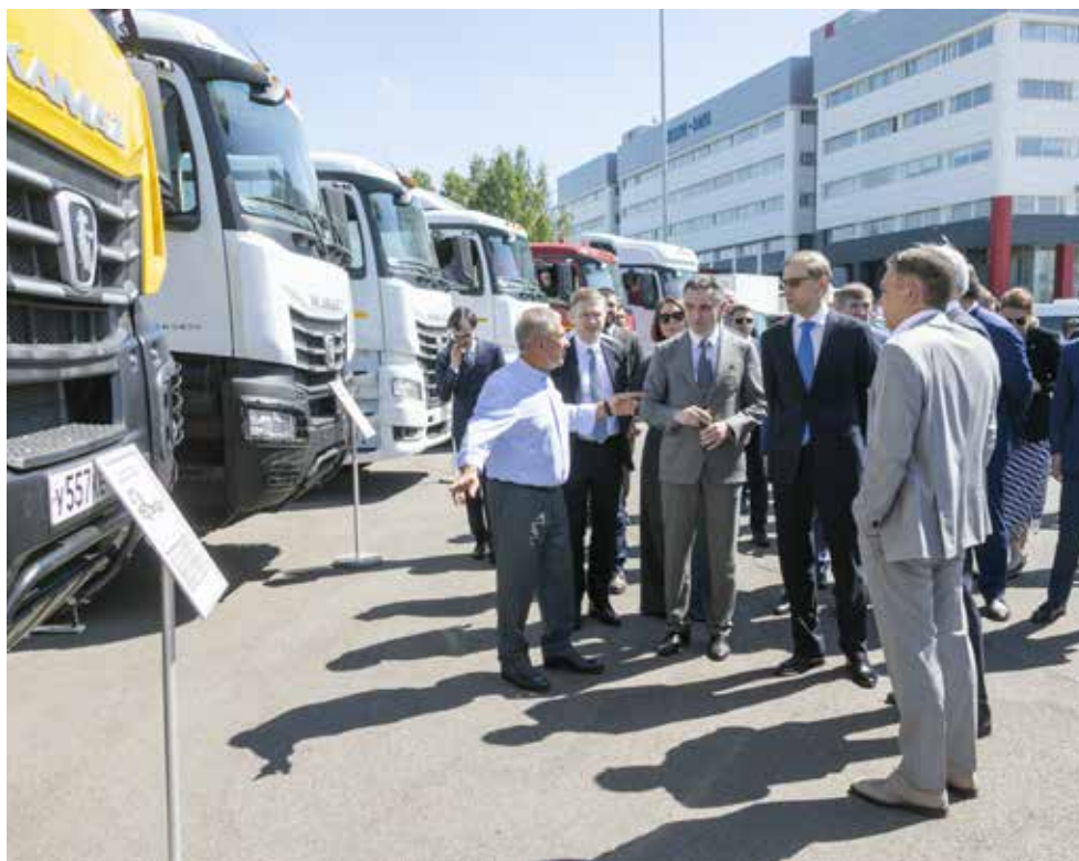
«КАМАЗ» представил Денису Мантурову широкий ряд новейших высокотехнологичных автомобилей

30 мая с визитом на «КАМАЗе» побывал первый заместитель председателя Правительства РФ Денис Мантуров. В сопровождении раиса РТ Рустама Минниханова и гендиректора автогиганта Сергея Когогина он посетил Научно-технический центр.