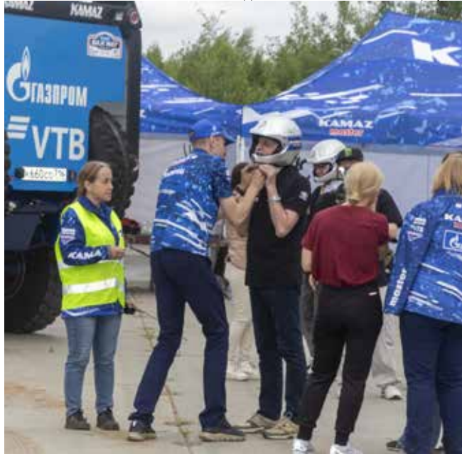
Для выезда на трек нужно экипироваться как следует

— Наша главная задача — проехать всеми пятью экипажами весь маршрут надёжно, быстро и показать достойный результат, как умеет команда «КАМАЗ-мастер», — подытоживает Эдуард Николаев.