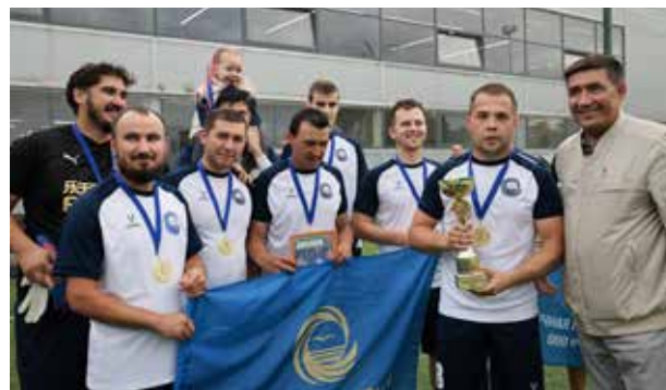
«ЧВК» второй год подряд завоёвывает Кубок по мини-футболу