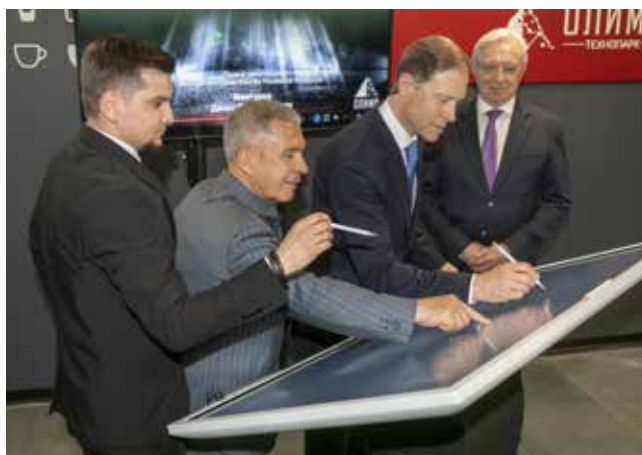
Денис Мантуров и Рустам Минниханов оставили автографы в электронной книге почётных гостей технопарка «Олимп»

К слову, больницу и взлётную полосу на уровне города уже озвучивали в перечне юбилейных строек, однако формально в рабочих документах оргкомитета они не отражались. Помимо них, в список входят продолжение Московского проспекта, трамвайная линия в микрорайоне Замелекесье и школа в том же районе, физкультурно-оздоровительный комплекс «КАМАЗ», ещё одна школа на 1500 мест в 73-м микрорайоне, два детских сада, ледовая арена, центр волейбола, а также продолжение работ по очистке русла Мелекески и несколько проектов капремонта дорог и соцобъектов.