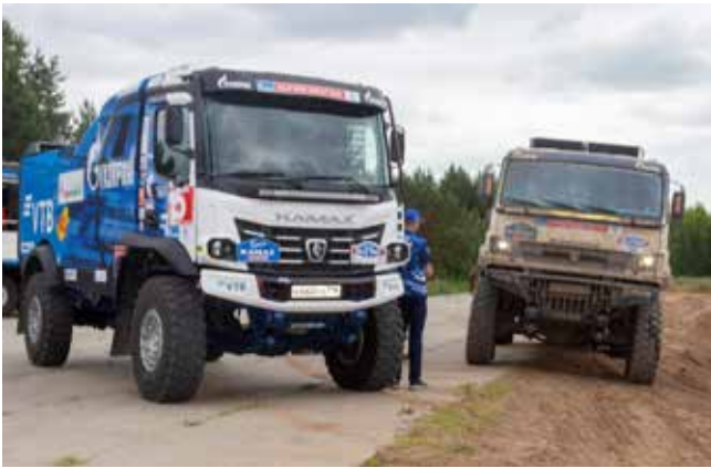
Таким грузовик (справа) прибывает на очередной бивуак ралли-марафона

Команду «КАМАЗ-мастер» на ралли-рейде «Шёлковый путь» в грузовом зачёте представят пять экипажей: