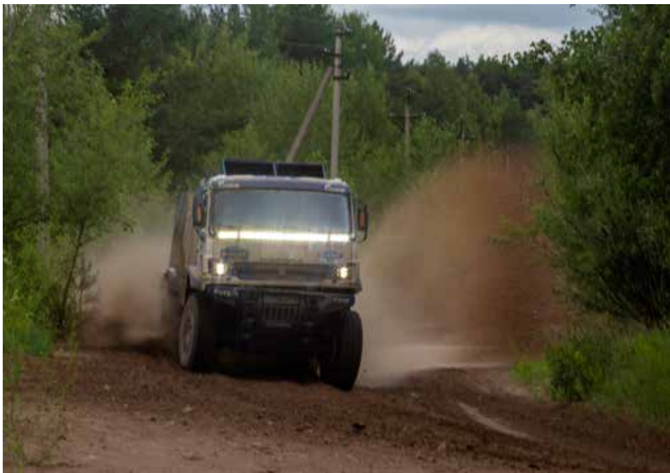
Ни грязь, ни песок не остановят гоночный КАМАЗ

— В российской части гонки будет примерно то, что мы испытали сегодня во время пресс-тура здесь, в Тарловке, — лесные дороги, много грязи, лес, скользко. В Монголии нас ждут степи, песок. Каждый раз органи-