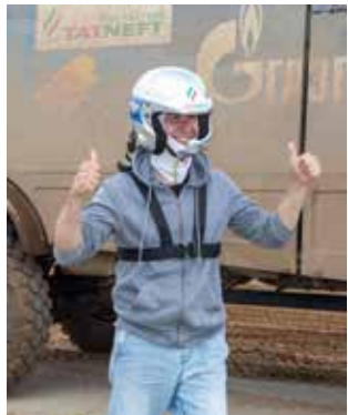
Как описать заезд с профессиональным гонщиком по лесной трассе? Только пальцем вверх