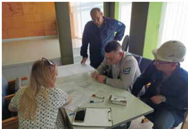
Решение проблем литейщика ищут сообща

Для выполнения поставленных задач были выбраны семь наиболее актуальных для производства проблем. Найти для них решения и упаковать их в готовый кайден-проект должны были рабочие группы, на которые поделили участников сессии. Вопросы, вынесенные на обсуждение, охватывали практически все направления работы ПСЛ: от снижения простоев ПРЗ по рамным кронштейнам по вине литейного завода до исключения