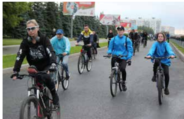
Участники велопробега готовы преодолеть не один десяток километров