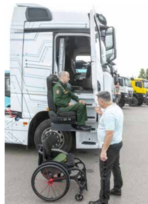
Кресло оснащено гидравлическим подъёмным механизмом, что позволяет делать посадку непосредственно с земли