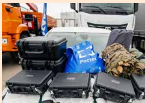
Груз сформирован по просьбам бойцов

Вес переданного груза на сумму 40 млн рублей составил более 90 тонн. Всего же за три года «КАМАЗ» направил 22 конvoja гуманитарной помощи на общую сумму более миллиарда рублей.