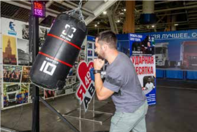
У каждого участника в поединке с грушей своя тактика

Всего в этом году на «КАМАЗе» в отборочном туре «Ударной десятки» поучаствовало свыше 500 человек.