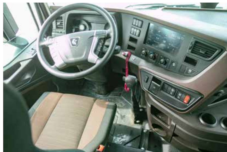
Вместо педалей газа и тормоза один универсальный рычаг