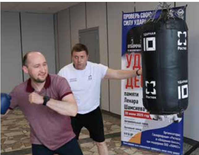
Инженеры НТЦ тоже выясняли, кто из них сильнее