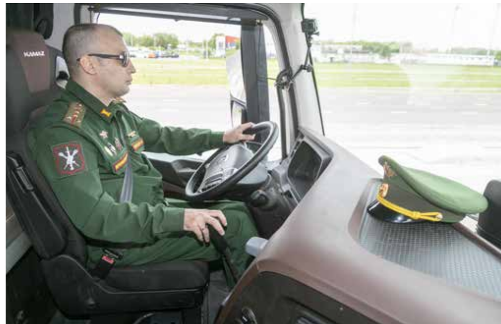
Новый грузовик позволит вернуться в профессию людям, пострадавшим в зоне СВО