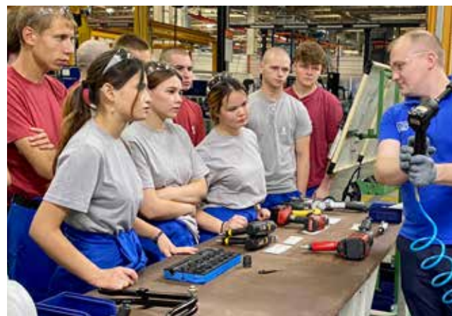
Первым делом студентов ввели в курс профессиональных обязанностей

Всего до конца лета на заводе двигателей будут работать почти 80 студентов. В этом году молодые люди приехали из Воронежской, Свердловской, Оренбургской и Омской областей, а также из Севастополя. После прохождения вводного инструктажа и обучения по охране труда будущих слесарей МСР, электромонтёров, слесарей-ремонтников, операторов АПЛСУ и операторов станков с ПУ распределили по производствам, где за каждым закрепили наставника. Параллельно ребята обучаются основам бездефектного производства.