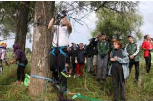
Камазовских туристов ждут суровые испытания

По итогам фестиваля традиционно будут вручены кубки туризма, спорта, культуры и малый кубок. Команда, набравшая наибольшее количество баллов, получит кубок чемпиона.