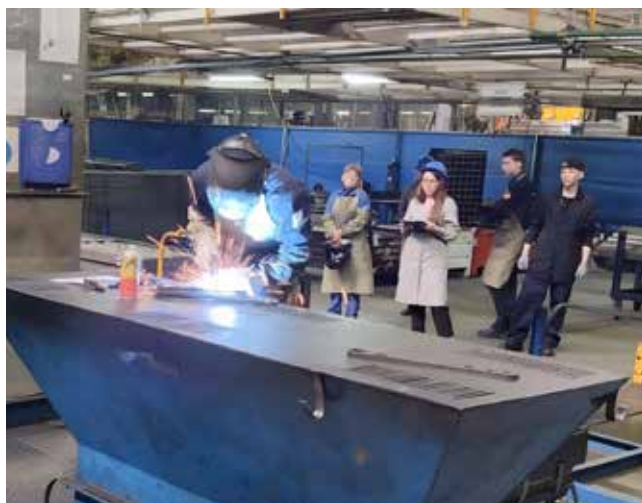
Сварка — дело ответственное

После жеребьёвки участники отправились на один из участков цеха шасси. За 15 минут им нужно было сварить нижнюю стойку ограничителя подъёма кабины одной из моделей большегрузов. Технологи остановили свой выбор на этой детали по той причине,