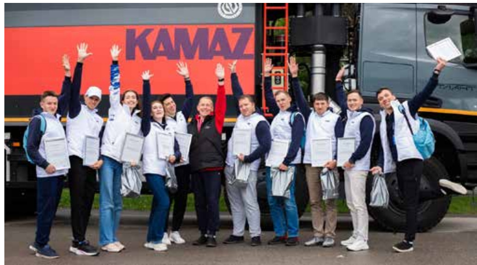
И в Туле можно сделать фото на фоне камазовского «Атланта»

Седьмой день форума можно было охарактеризовать словами — отнедр земли до звёзд. Камазовская команда побывала в модернизированной недавно шахте, где на глубине 130 метров добывают полезные ископаемые, не без помощи инженерной мысли, конечно. Завершился день встречей с Героем России, лётчиком-космонавтом Сергеем Залётиным, который поделился историями из жизни космонавтов.