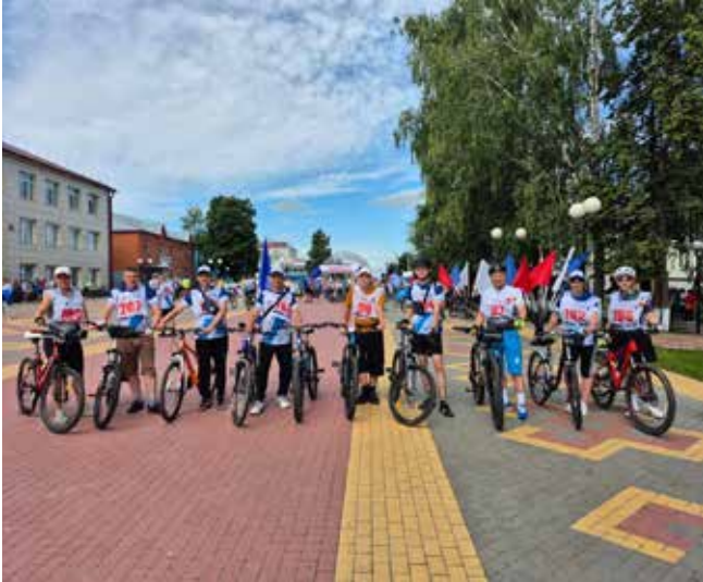
Камазовские велосипедисты преодолели 126 км

На финише все участники велопробега получили медали.