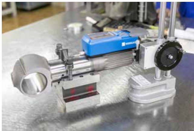
Профилометр обнаружит даже небольшую погрешность в обработке