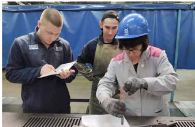
Технолог с контрольным мастером тщательно проверяли качество каждого шва

вание — один из критериев профмастерства.