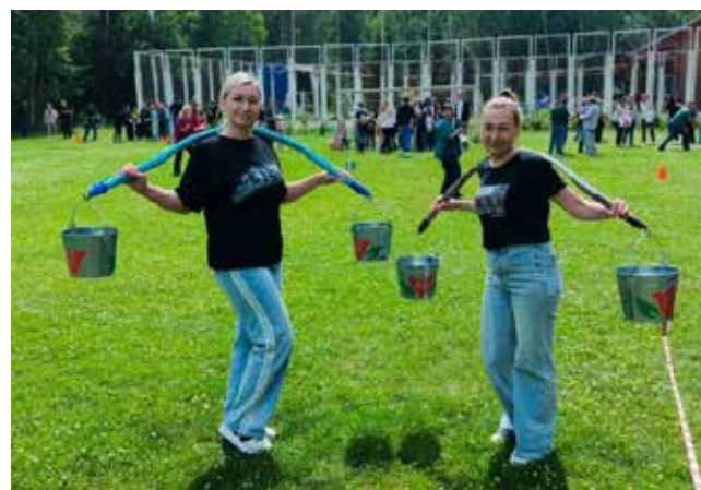
Принести ведро с водой на коромысле? Легко!