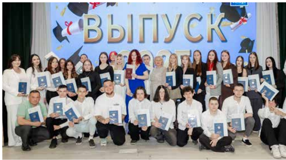
Дипломированные логисты завтра выйдут на рынок труда

Сотрудничество с ТИСБИ будет продолжаться — заместитель директора Университета управления предложил руководителям ЛЦ провести встречу со студентами. Им есть чему поучиться, ведь в организации работы камазовцы применяют самые передовые технологии.