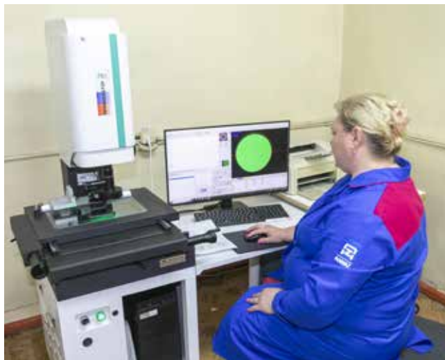
Новый измерительный микроскоп открывает широкие возможности

В центральной заводской лаборатории ждут новую партию приборов. Масштабная модернизация АвЗ обеспечит выпуск продукции нового уровня качества, а условием его стабильности может быть только постоянный инструментальный контроль.