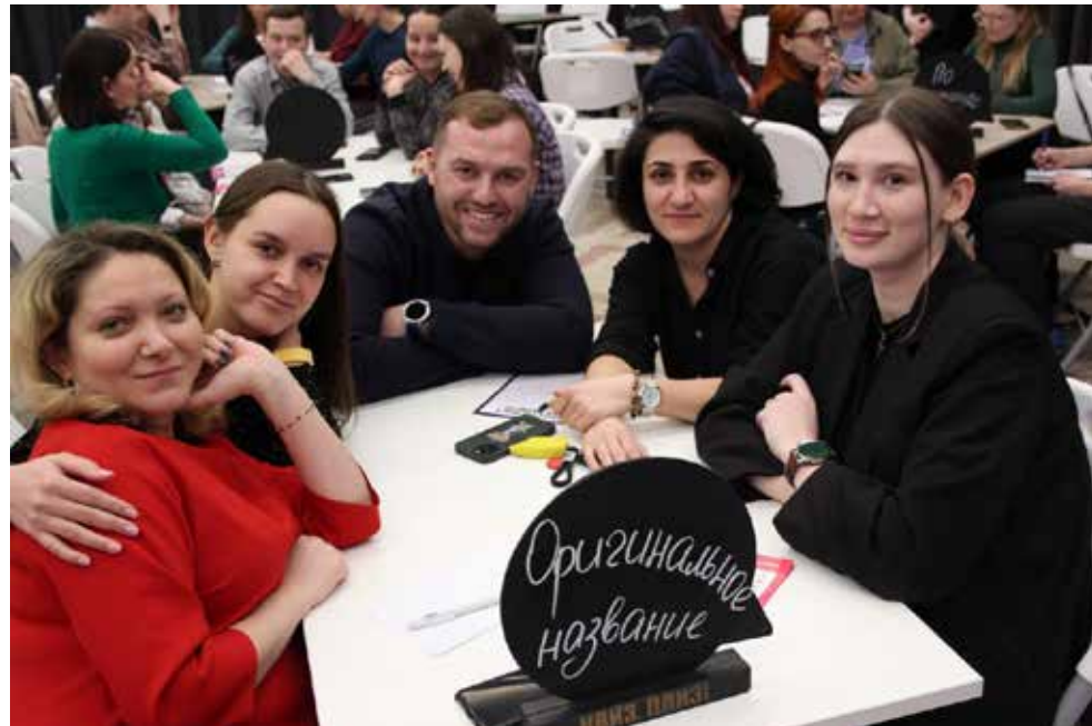
Команда «Оригинальное название» заряжена на победу

— Квиз предполагает знания обо всём, и как-то