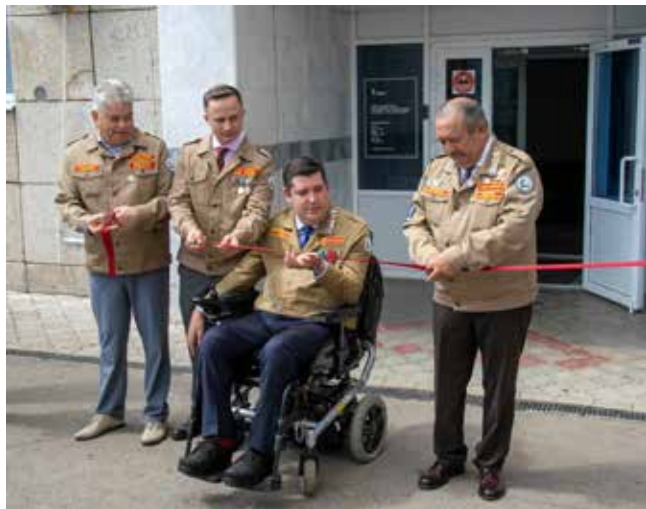
Мультиформатное пространство считать открытым

До конца августа студотрядовцы будут работать на четырёх заводах — автомобильном, прессово-рамном, литейном и заводе двигателей — в качестве слесарей, токарей, сварщиков, операторов и электромонтёров. Всего в этом году в отряд вошли 315 студентов из 15 регионов России. Автогигант предоставляет им бесплатное жильё, горячее питание, медицинское сопровождение и компенсацию проезда. Но и не работой единой: студенты смогут принять участие в добровольческих акциях и съёмках юмористического сериала о проекте, для них организуют лекции, мастер-классы и рейтинговые мероприятия, по результатам которых будет выбран лучший отряд проекта «КАМАЗ».