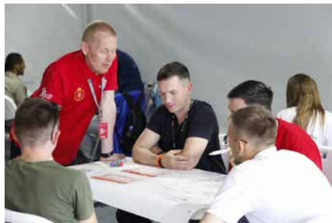
Камазовцам любая инженерная задача по плечу