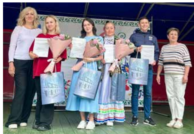
Заслуженные награды вручили организаторам мероприятий и участникам творческих конкурсов

Домой возвращались с победами, трофеями, сотней забавных фотографий и видео. Листай и радуйся — праздник-то удался!