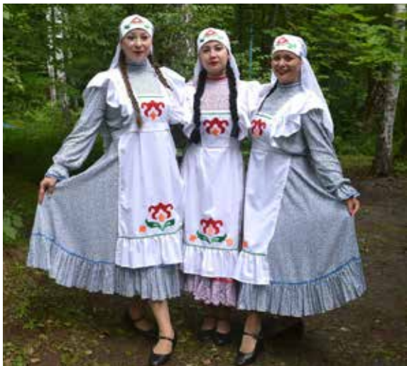
...а ещё красота, обаяние и праздничное настроение