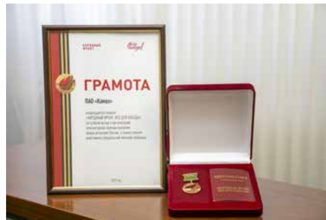
Этот знак — признание вклада «КАМАЗа» в поддержку участников СВО

Особое внимание компания уделяет своим мобилизованным сотрудникам и их семьям. С сентября 2022 года «КАМАЗ» ежемесячно выплачивает каждому участнику СВО материальную помощь в размере 50 тыс. рублей. Детей мобилизованных обеспечивают путёвками в летние лагеря, а их семьям ежемесячно предоставляют подарочные карты в гипермаркеты номиналом 5000 рублей. Материальная помощь