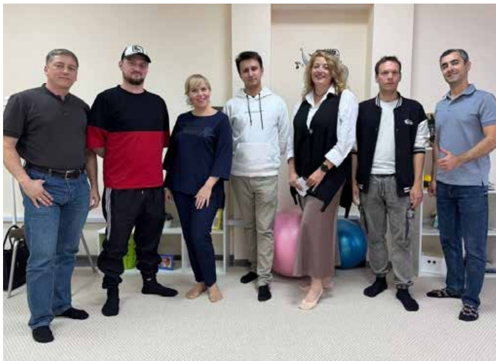
Участники кастинга старались показать всю красоту своего голоса

«Наше время — Безнезаман» нуждалась в под-