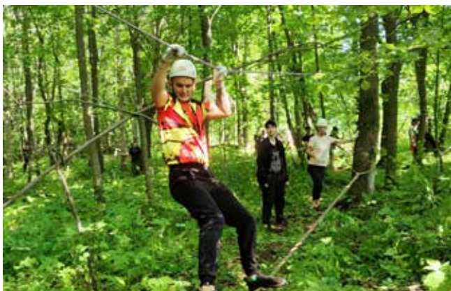
Испытания для участников были знакомы, а вот трасса оказалась совершенно новой