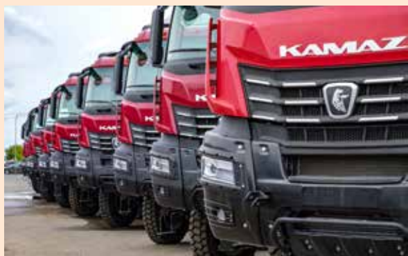
Эти большегрузы отправятся на строительство высокоскоростной магистрали

На первом этапе холдинг получит в своё распоряжение 20 самосвалов, их предпродажной подготовкой занимаются дилерские центры «КАМАЗа». Вся техника лизингополучателю будет передана «КАМАЗ-ЛИЗИНГом» по специальной программе «Лизинг от производителя» при участии Минпромторга РФ, субсидия от него составит 10%, но не более 500 тыс. рублей на каждый самосвал. Акция предоставляется до 30 ноября 2025 года.