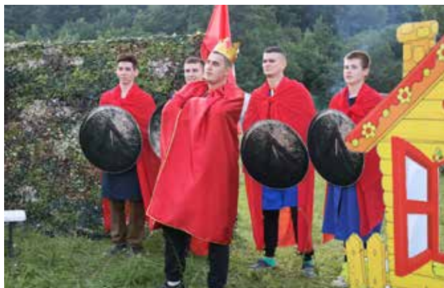
Команды креативно взглянули на тему «На защите человека труда»