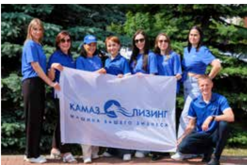
Команда «КАМАЗ-ЛИЗИНГА» произвела на челлендже настоящий фурор

Что касается общих достижений онлайн-челленджа, то они произвели впечатление даже на самих организаторов. За весь период участники собрали 189639 «зарядов» за шаги, 149275 — за другие тренировки и 118248 «зарядов» — за выполнение дополнительных челленджей.