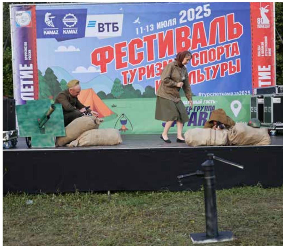
Сцена в фильме «Сталинград», где снайпер стреляет в немца у водоколонки, — одна из самых запоминающихся