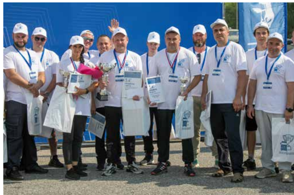
На Кубке «КАМАЗа» проигравших нет