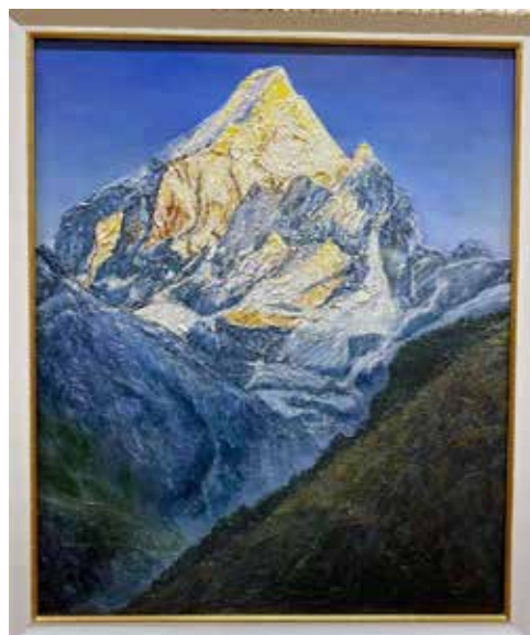
Горы Чогори — вторая по высоте вершина Земли — вдохновили художницу