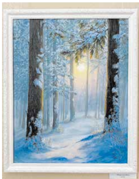
Работа «Мороз и солнце»