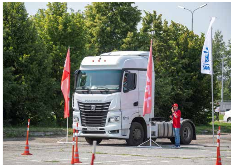
На старт, внимание... Газу давай!

на этом конкурсе церемония награждения получилась цветочной — букет был вручён Елене Запольской, доказавшей, что уверенно управлять большегрузом могут и дамы. Это ли не вызов для камазовцев?