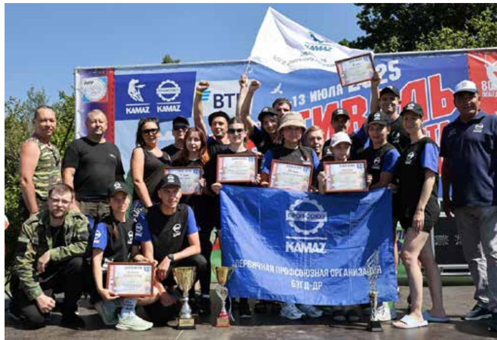
БЗГД — ДР стал трёхкратным победителем фестиваля