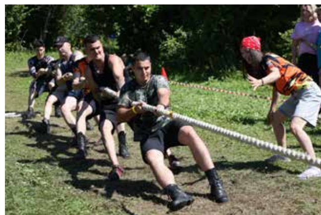
Ни один фестиваль не проходит без перетягивания каната