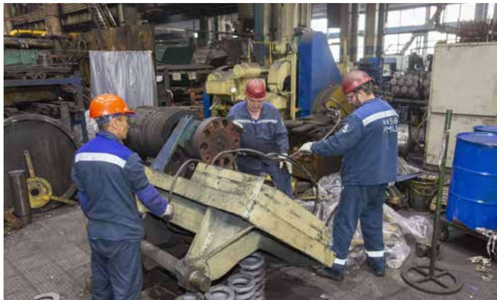
Специалистам работа всегда найдётся

Пока отечественный рынок насыщен грузовиками и не требует от «КАМАЗа» традиционного объёма производства, компания решила по мере возможности компенсировать своим сотрудникам переход на четырёхдневный рабочий режим. Заработок пятницы помогут возместить инструменты дополнительной занятости.