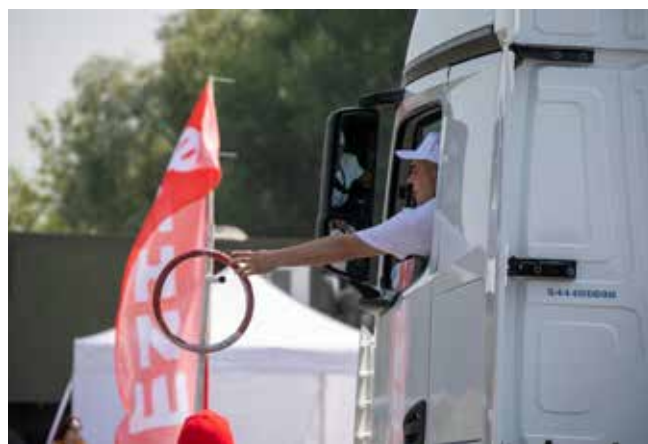
Передать эстафету, не останавливая автомобиль, непросто