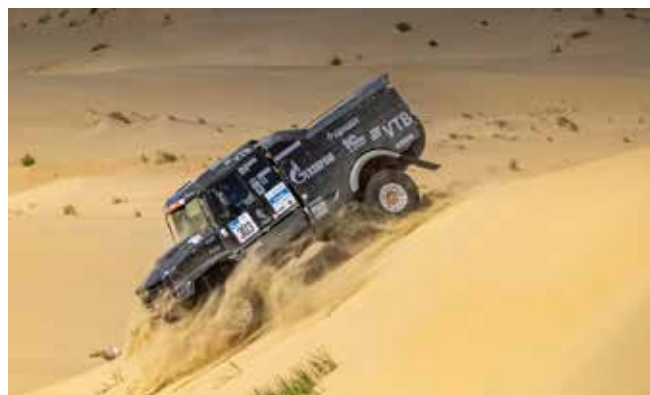
Песчаный массив стал для КАМАЗа одним из труднейших испытаний

Подготовил Кирилл Свиридов.