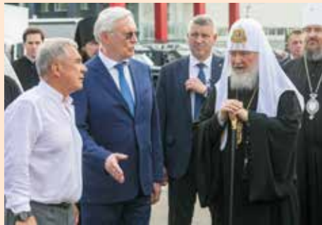
Патриарх уделил особое внимание «КАМАЗу» и его продукции

В завершение визита патриарх Кирилл передал в дар «КАМАЗу» Казанскую икону Божией Матери.