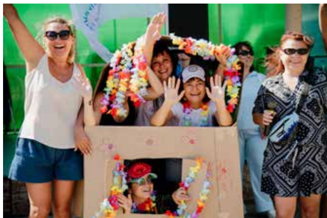
Праздник получился ярким, весёлым, интересным