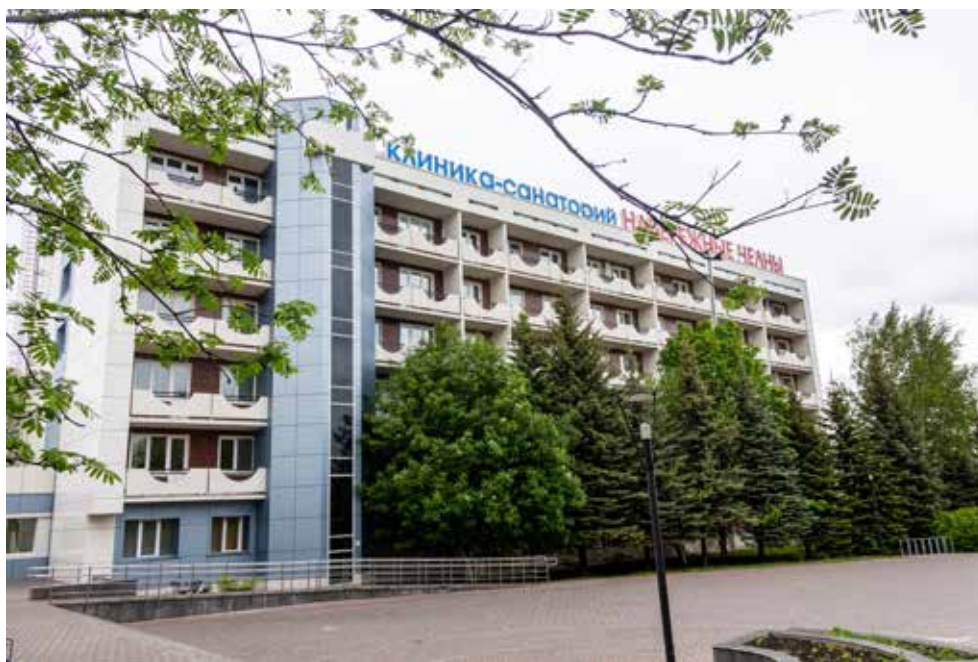
Клиника-санаторий «Набережные Челны» хорошо знакома камазовцам