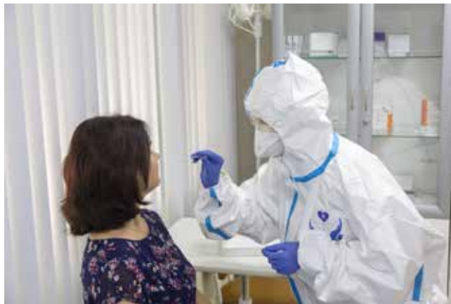
Период коронавирусной инфекции всем дался тяжело, но и с ней справились