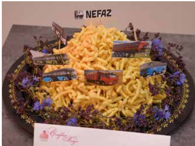
Без классического чак-чака никуда