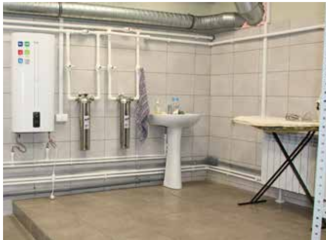
Место под гладку тоже предусмотрено