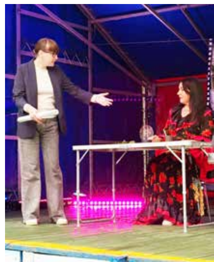
Когда нужен идеальный кандидат, обращаются даже к потомственной гадалке