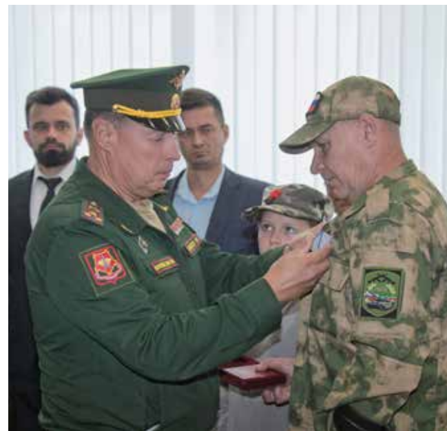
Медаль «За отвагу» нашла своего героя только через год