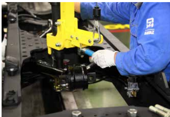
С новым гайковёртом крепление стало ещё надёжнее

Казалось бы, нужно закрутить всего восемь болтов, но чтобы обеспечить на этом ответственном соединении затяжку номиналом 800 Н·м, рабочим приходилось использовать предельный ключ. Сейчас операция занимает буквально пару минут — слесарь сканирует штрихкод на контрольной карте сборки автомобиля, сборочная система надёжно и плавно закручивает гайки с нужным усилием, и тут же выдаёт чек, где указан VIN-код автомобиля, номер позиции, время операции, номинальный и фактический момент затяжки. После введения в оборот электронного паспорта автомобиля, информация будет вносить-