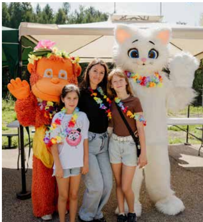
Мамина работа не даст забыть это лето