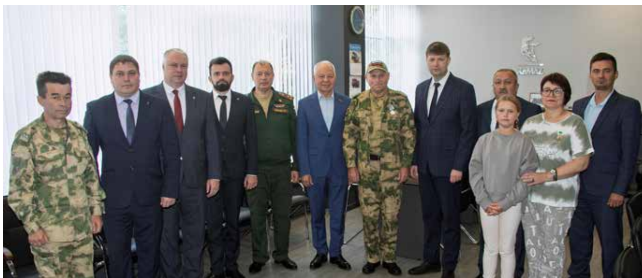
Эта церемония награждения стала памятной для всех её участников

В 2022 году, когда камазовцев провожали в зону СВО, руководство и профком взяли шефство над семьями всех мобилизованных сотрудников. Поддержка оказывалась на протяжении всего времени, и теперь, когда герои возвращаются, каждый их запрос тоже будет на особом контроле. На «КАМАЗе» умеют держать данное слово.