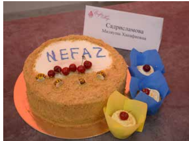
«Медовик» с названием компании вкуснее вдвойне