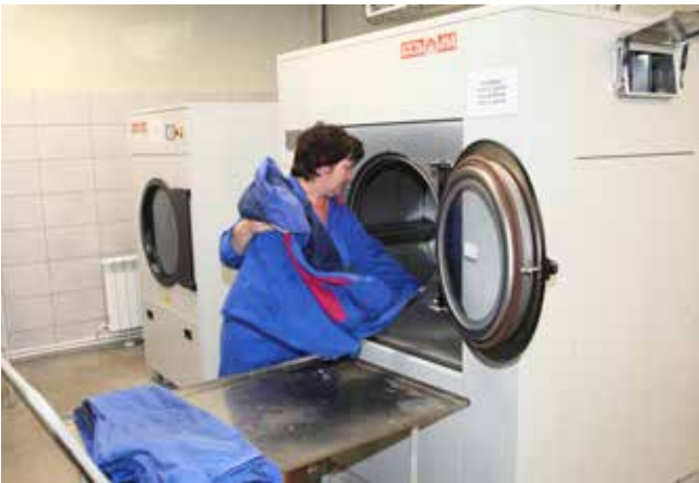
Спецдежда в новых машинах отстирывается значительно лучше

делили ещё на этапе планирования. Не хватает и маленькой стиральной машины для более скромных объёмов стирки, чтобы весь процесс стал по-настоящему современным. Это важно, ведь в чистой и свежей спецдежде и работать легче и приятнее.