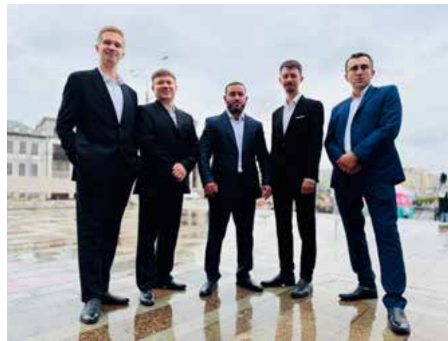
Казань вновь услышала красивейшие голоса камазовцев

Праздничная программа прошла и в Набережных Челнах, традиционно в чаше Майдана парка «Прибрежный». Вокалисты с кузнечного, литейного и пресово-рамного заводов вышли на сцену после поздравления мэра города и награждения. Камазовцы исполнили песню «Бэхәтле бул» («Будьте счастливы»), а в этот момент на Майдане танцевали почти 900 человек.