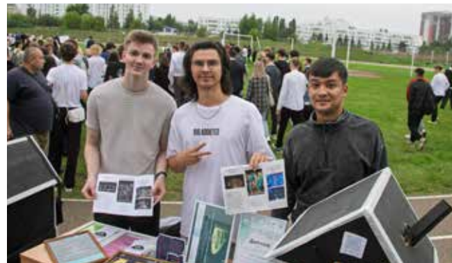
Учёба в вузе наполнена разными активностями — спортом, танцами, музыкой. Выбирай по душе!