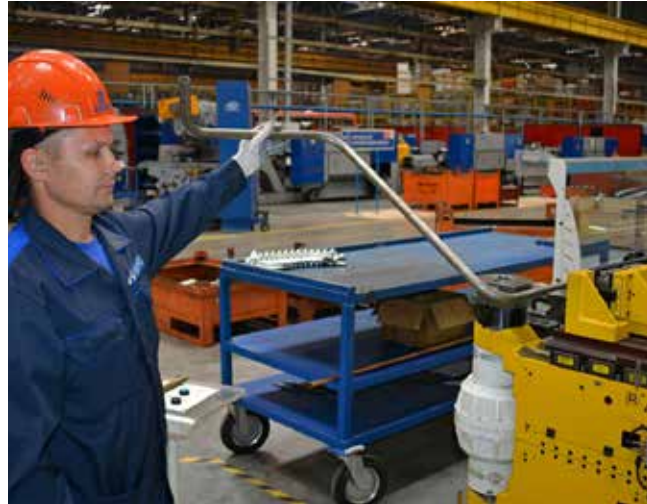
Оборудование позволяет изготавливать изделия со сложной геометрией

С новинками удалось обеспечить полный цикл изготовления деталей трубок ГУР, топливной системы и системы охлаждения, применяемых при производстве пассажирской тех-