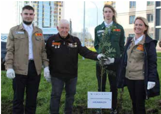
У камазовских арендных домов появилась рябиновая аллея

За два летних месяца на автомобильном, пресово-рамном, литейном и заводе двигателей потрудились 315 студентов РСО из 15 регионов страны. Они приняли участие в сборке 2756 грузовиков, 2478 кабин и 2375 двигателей.