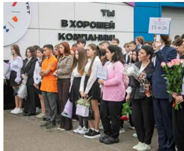
Ряды студентов Техколледжа им. Поташова пополнили 447 новичков

В завершение линейки первокурсники познакомлись с преподавателями и руководителями колледжа, а затем вслед за веду-