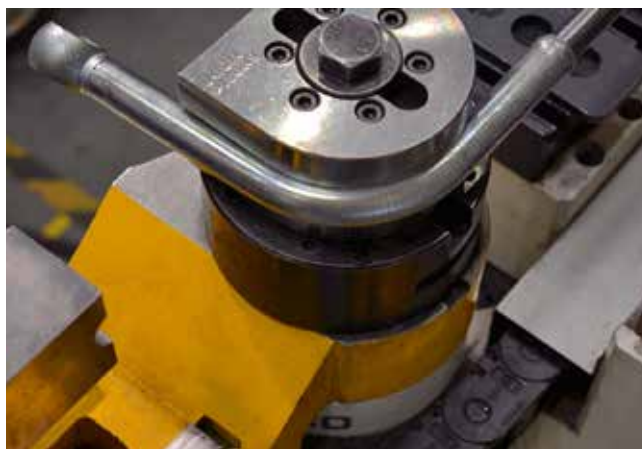
Трубогиб в действии

в механосборочном цехе № 6. На этом оборудовании начали изготавливать изделия со сложной геометрией. К примеру, это трубки с паяными накопниками: трубки ГУР (гидроусилителя руля), топливной системы и системы охлаждения для пассажирского транспорта. Прежде «НЕФАЗ» закупал эти изделия, но теперь, с обновлением парка, появилась воз-