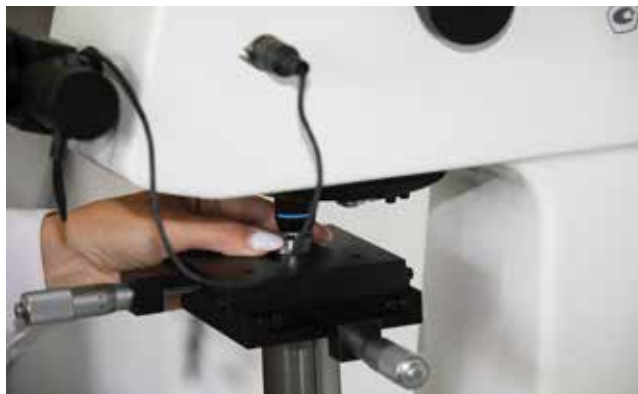
Твёрдость образца испытывается давлением алмазным наконечником

Новые возможности для изучения структуры металла открывает и цифровой микротвердомер «Полилаб». Он необходим в первую очередь для исследования микротвёрдости отдельных участков структурных со-