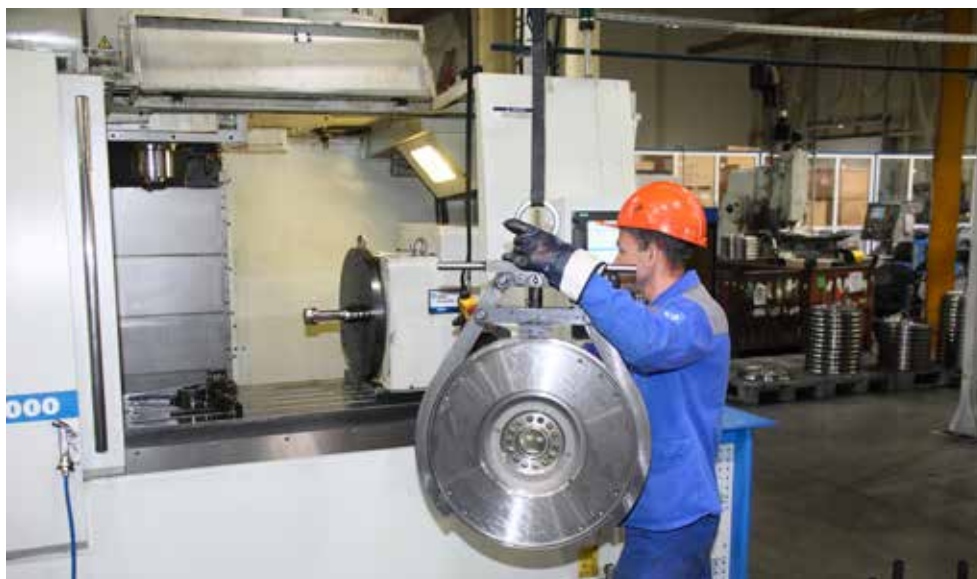
Чтобы обработать один маховик, нужно провести не менее восьми операций