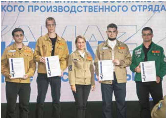
Четверо студентов получили приглашение работать на «КАМАЗе»