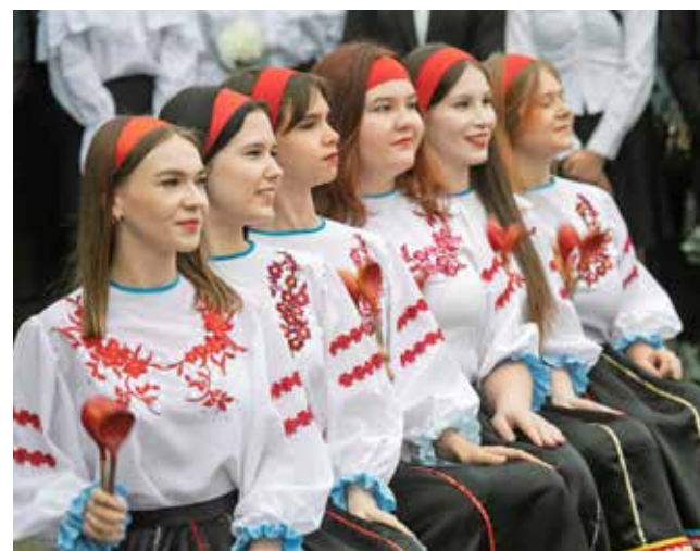
Ложкари в красочных костюмах разбавили задорной игрой официальную часть

качественные шпаргалки, но не пользоваться ими, и с достоинством нести звание студента колледжа.