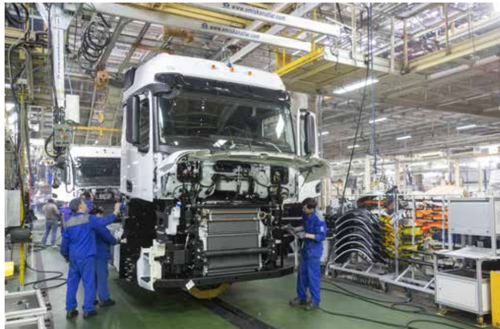
Аутстафферы «КАМА ПРОФИ» трудятся на всех заводах «КАМАЗа»

располагается не один крупный работодатель. И в таких условиях нужно найти кандидата, выявить его потребности, пожелания к работе и предложить наиболее приемлемый вариант.