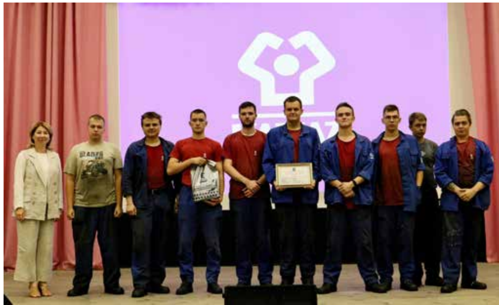
За хорошую работу бауманцам вручили подарки и благодарственные письма

В рамках итогового мероприятия студентам МГТУ вручили благодарственные письма. Отметили поддержку и чуткое руководство наставников, которые сопро-