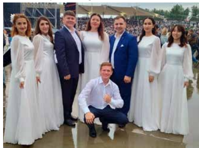
Камазовские вокалисты порадовали и Челны