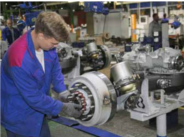
Работа на производстве пошла студентам на пользу