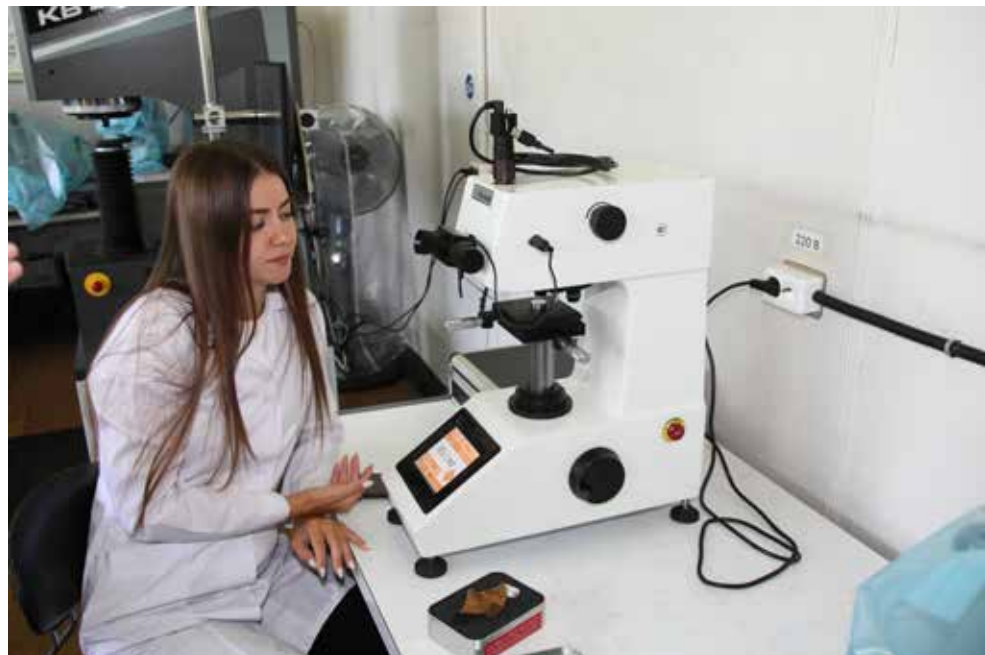
Измерения, сделанные на новом микротвердомере, сомнений не вызывают

С новым прибором увеличилась скорость проведения измерений и их точность. Микротвердомер можно доукомплектовать монитором и тогда будет ещё удобнее оценивать структуру металла. Тут же на принтере можно распечатать результаты исследований — на специальном чеке указываются размеры диагоналей и значение твёрдости. Этот документ прикрепляется к протоколу исследований. И если раньше могли возникнуть сомнения в заключении, то теперь их нет — прибор этот прецизионный, созданный для выполнения сверхточных работ.