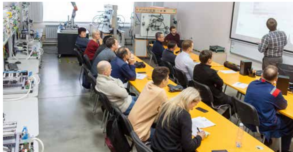
Обязательное обучение новые сотрудники проходят в МЦПК

нодательства (сейчас правила меняются очень быстро). В целом в распоряжении рекрутеров множество инструментов для привлечения новых сотрудников, в том числе они пользуются работными сайтами, ищут персонал в социальных сетях. Один из инструментов — акция «Приведи друга».