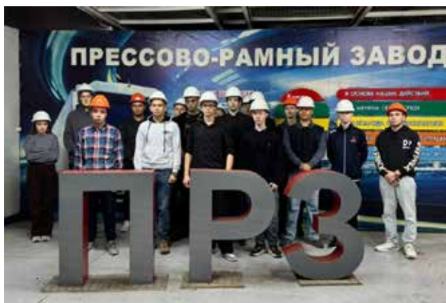
Закрепит впечатление об экскурсии памятное фото

начать освоение профессии с конвейера сборки рам, а настоящие асы трудятся в цехе изготовления штампов.