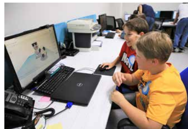
Приглашать детей на работу — полезная практика: глядишь, и продолжат дело родителей

терском учёте и кадровом администрировании. Пока мы всё это пробуем. Как будут результаты, обязательно об этом расскажем, — пообещала гендиректор ЦОБ.