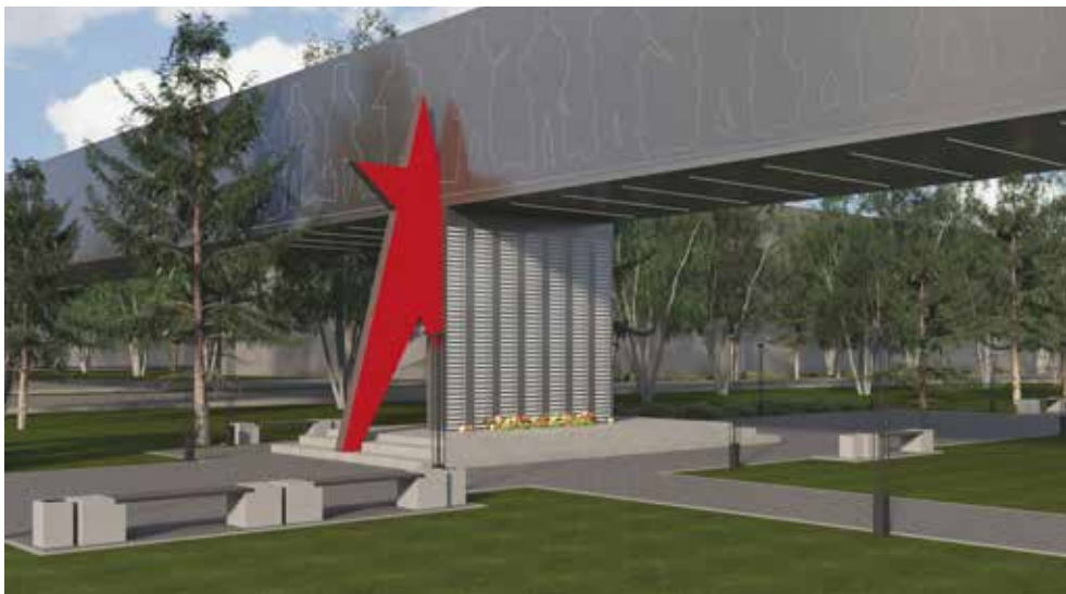
Стену памяти украсит красная звезда, а охранять её будут солдаты

Кроме патриотической локации, здесь расположится зона для эмоциональной разгрузки. В тёплое время года работники завода смогут прийти сюда в обед, отдохнуть от производственного шума в тени деревьев на удобных скамейках. У любителей настольного тенниса появится возможность насладиться любимой игрой на новеньких столах. Чуть дальше будет организована площадка для волейбола. А ещё в планах здесь расширить зону Wi-Fi.