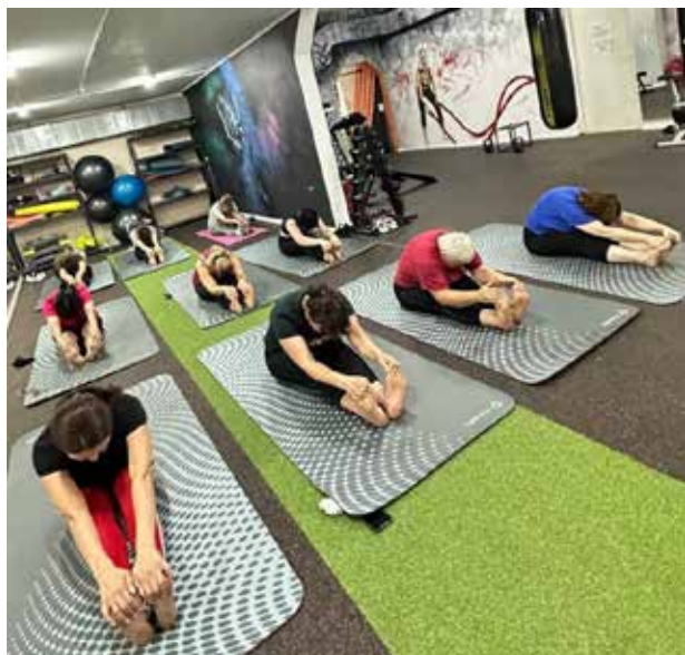
Йога бодрит и заряжает, а ещё развивает гибкость и выносливость

Для вступления в «Территорию женственности» нужно лишь отправить заявку, иметь спортивную форму и быть членом профсоюза АвЗ — для них занятия йогой бесплатны.