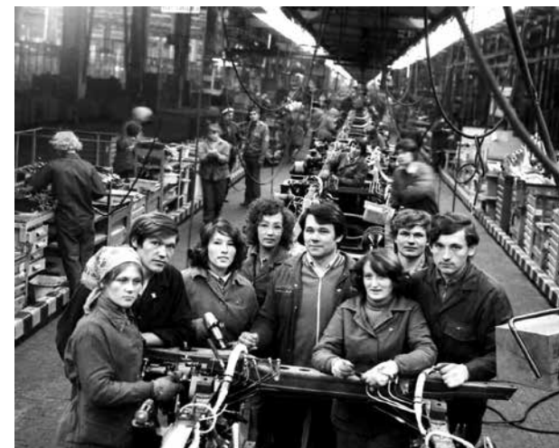
Вглядитесь в эти лица, быть может, на фото знаменитой бригады есть и ваши родные

Заполнить анкету участника и передать исследование ответственным по работе с династиями подразделения, где трудятся родители, необходимо до 15 октября. Защита презентаций, вышедших в финал конкурса, состоится в Визит-центре «КАМАЗа».