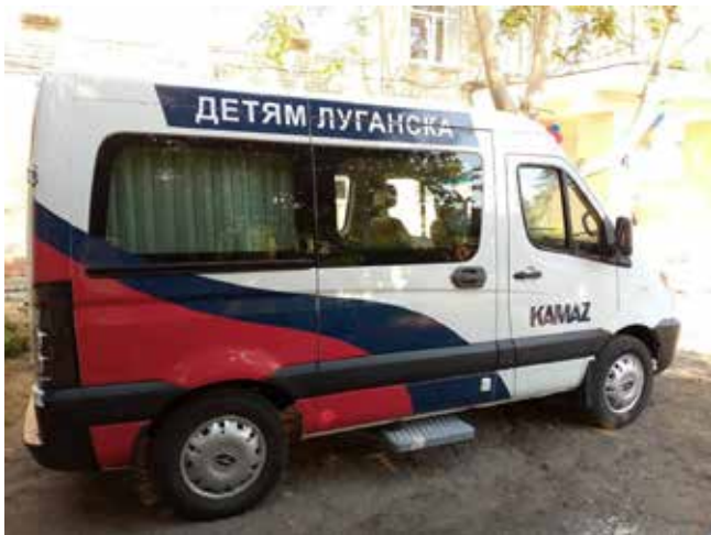
Микроавтобусы Семейному центру необходимы

Эта поездка — часть постоянной работы, которую «КАМАЗ» ведёт с первых дней специальной военной операции. За три года автогигант направил 22 конвоя с гуманитарной помощью для поддержки военнослужащих и мирного населения новых регионов России. Общая сумма гумпомощи превысила миллиард рублей. Грузы формируются при активном участии самих камазовцев и всегда учитывают конкретные потребности и заявки, поступающие с мест.