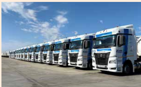
Этим КАМАЗам предстоит преодолеть почти 10 тыс. км пути

Автопробег проводится совместно с ООО «Газпром гелий сервис».