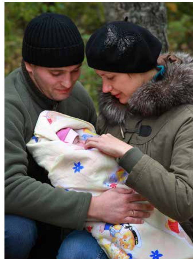
Если отец начинает заботиться о малыше с первых дней, семья становится крепкой

С раннего возраста заботьтесь о безопасно-