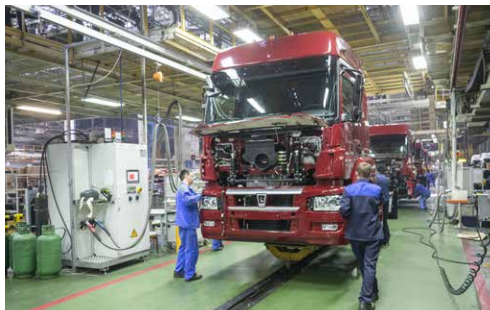
Сотрудников блока закупок оценили масштаб и слаженность работы главного сборочного конвейера

После встречи на АвЗ появились идеи и других маршрутов. Все они внесены в план работы отдела по управлению персоналом. Уже готовится экскурсия в Визит-центр «КАМАЗа», будут реализованы и другие идеи.