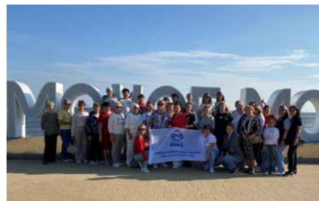
Камское море совсем близко, главное собраться

6 сентября познакомиться с достопримечательностями города смогли 90 работников, в числе которых были и ветераны подразделения. На экскурсию камазовцы отправились