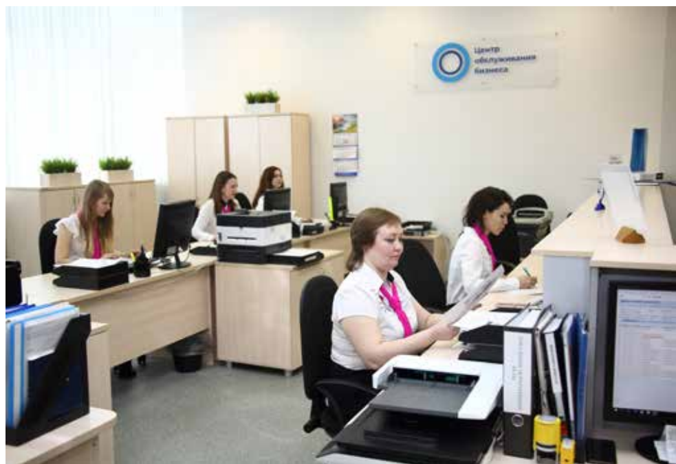
ЦОБ обслуживает больше 50 компаний, входящих в ГК «КАМАЗ»