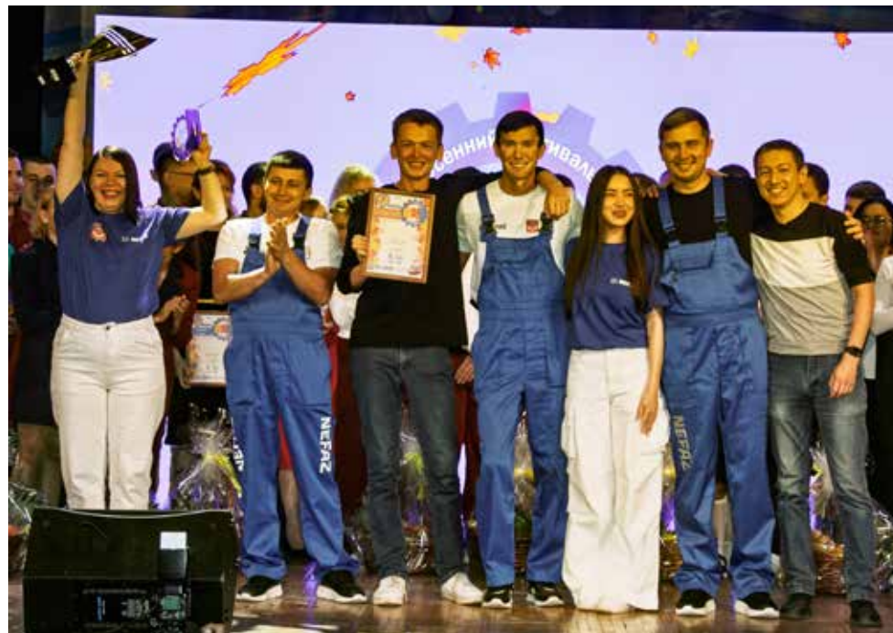
Камазовский осенний кубок КВН отправляется на «НЕФАЗ»

— Вы же сами просили подарок, который подходит всем грузовикам, — ответили юмористы. — А что вы