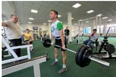
Нефазовцы поразили своих коллег силой, стойкостью и выносливостью