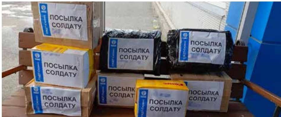
В каждой посылке всё самое необходимое

Очередную партию гуманитарного груза сформировали и отправили бойцам СВО и сотрудники — члены профсоюза «Промжелдортранс-Сервис». При поддержке администрации и профкома было приобретено и упаковано самое необходимое: медикаменты, калорийные продукты, средства гигиены. «Всё это поможет сохранить здоровье и жизни наших защитников», — уверены в «ПЖДТ-Сервис».