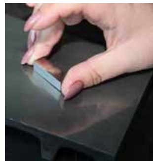
Так выглядит восстановленная плитка концевой меры