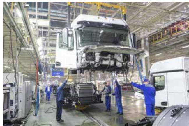
Создание мини-бригад пошло производству на пользу

Профит в размере 9000 вышел, в частности, у слесаря МСР с пятым грейдом Гузелии Чемодуровой. Цифры уточнили в ДРП, а сама слесарь подтвердила, что получит за август значительно больше, чем выходило до начала корпоративного отпуска и последующего сокращения рабочей недели. Нагрузка при этом выросла,