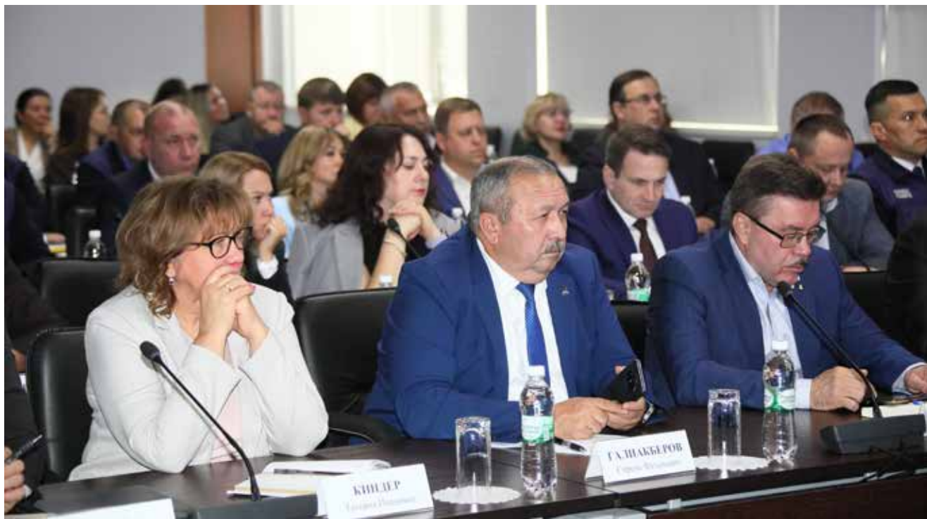
Руководители понимают, как важно сохранить в непростых условиях камазовский дух

Подготовила Эльвира Галлямова.