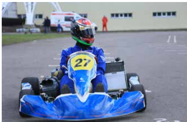
Камазовская молодёжь поборется за лучшее время в заездах

Сильнейшие картингисты попадут в список спортсменов, которые будут представлять «КАМАЗ» в официальных всероссийских соревнованиях.