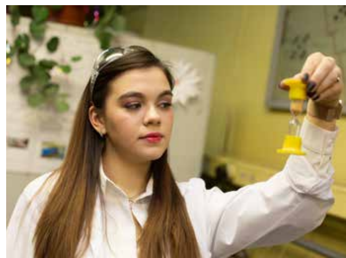
Кто знает, может, сейчас самое время найти свою любовь?