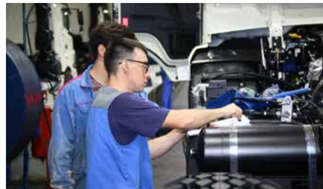
Рабочие между собой распределяют операции и могут контролировать друг друга

Напомним, что временное положение о материальном стимулировании рабочих за повышение интенсивности труда будет действовать до конца года. Описанными возможностями может воспользоваться каждый завод, который располагает конвейерами и автоматическими линиями.