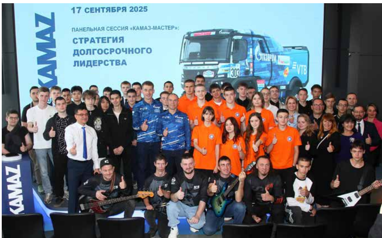
Общая фотография первой встречи останется в истории дискуссионного клуба