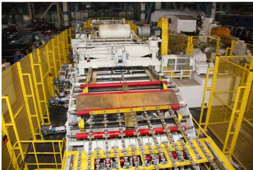
После модернизации линия поперечной резки металла стала гораздо функциональнее

сварки будет одинаково высоким. С запуском в эксплуатацию этого оборудования в июне реализация проекта на площадке цеха штамповки и сварки деталей кабин была успешно завершена.