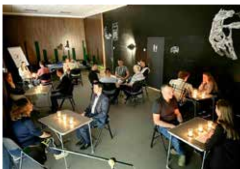
На первый вечер знакомств пришли 12 парней и пять девушек

шие корректировки в следующую встречу. Так, у каждого участника будет карточка, куда он сможет записывать контакт и оставлять свои пометки, поскольку свидания проходят очень быстро и запомнить всю важную информацию о человеке сложно.