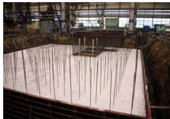
Под новую линию продольной резки готовится мощный фундамент

лазеры для резки деталей на мелкосерийные вариативные каркасы кабин поколения К5, и простаивать на ПРЗ, где обрабатываются десятки тонн металла, они точно не будут.