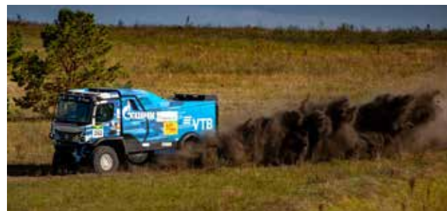
«КАМАЗ-мастер» отправился покорять очередной рубез чемпионата России

29 сентября команды финишируют в Саранске. Здесь же пройдёт и торжественная церемония награждения призёров.