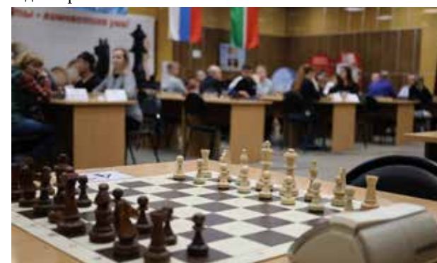
Камазовцы покажут своё мастерство на разных площадках

А 23-24 октября на «КАМАЗе» пройдёт личное первенство компании по шахматам. Лучшие спортсмены представят автогигант на соревнованиях ГК «Ростех» в декабре.