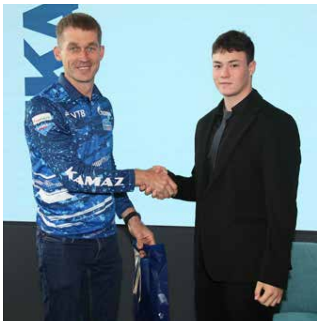
Авторов лучших вопросов спортсмены отметили подарками

Затем студенты, не упуская представившейся возможности, просили у пилотов автографы и фотографировались с ними. На снимках ребята устроились между спортсменами и тянули вверх указательный палец, широко улыбаясь. А сделанной фотографией можно будет похвастаться друзьям, упоминая, что был на первой дискуссионной встрече клуба «КАМАЗ 2035».