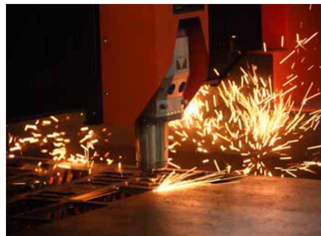
На лазерах ведётся наладка под задачи производства