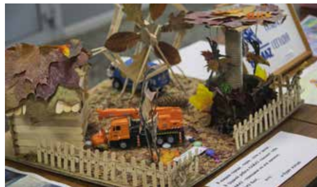
К празднику на заводах уже готовы жизнеутверждающие инсталляции

Череду праздников в подразделениях компании открыл 23 сентября коллектив прессово-рамного завода. 25 сентября концерты пройдут на заводах «КАМАЗа». Кульминацией торжеств станет проведение общекамазовского Дня машиностроителя в Органном зале 2 октября. Сотрудников автогиганта поздравят генеральный директор «КАМАЗа» Сергей