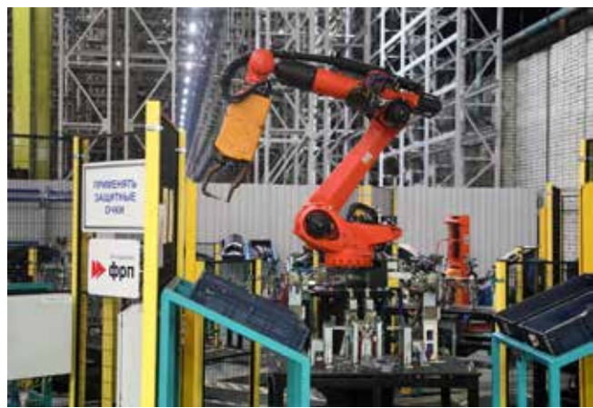
Этот робот сейчас сваривает сразу шесть видов узлов

Проходящие мимо этого железного сварщика заводчане не скрывают удивления: «Вот так карусель!» Робот, окружённый различными видами оснастки, по очереди наклоняет «голову» к каждой из них, чтобы сварить очередной узел. Оснащение меняется в зависимости от плановых задач. Сейчас рабочий управляет сваркой шести разных по сложности узлов, при этом необходимо правильно закрепить в приспособлении каждую заготовку — если фиксация выполнена с нарушением, машина встанет. Влияние человеческого фактора сведено к минимуму, а значит, качество