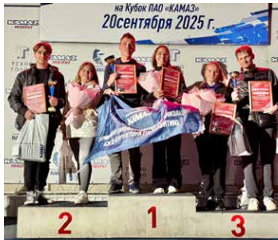
Сильнейшие картингисты представят «КАМАЗ» на официальных турнирах в России

Призёров наградили дипломами, медалями, кубками, вручили подарочные сертификаты. Команды-победители получили сувениры «КАМАЗа».