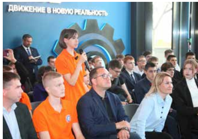
Студенты интересовались всеми аспектами жизни пилотов...

Речь зашла о выборе молодёжи — поступать в челнинский вуз или ссуз или учиться в других городах. Тема весьма актуальна и для нынешних гостей-сту-