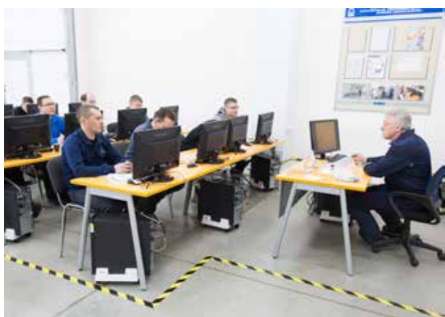
Высококвалифицированные педагоги введут в курс дела

Да и обычные жители города без проблем могут получить свою «корочку». Обучение проходит и индивидуально, и в группе, при наличии желающих возможен вечерний