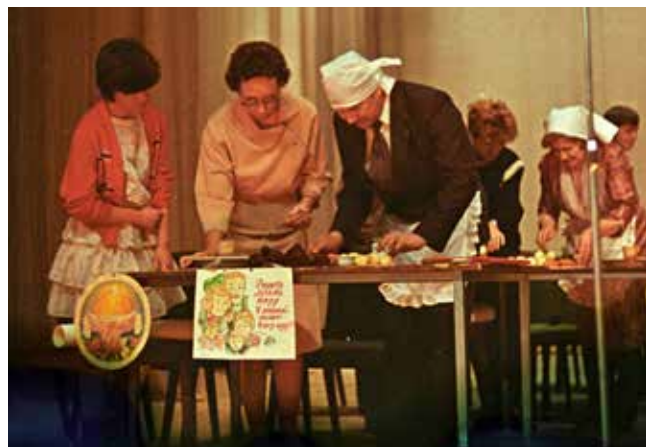
На сцене к празднику устраивали семейные конкурсы