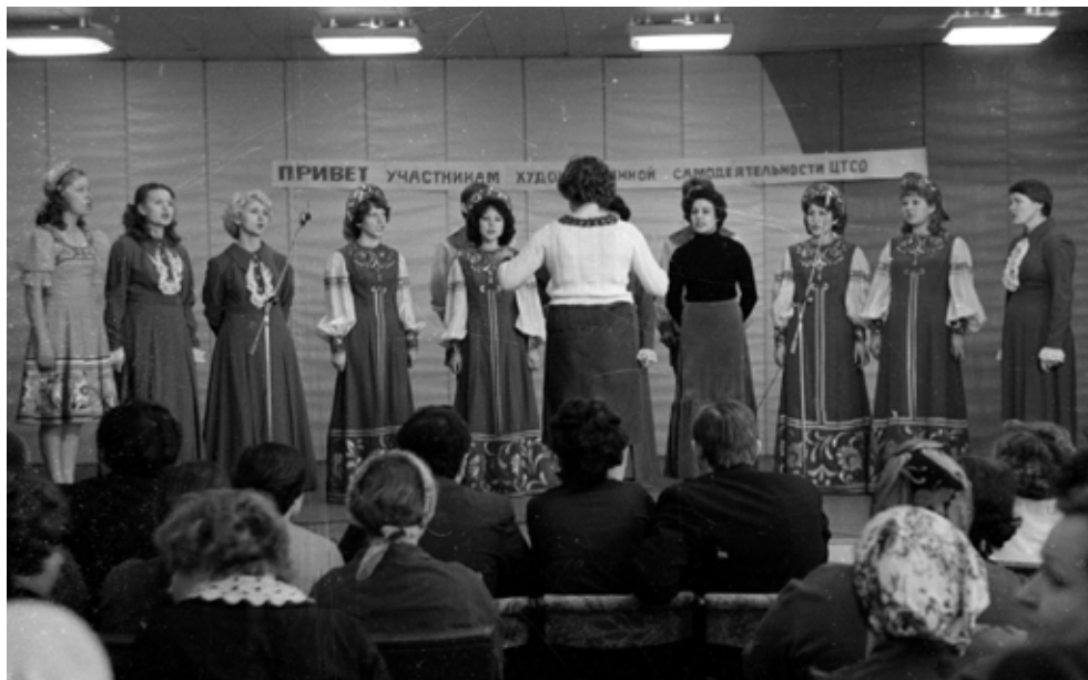
Таковыми были заводские праздники 80-х