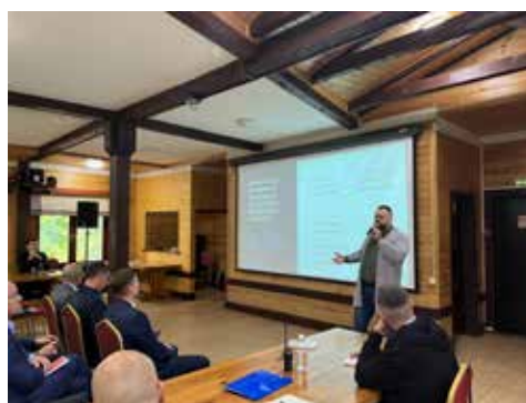
Время требует усиления киберустойчивости компании, и методы были предложены

В ходе познавательной конференции был также презентован проект «Концепция развития информационной безопасности ПАО «КАМАЗ». Этот документ определяет основные стратегические цели развития информационной безопасности, направлен на минимизацию рисков в условиях цифрового развития и содержит рекомендации по развитию информационной безопасности в организациях с участием автогиганта. В его рамках планируется централизованное управление процессами в сфере информационной безопасности на всём автогиганте.