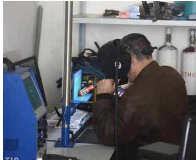
Овладеть сваркой помогают современные технологии — в этом случае VR-очки

За 10 лет МЦПК стал настоящей кузницей рабочих профессий для «КАМАЗа» — одной из крупнейших машиностроительных корпораций страны. Сюда приходят люди без опыта, а уходят настоящие профессионалы, с первого дня после выпуска имеющие возможность легко трудоустроиться на производство. Эффективность — нагляднее некуда!