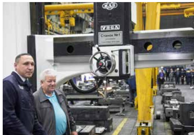
Станок № 1 корпуса отмечен памятной табличкой

После концерта ветераны посетили заводской музей, а потом для них организовали чаепитие. Первопроходцы завели душевный разговор о былых годах, вспоминали тех, с кем работали в одной бригаде и цехе, на заводе, рассказывали интересные истории. В память о событии ветеранам преподнесли сувениры.