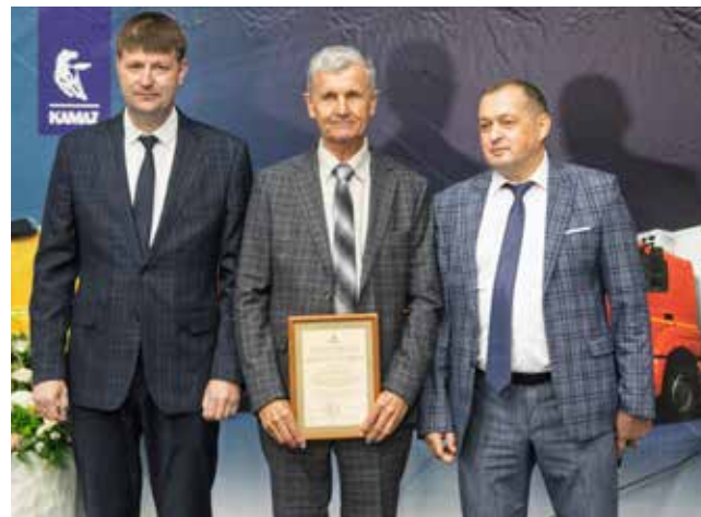
13 кузнецов получили награды из рук руководителей предприятия

А первой горячей поковкой, полученной на кама-