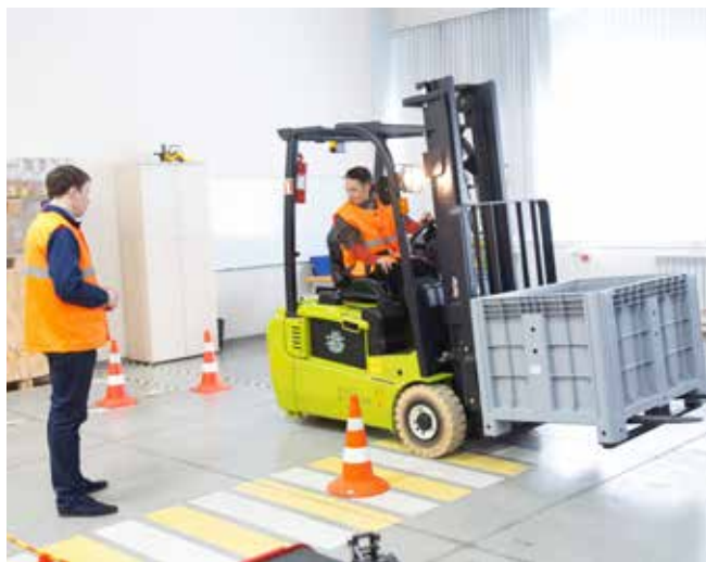
Без практических навыков при освоении рабочей профессии никуда

формат — после работы, к примеру. В зависимости от специальности курс стоит от девяти до 25 тысяч рублей.