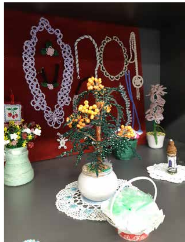
«Умелые ручки» умеют всё