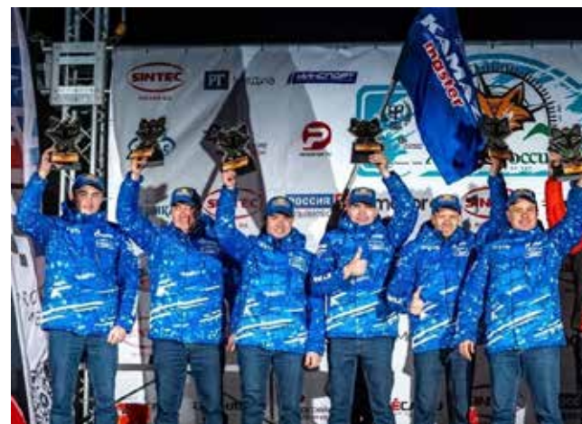
Два первых места на бахе «Холмы России» остались за командой «КАМАЗ-мастер»

Заключительный этап чемпионата России «Великая степь» пройдёт в Калмыкии с 21 по 25 ноября.