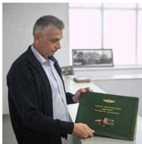
Фонд музея пополняется в том числе и за счёт подарков