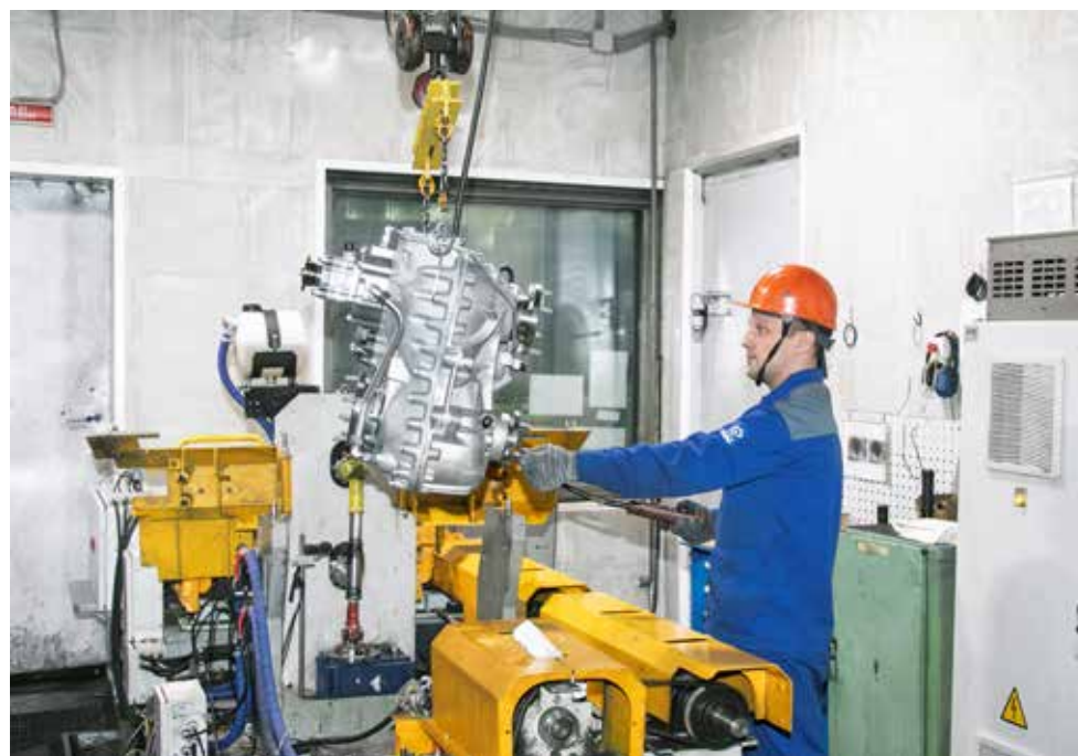
Так выглядит модернизированный стенд, на котором можно проверять все имеющиеся виды раздаточных коробок

— Стенды мы модернизировали с учётом новых технологий. Прежде многое приходилось делать в ручном режиме, сейчас всё автоматизировано, человеческий фактор исключён. Оператор выбирает нужную программу, под каждую раздаточную коробку она своя, запускает — и дальше получает готовый протокол испытаний. В нём указаны все параметры, мощностные характеристики, дата и время прохождения испытания. Данные хранятся минимум пять лет, так что при необходимости их мож-