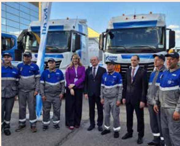
Водители успешно прошли путь в 10000 километров

Символичным завершением автопробега стало торжественное подписание памятной фотографии с изображением карты масштабного маршрута. На форуме экологичные тягачи также приняли участие в работе экспозиции «Газпром — территория технологического лидерства».