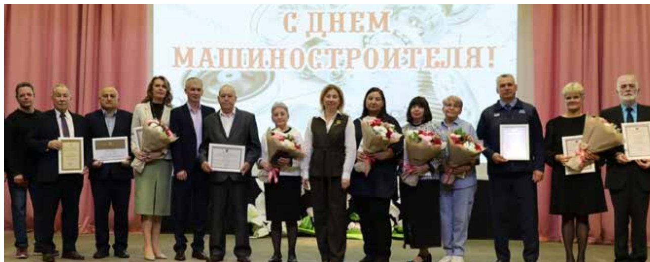
В День машиностроителя лучшие работники удостоиваются наград