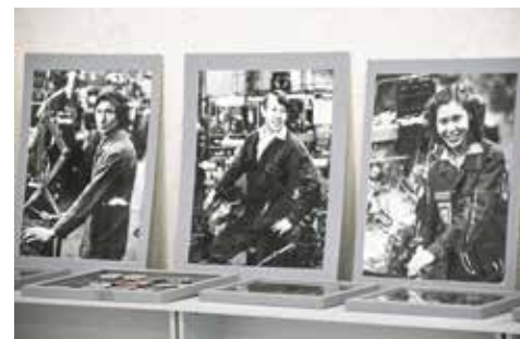
Вот они, камазовцы 80-х — открытые, вдохновлённые

Сейчас в фондах музея более 10000 единиц хранения, и за каждой вместе с инвентарным номером закреплена история по-