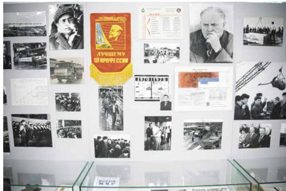
Эти кадры были сделаны в первые годы строительства автогиганта

В экспозиции представлено множество документов — листовки, «молнии», условия участия в первенствах. Тут же и колонна переходящих знамён, их вручали коллективам — победителям соцсоревнований. Рядом портреты рядовых «КАМАЗа» — слесарей, станочников, наладчиков, чьим трудом завоевывались почётные звания и награды. Их открытые улыбки, гордость за своё дело, радость созидания поймал в объектив именитый фотограф Михаил