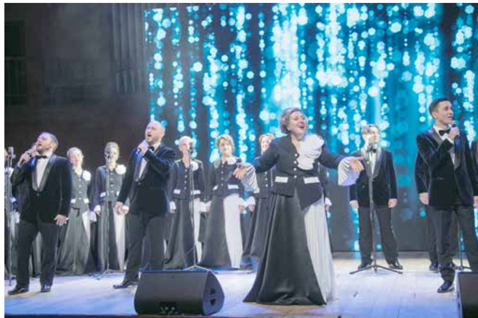
Выступление Государственного камерного хора РТ завораживало зрителей — и для глаз услада, и для ушей

— За этой датой стоит героический труд сотен тысяч людей. И мы должны об этом помнить! «КАМАЗ» — это не только заводы и машины, это в первую очередь люди. Люди, которые своим трудом обеспечивают безопасность и благосостояние Родины, и мы все — рабочие, инженеры, руководители — составляем единую команду, которая двигает вперёд не только наше предприятие, не только нашу отрасль, но и всю нашу великую страну. Молодёжь — это наше будущее, но ветераны, опытные работники с многолетним стажем, — это опора и фундамент нашего предприятия. Низкий им поклон за труд,