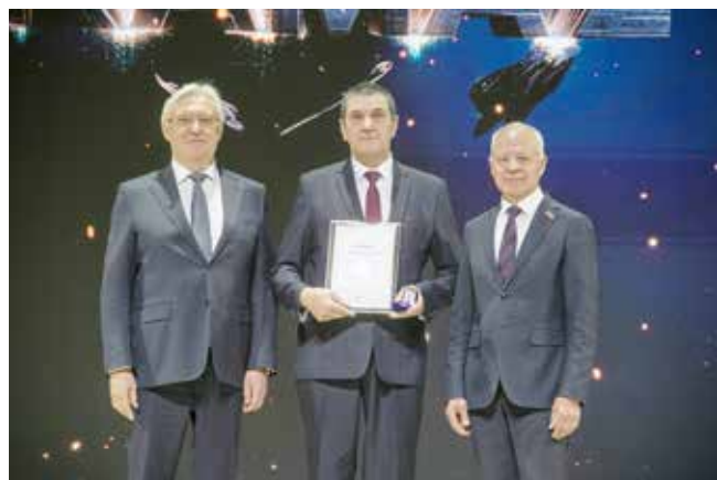
В этом году звание «Заслуженный работник КАМАЗа» на сцене Органного зала из рук руководителей получили 19 человек

Продолжился вечер 40-минутным выступлением Государственного камерного хора РТ. Они, как говорится, «додали» всем поколениям и возрастам своей программой — и «Это здорово», между прочим! Именно этой песней хор поприветствовал гостей. Ну а дальше... «Беловежская пуща», «Любовь, комсомол и весна», татарские песни о родной земле, «Ну, погоди», объединившийся со знакомыми всем «Мой адрес — Советский Союз», «Сансара», «Матушка-земля», «Джимми, Джимми»... Завершился концерт патриотической песней, под которую весь зал в едином порыве поднялся на ноги. Ведь камазовцы, закалённые годами упорного труда, хорошо знают: сила — в единстве.