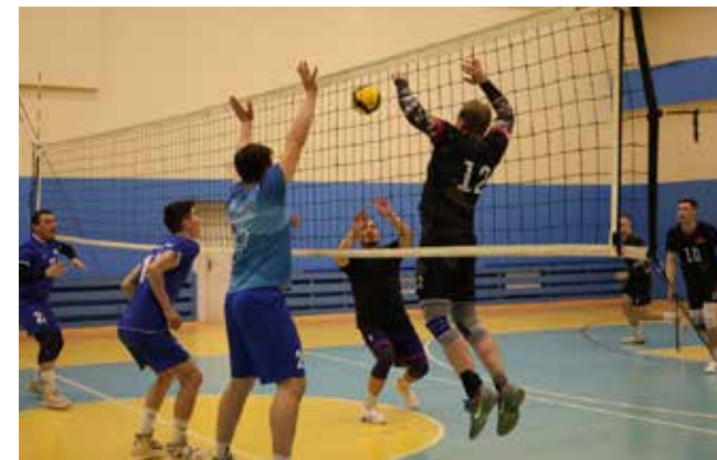
Выполнить силовую подачу нетрудно, а принять мяч — сложнее

Полуфинальные игры запланированы на 13 октября: в первой паре встретятся «ЧВК» и ПРЗ, третьим полуфиналистом стала команда АвЗ. Её соперник определится в матче ЗД — «РД». Финалисты поборются за главный трофей 14 октября.