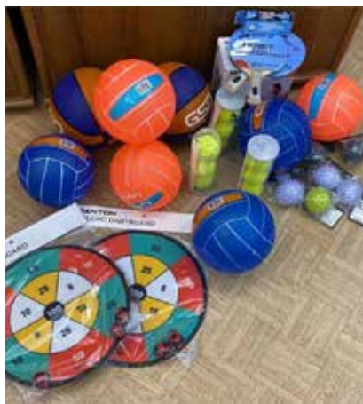
Мячи, ракетки и дартс помогут детям в восстановлении

А ещё реацентр прислал фотографию приобретённых товаров: массажных мячиков, ракеток для настольного тенниса, детских волейбольных мячей, набора магнитного дартса и теннисных мячей.