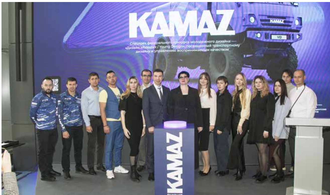
Камазовские кураторы помогут молодым дизайнерам хорошим советом

В завершение ведущий повторил основную мысль выступающих: конкурс даст не только опыт, но и поможет в карьере. Например, при трудоустройстве можно будет говорить: «А вот эту идею дизайна КАМАЗа предложил я».