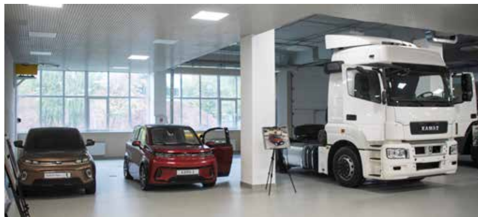
В музее есть место и для других машин