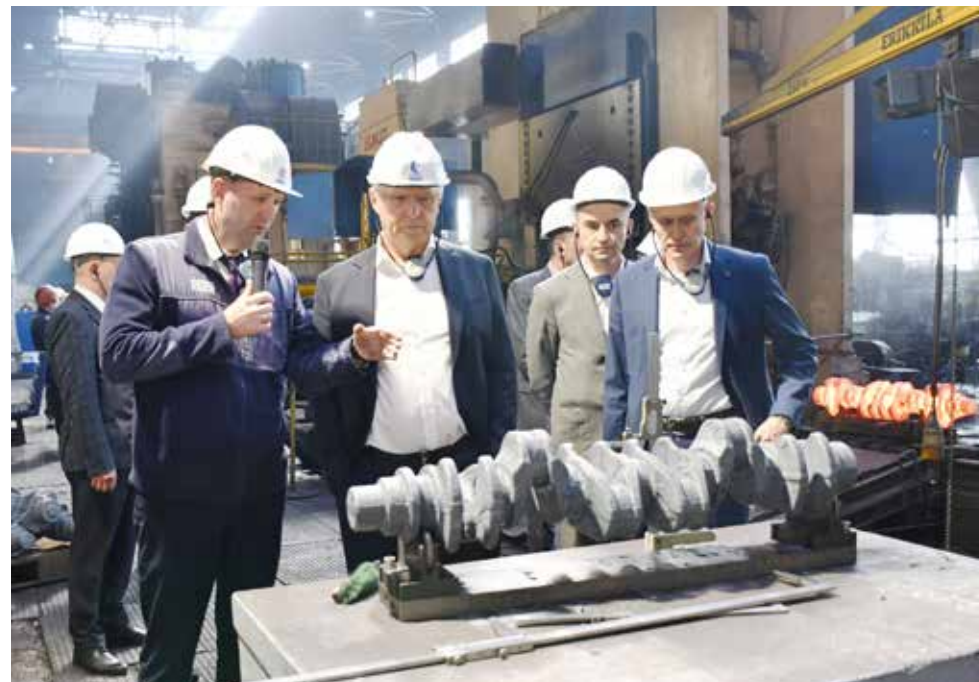
Мероприятия, направленные на снижение дефектности коленчатого вала (проект «Тибет»), позволили снизить в 2025 году внутренний брак на 74%, а внешний — на 54%

Кроме того, был обеспечен 100%-ный контроль всех последующих опе-