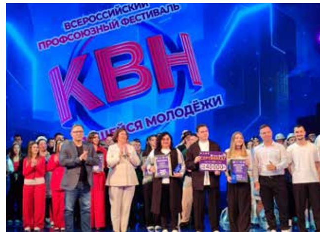
За неделю «Нелогичные» прошли в финал и заняли первое место в двух играх КВН среди работающей молодёжи

— Вот сегодня тебе на работе могла на голову упасть балка (ужас на лицах). Но благодаря профсоюзу (сделал акцент на этом слове) ты в безопасности, потому что ты здесь, на игре КВН.