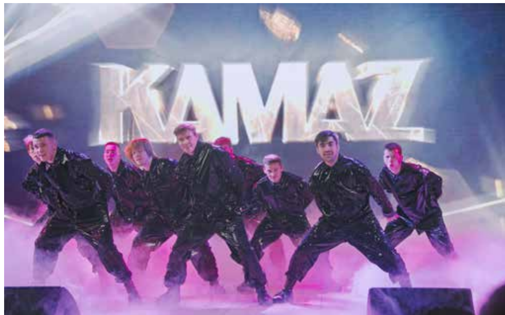
Шоу-балет «Кристалл» под барабаны задал ритм концерту