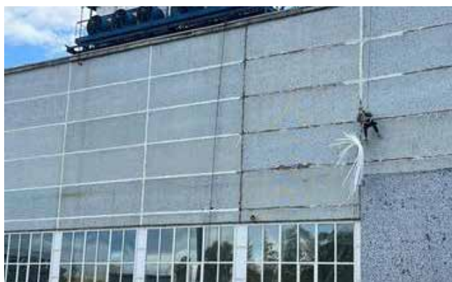
На заводе двигателей заканчивается ремонт межпанельных швов