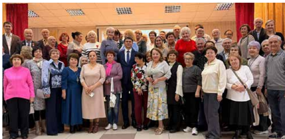
На праздник было приглашено 80 ветеранов

Концерт прошёл на одном дыхании. Ветераны, покидая праздник, были довольны, ведь они смогли отвлечься от житейских забот и хорошо отдохнуть. Они искренне поблагодарили всех за внимание и творческие подарки, подчеркнув, что с ними день стал поистине особенным.