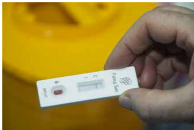
Одна полоска — результат отрицательный

Для собравшихся также подготовили отдельный уголок для анонимного экспресс-теста, где все желающие могли сдать анализ на наличие инфекции.