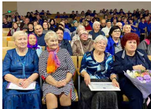
Выступление заводских артистов подняло ветеранам настроение

Следующий номер газеты «Вести КАМАЗа» выйдет 13 ноября 2025 года.