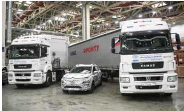
Три седельных тягача привезут всё необходимое бойцам из татарстанских полков

сказал Президент России Владимир Путин, мы все мобилизованные, у нас общая цель — победа. И отправкой помощи бойцам мы приближаем её.