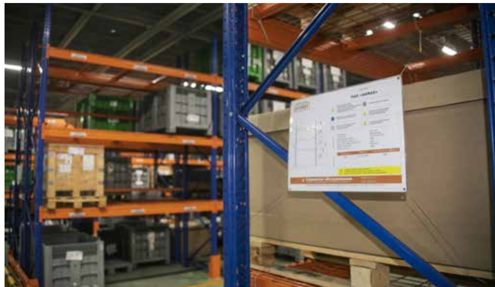
На новом складе визуализированы все потоки

Гайнуллин. — Решено было пересмотреть и расширить состав товарной корзины, она комплектуется для каждого поста конвейера под последовательный план закладки необходимого количества кабин. На новом складе решили взять на вооружение самые передовые