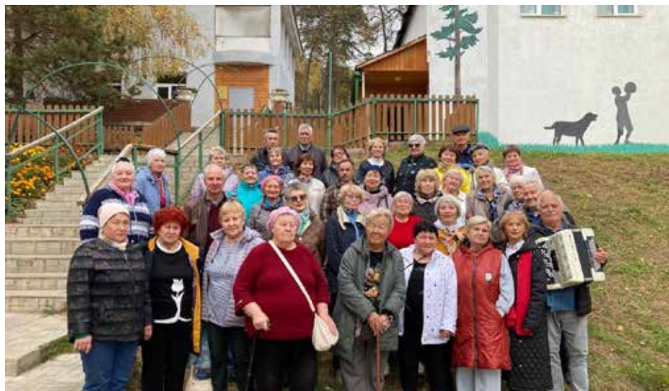
Дом отдыха «Берсут» принял камазовцев с большой заботой

После гостям предложили проследовать в столовую на чаепитие. Веселье продолжилось под баян. А ещё были душевные разговоры, воспоминания, да и в целом хорошая дружеская атмосфера. Она и помогла окунуться всем собравшимся в молодость.