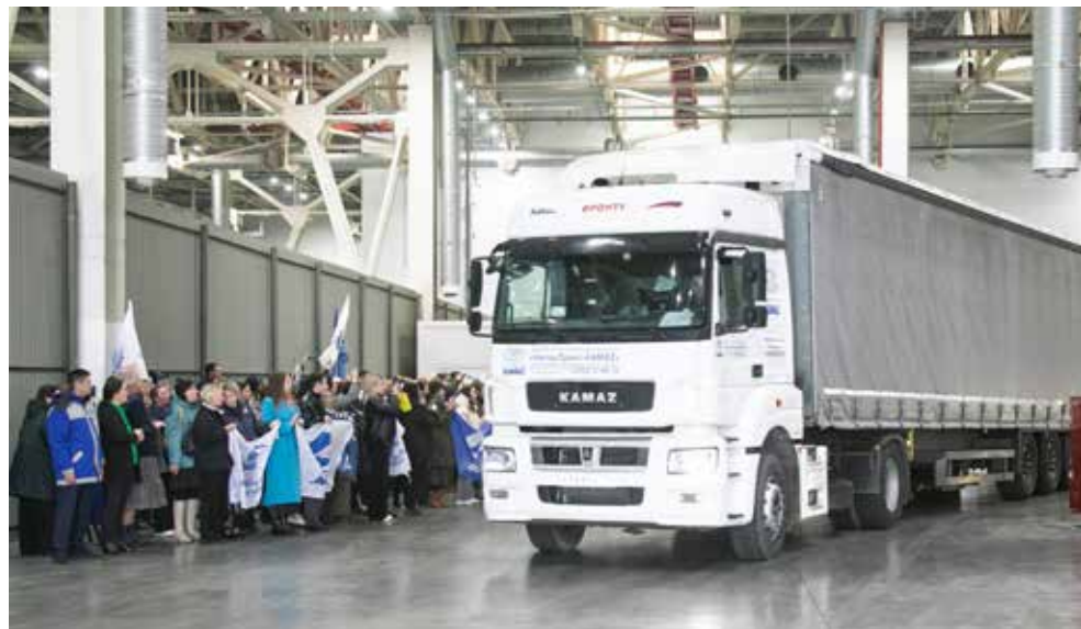
Гуманитарный конвой отправлялся в путь под аплодисменты камазовцев