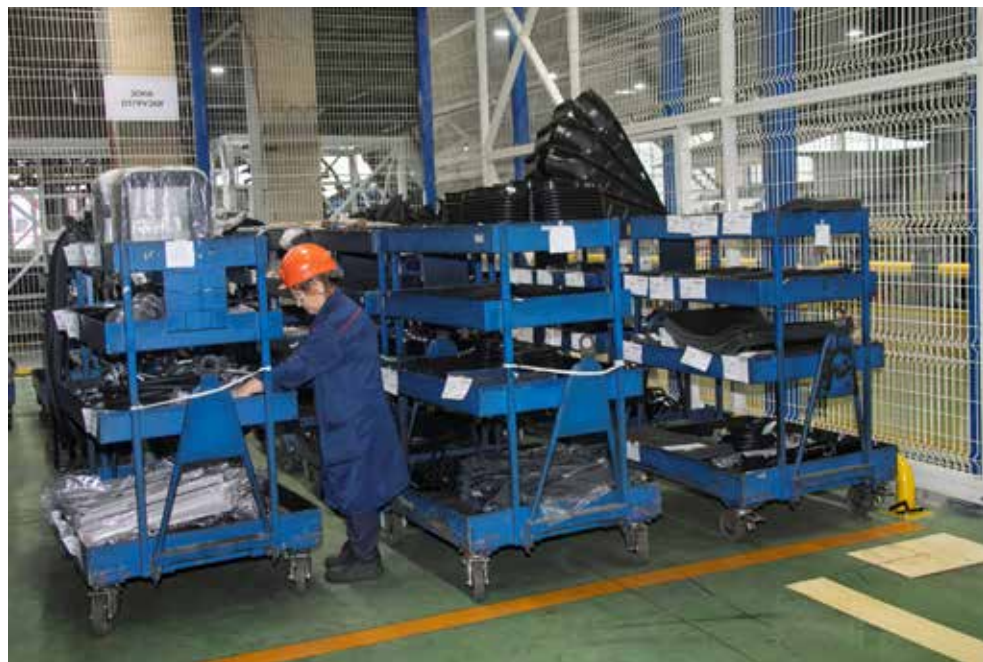
В товарных корзинах на конвейер доставляется 65% деталей, необходимых для сборки кабины

Сейчас на складе готовятся к внедрению новых инструментов — здесь будет организовано два мобильных рабочих места, которые помогут операторам более оперативно оформлять необходимые для отгрузки на конвейер деталей документы. Появятся терминалы сбора данных и другие WMS — инструменты, автоматизирующие и оптимизирующие все складские процессы. Руководители уверены: у этой логистической зоны есть и другие резервы для повышения производительности труда. А значит, и при увеличении хода ГСК на конвейер последовательно и точно в срок будут поставляться только нужные детали.