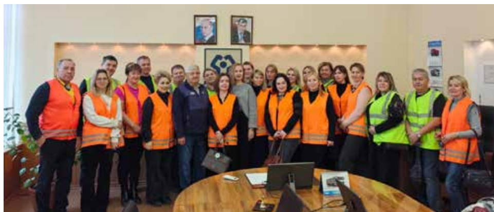
Свыше двух десятков родителей захотели увидеть, где будут работать их дети

Эта встреча ответила на многие вопросы родителей — теперь они знают, в каких условиях предстоит трудиться их детям, и могут не переживать за ребят. Ведь видели всё сами!