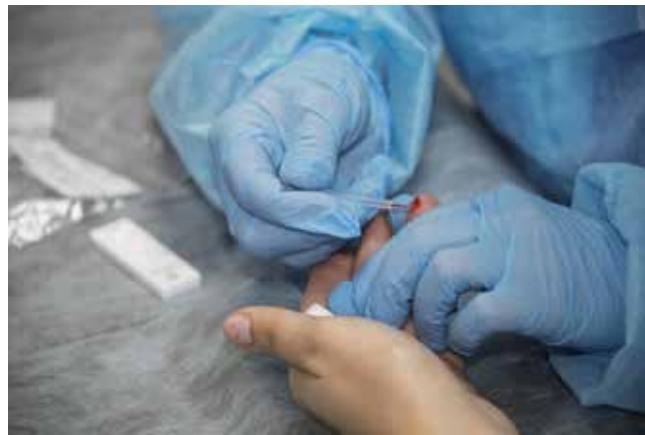
Тест на ВИЧ-инфекцию нужно сдавать ежегодно

Отсутствие терапии, подавляющей вирус, неизбежно приведёт к синдрому приобретённого иммунодефицита — когда иммунитет человека станет до того слабым, что не сможет