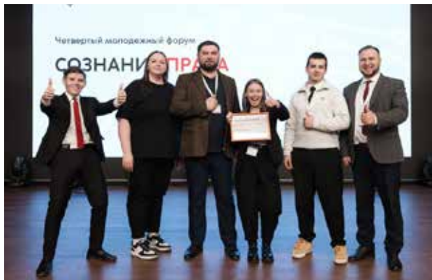
Молодые смогли не только сформулировать, но и защитить свои ценности

Этот форум — не первое совместное взаимодействие АНО «МДТО» с ПАО «КАМАЗ», направленное на расширение программ антикоррупционного просвещения. Ведь именно этические ориентиры формируют устойчивую профессиональную культуру, а она очень важна для каждого предприятия страны.