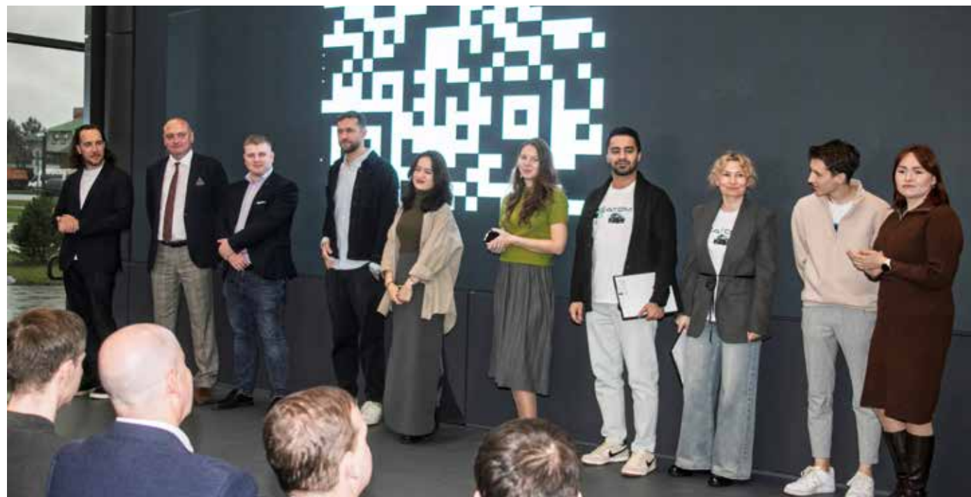
Команда создателей машины детально рассказала о своём автомобиле