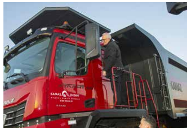
Дизайн и функционал камазовских машин впечатлил высоких гостей

ции предложили формулу «автомобиль разумный», снабжённый специальным искусственным интеллектом. А дизайн автомобилей будет минималистичен, ведь ИИ эта характеристика не нужна. Кроме того, высказали идею: нужно «ловить» современные тренды, добавлять популярные детали (к примеру, узкие фары) в облик авто, чтобы продукция была востребованной.