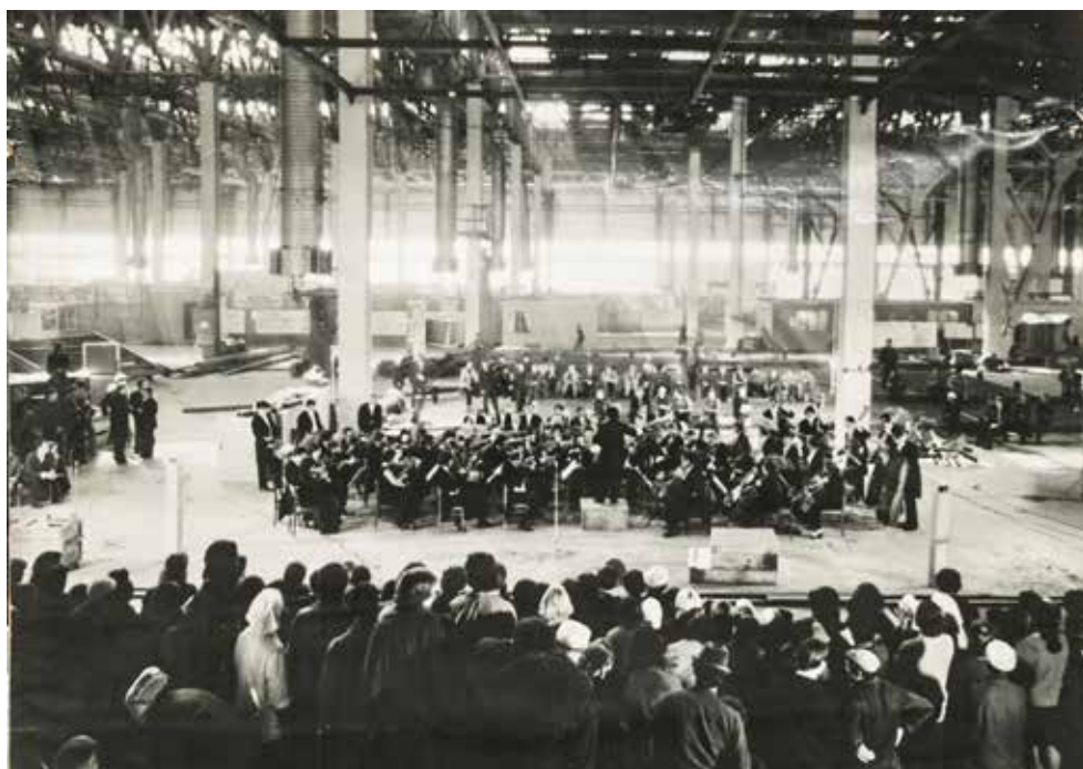
Государственный симфонический оркестр ТАССР побывал на «КАМАЗе» ещё в 1975 году