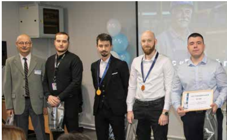
Команда завода двигателей, набрав более 73 баллов, показала лучший результат

Церемония по традиции началась с разбора самого сложного задания — это был этап командного конкурса. За полтора часа экипажам мастеров подразделений нужно было выполнить восемь заданий, в том числе