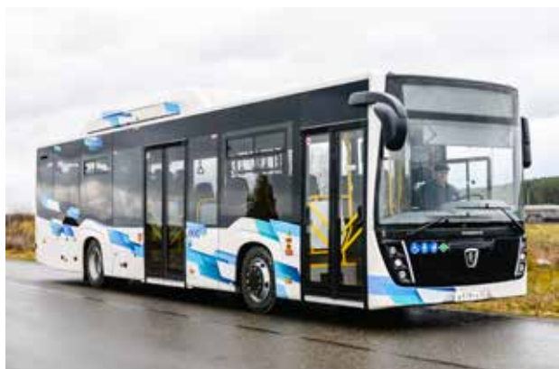
Этот автобус теперь в числе лучших товаров России

Эти победы подтверждают неукоснительное следование высоким стандартам качества и постоянное стремление предприятия к совершенствованию и развитию отечественной автомобильной промышленности.