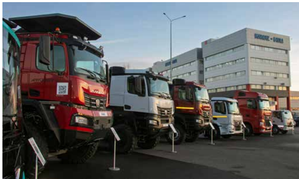
Современные разработки «КАМАЗа» в плане дизайна очень эффектны