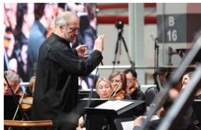
2023 год. Симфонический оркестр Мариинского театра под руководством Валерия Гергиева выступает на заводе каркасов кабин