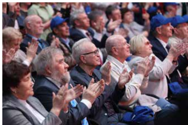
Камазовский зритель встречает музыкантов с огромным воодушевлением и благодарностью