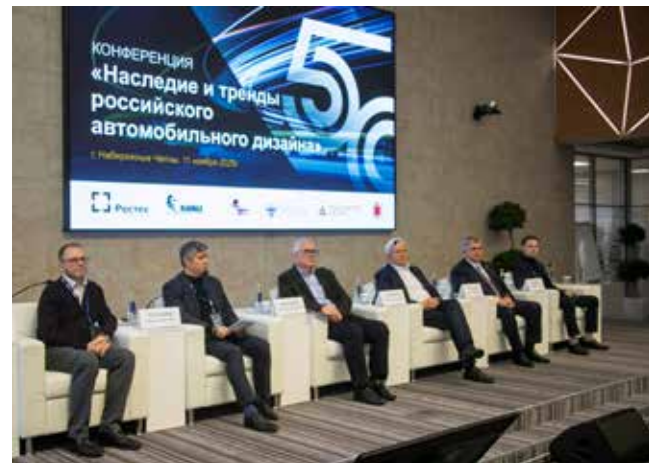
Спикеры конференции обозначили главные тренды автодизайна

В дальнейшем обсуждении участники конферен-