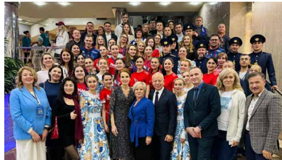
Камазовцы второй год подряд занимают первое место в общекомандном зачёте