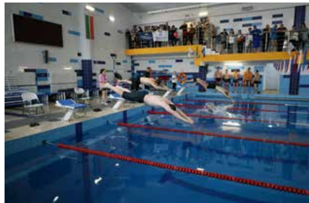
Пловцам предстояло преодолеть дистанцию 50 метров

В общекомандном зачёте по сумме баллов победил БЗГД — ДР. Второе место занял «Челныводоканал». Тройку замкнул кузнечный завод. К слову, в прошлогодних соревнованиях по плаванию самыми сильными на «КАМАЗе» также становились представители НТЦ, а КЗ и «ЧВК» поменялись местами на призовом пьедестале.