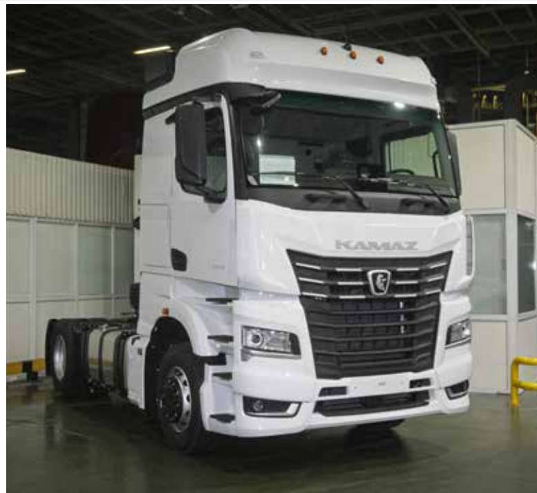
КАМАЗ-54901 в максимальной комплектации может работать на дорогах России и за рубежом