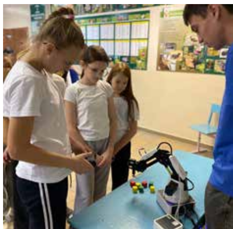
Робот-манипулятор заинтересовал ребят