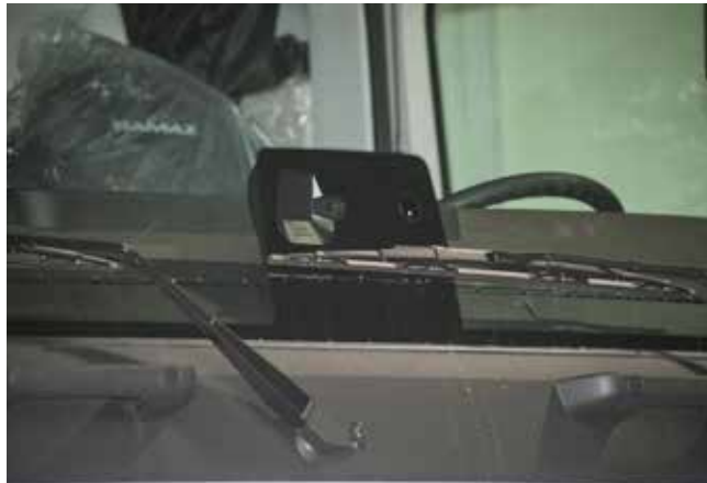
Эта камера на лобовом стекле контролирует движение на полосе и считывает дорожные знаки

*ADAS — от англ. Advanced driver-assistance systems — системы помощи водителю.