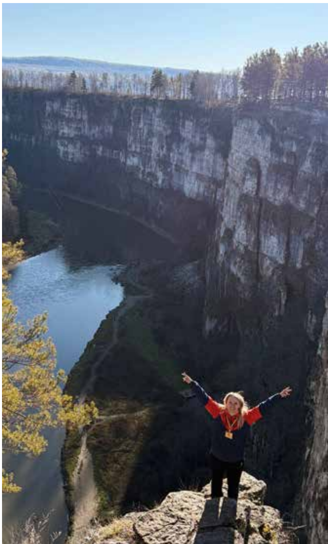
На Айских Притёсах в Башкирии тепло и очень красиво

По дороге домой, в Набережные Челны, туристы строили планы на новые походы. Всех поразила красота Уральских гор, при этом каждый убедился, что для прохождения даже самых популярных маршрутов надо быть в хорошей физической форме: преодолеть за день пешком около 15 километров непросто. У заводчан есть время подготовиться к новой поездке, а у организаторов — выбрать маршрут и команду, которая отправится на покорение вершин.