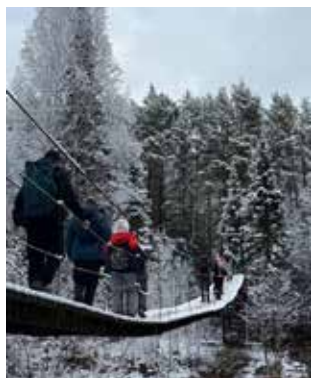
Пройти по скользкому навесному мосту над горной речкой — тест на решительность