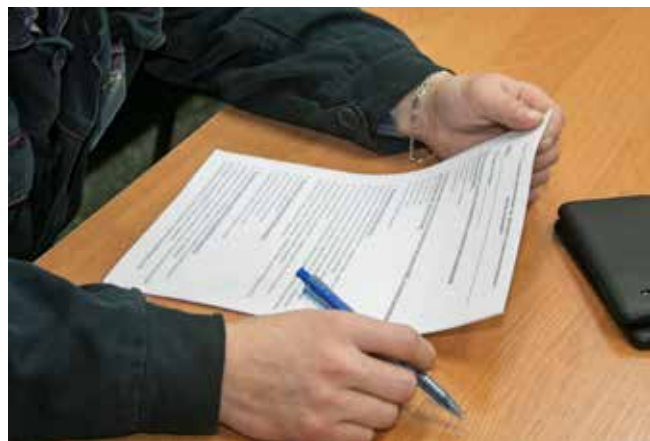
На теоретическом этапе конкурсантам предстояло ответить на 61 вопрос

Тройка призёров отправится в декабре на общекamazовский конкурс «Лучший по профессии» в составе команды литейного завода.