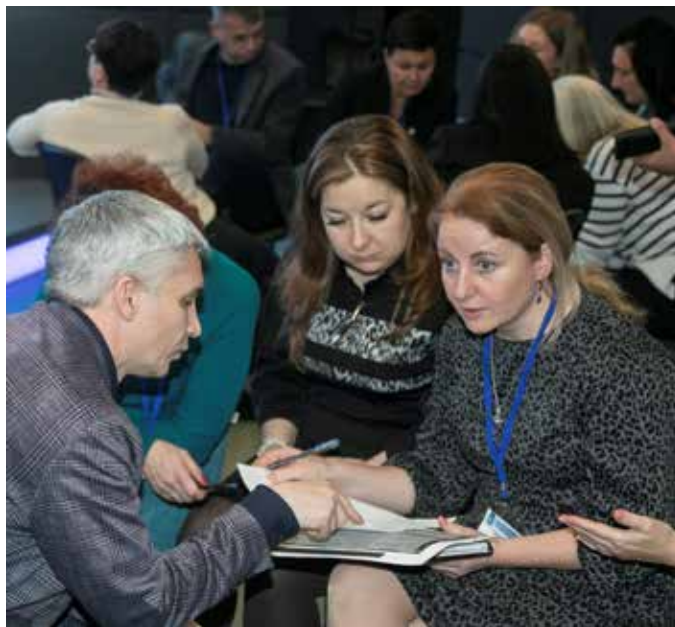
Кейс о конфликте интересов был познавателен для всех участников

Подробнее о конференции — в следующем номере «Вестей КАМАЗа».