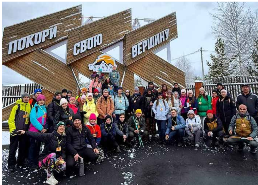
Команда ПРЗ к покорению горных вершин готова

На второй день заводчане отправились в Саткинский