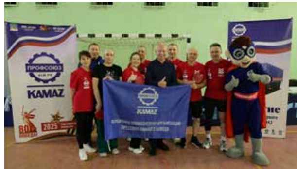
Теннисисты ПРЗ подтвердили статус сильнейших на «КАМАЗе»