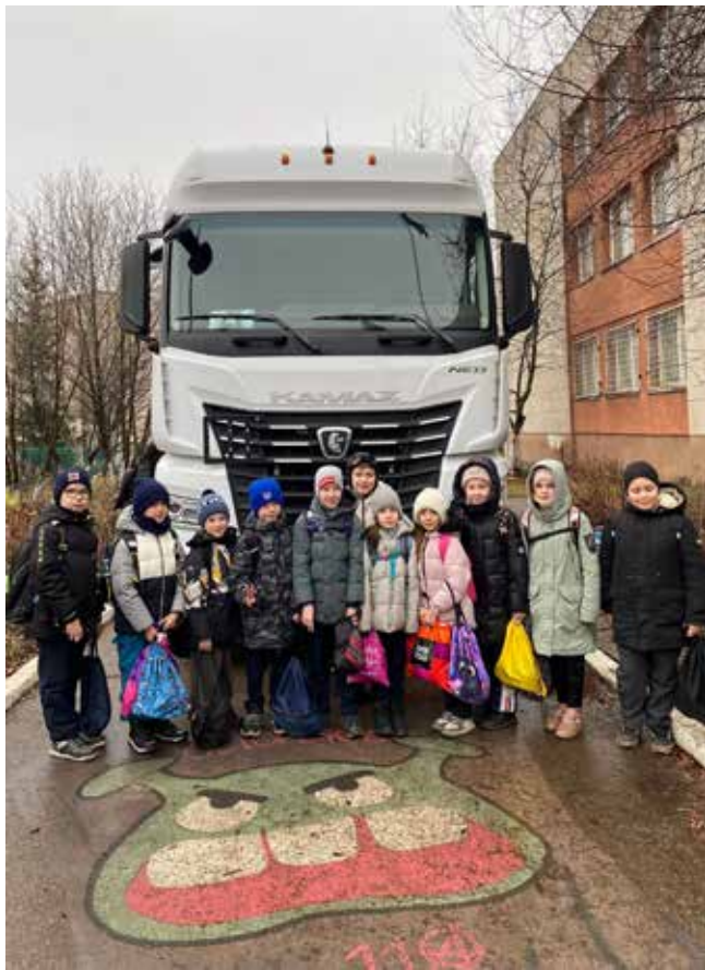
Здорово, когда приезжает КАМАЗ!

День для учеников школы оказался интересным и продуктивным. А на память о нём все желающие могли сделать яркие фотографии в специально оформленной фотозоне и рядом с автомобилем КАМАЗ, который ожидал ребят на площадке перед входом в школу.