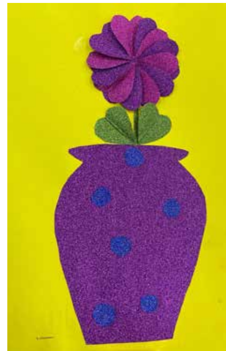
...бархатная, как мамыны ручки