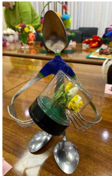
Железный человечек тоже спешит поздравить маму