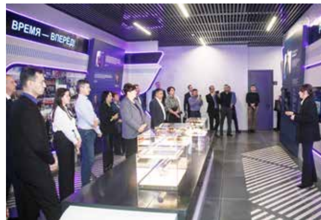
Погружение в историю вдохновляет и открывает новые горизонты

и звёздочки, которые были отмечены сегодня, помогут это сделать.