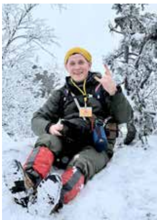
А на Урале в ноябре уже зима!