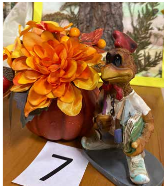
Технологи даже к поделкам подходят творчески