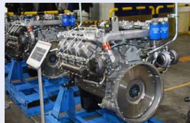
...а это его правнук. Мощность современных моторов достигает 460 л.с.