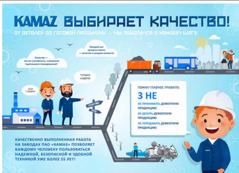
Работа нефазовцев стала лучшей в номинации «Плакат»