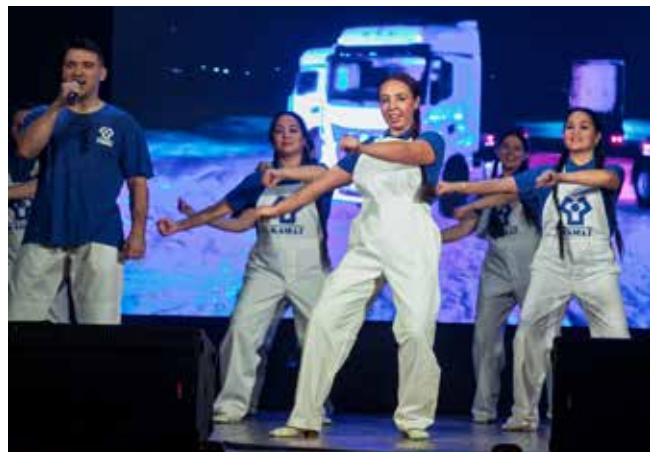
Под зажигательные звуки хита творческого коллектива завода двигателей «КАМАЗ, атас» трудно было усидеть на месте

мест — вот насколько хороши были выступления! Руководителям творческих коллективов во время церемонии награждения также вручили благодарственные письма профсоюзной организации «КАМАЗа» за высокое качество подготовки к фестивалю, творческую инициативу, профессионализм и высокий уровень исполнительского мастерства.