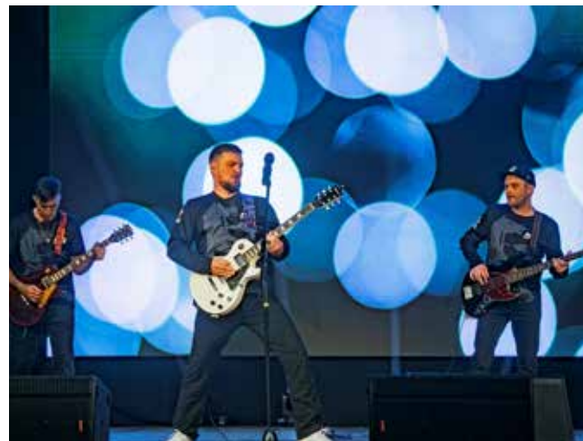
Новой группе «К-5» — дебют на большой сцене!