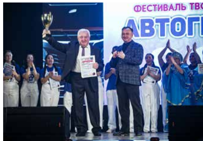
Гран-при фестиваля «Автоград» в этом году получила песня «Я люблю тебя, жизнь». Символично!

Кстати говоря, держали марку в этот вечер не