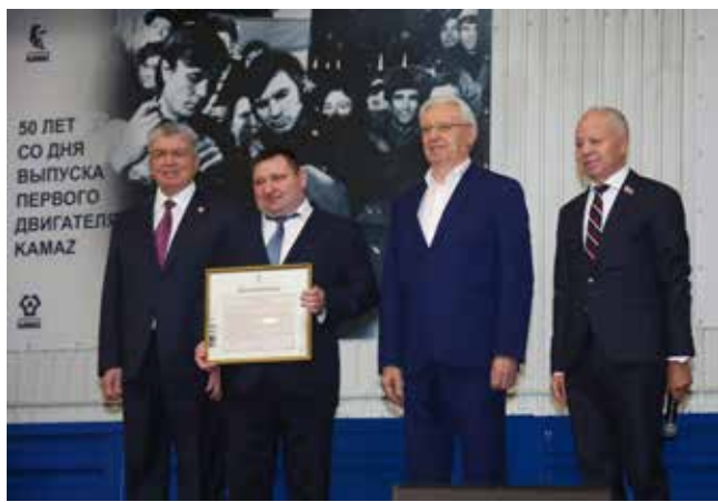
Благодарность от гендиректора «КАМАЗа» — коллективу завода двигателей