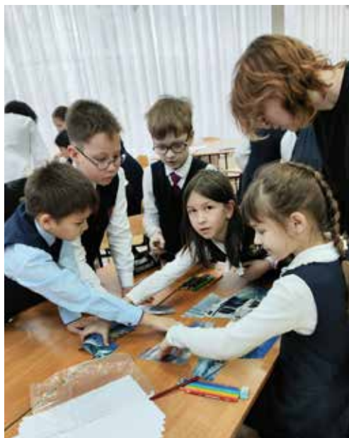
Сначала собираешь пазл, а позже — настоящий автомобиль

Самые активные ребята по итогам конкурсов получили пауэрбанки, футболки, толстовки, яркие брелоки и магнитики. Отведённые Дню «КАМАЗа» пять часов пролетели незаметно. А довольные школьники получили новые знания и ушли домой с подарками.