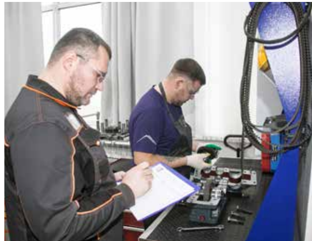
Свои действия участник комментировал эксперту, а тот вёл отчёт

По условиям конкурс состоит из двух этапов — проверки знаний и практической части. Победителем станет слесарь-ремонтник, набравший в сумме максимальное количество баллов. По традиции перед стартом участникам предложили проголосовать за подразделение, чей представитель, по их мнению, имеет наибольшие шансы на успех. Фаворитами дружеского голосования стали слесари-ремонтники автомобильного, литейного и кузнечного заводов.