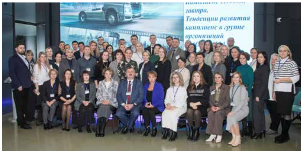
В конференции приняли участие около 80 человек