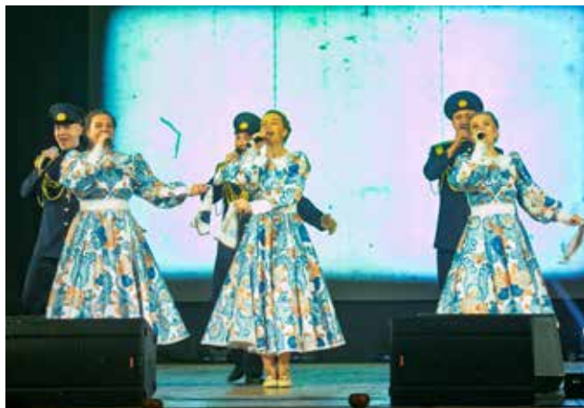
Номера камазовцев от фестиваля «Наше время — Безнен заман» — нашему «Автограду»