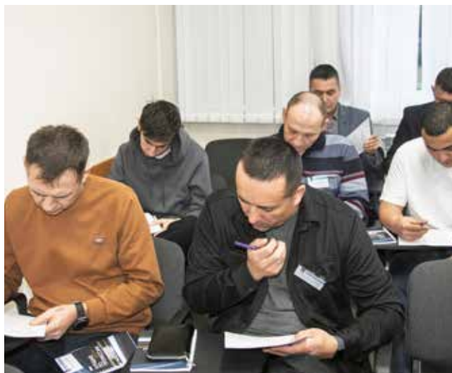
Сначала ремонтники ответили на 60 вопросов...

Итоги будут подведены в конце недели. О том, кто стал победителем, «БК» расскажут в следующем номере.