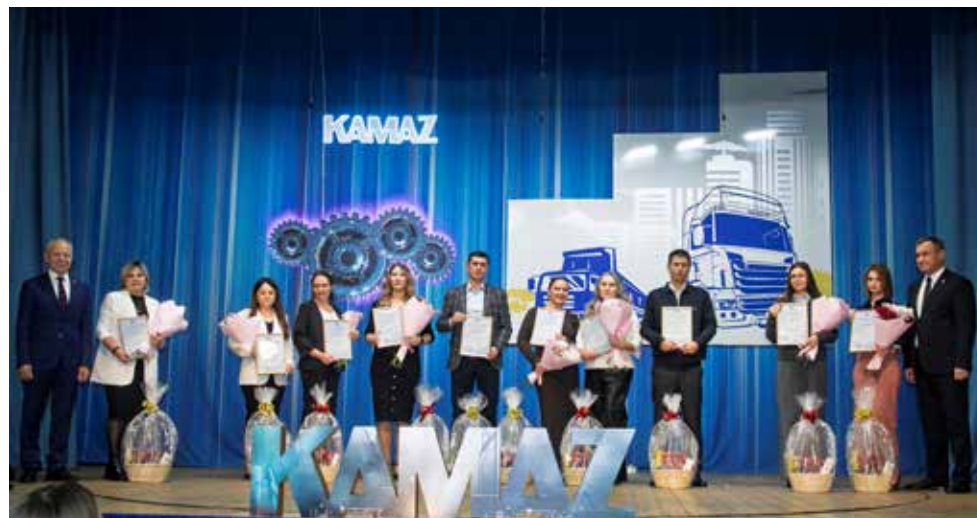
Награды и подарки в день рождения ЛЦ получать особенно приятно