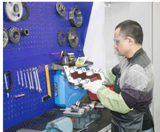
...а затем от них требовалось отремонтировать узел