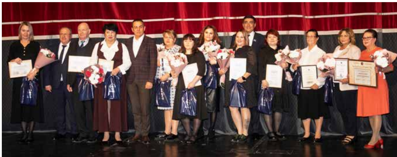
Лучшие сотрудники департамента качества получили награды от руководства