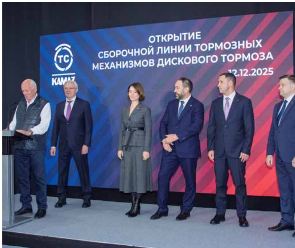
Сергей Чemezов: «Открытие собственного производства современных дисковых тормозов усилит технологическую независимость страны»

12 декабря в Набережных Челнах состоялось заключительное в текущем году заседание Совета директоров «КАМАЗа» под председательством гендиректора Госкорпорации «Ростех» Сергея Чemezова. В заседании также принял участие премьер-министр Татарстана Алексей Песошин.