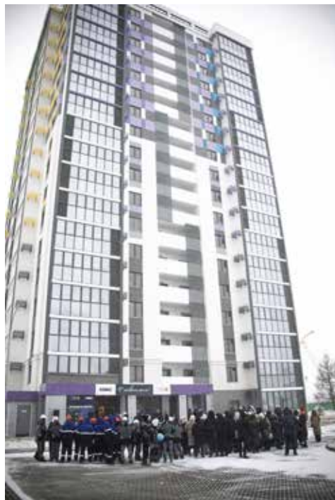
В этой высотке скоро будут жить камазовцы