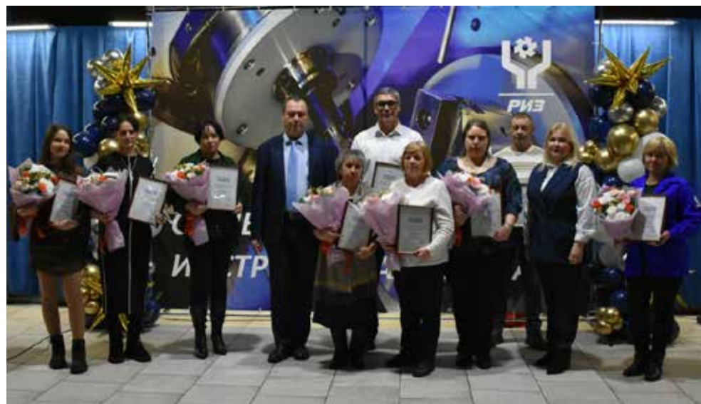
20 ризовцев отмечены почётными грамотами и благодарственными письмами завода

Артисты много шутили на импровизированной сцене, плясали, а также исполнили композиции на русском и татарском языках, причём среди них была и трендовая «Загулял» Газманова с её завирусившимся в интернете танцем. А под конец кон-