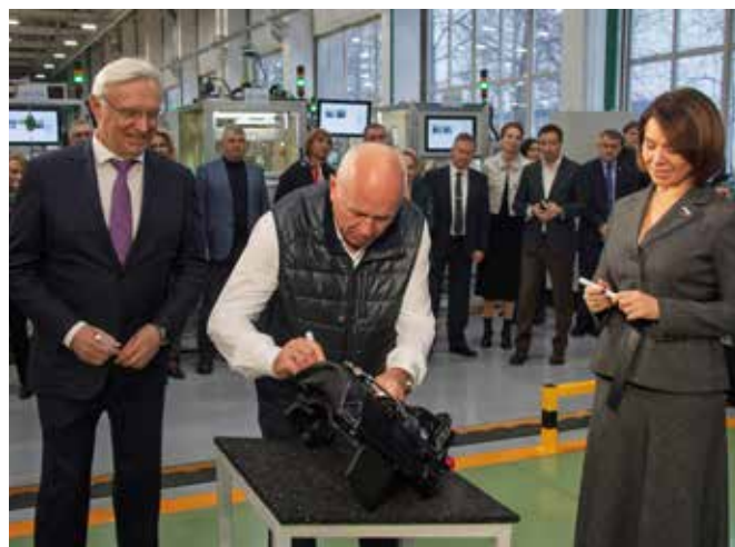
Первый собранный тормозной механизм стал экспонатом, на котором почётные гости оставили свои автографы

После торжественного запуска линии гости оставили автографы на первом собранном тормозном механизме. В память о событии первая деталь будет храниться в музейном зале ООО «КТС».