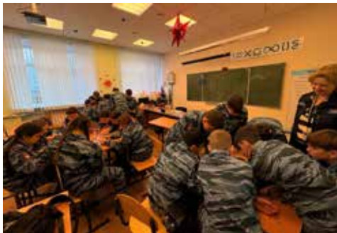
Квиз по-камазовски увлёл всех

В этот день вместе с камазовцами в «Калкан» пришли представители детского технопарка «Кванториум». Вместе с ними ученики изучали мир цифрового дизайна и нанотехнологий, а ещё каждый сделал для себя памятный подарок — значок с аргамаком!