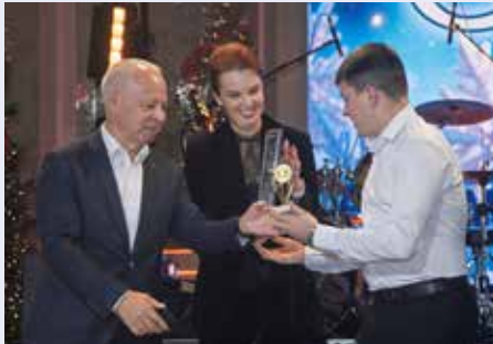
Всё внимание — звёздам «КАМАЗа»