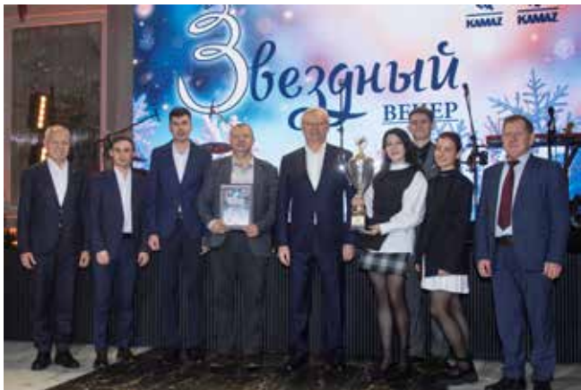
БЗГД — ДР в восьмой раз стал победителем камазовской Спартакиады