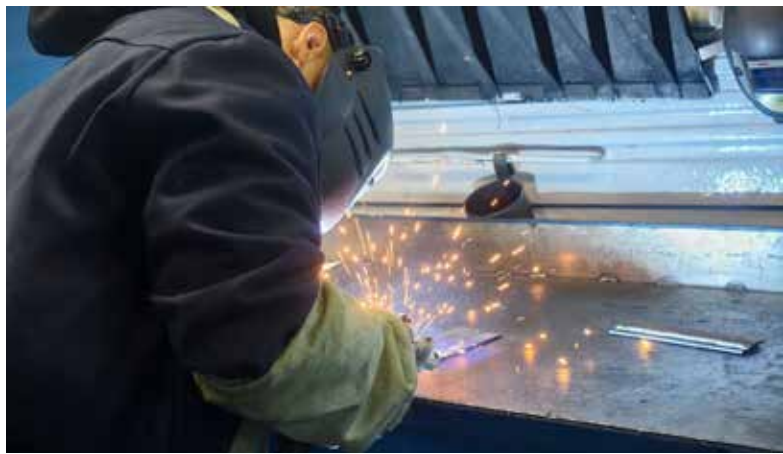
На производстве важно уметь варить качественно, крепко, точно

Новая встреча на ПРЗ состоится в апреле следующего года, когда студенты придут на завод на преддипломную практику. Каждый из ребят может быть уверен: здесь их ждут и научат всем премудростям важного и нужного дела.