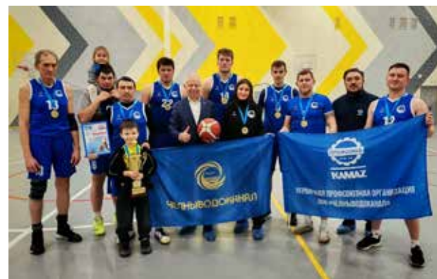
Команда «Челныводоканала» — обладатель кубка «КАМАЗа» по баскетболу