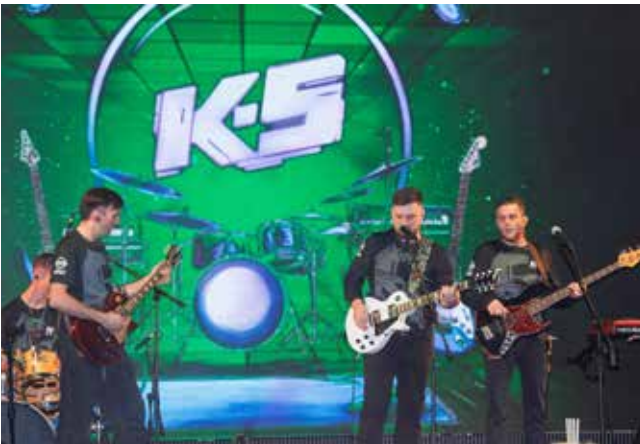
Группа «К5» зажигала на сцене не только каверами, но и песней собственного сочинения

пения камазовцев, покоривших казанскую сцену вокальным номером «Вася-Василёк» и хореографическим представлением «Свет! Камера! Любовь».