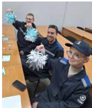
А вот и снежинки на Новый год...

воспоминания о культурной жизни. Их впечатлил красочный, яркий фестиваль «Автоград», зимний Кубок КВН и заводской мастер-класс по изготовлению новогодних снежинок. Было здорово!