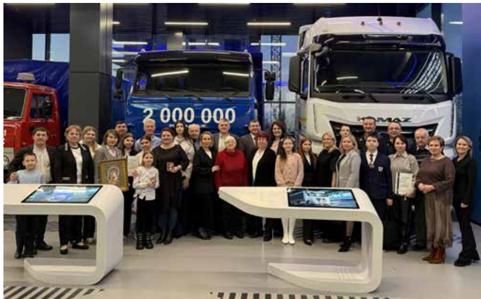
На память о событии пять династий сделали общее фото