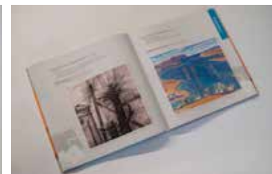
Каталог заинтересует всех почитателей искусства