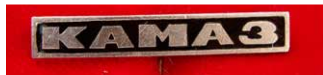
Таким был первый логотип «КАМАЗа»