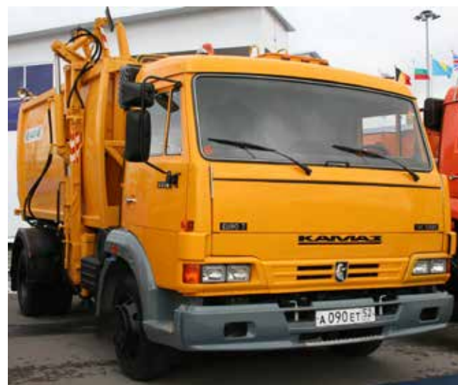
Первая серийная эмблема появилась в 2006 году

Интуиция художников, дизайнеров, конструкторов не повела. Выносливый, быстрый и грациозный конь стал частью культурного кода всех, чья миссия связана с доставкой грузов. Год от года он становится смысловее, сильнее, увереннее. Перед ним открыты все дороги. Лети вперёд, аргмак!