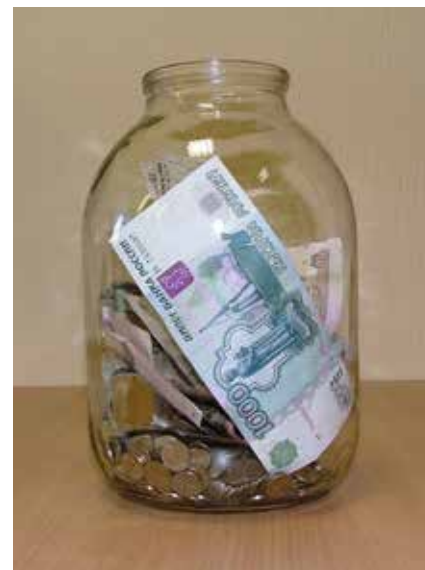
Не упускайте из рук ни деньги в банке, ни банку с деньгами

никами — такие предлагают многие мобильные операторы.