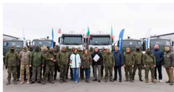
Бойцы с благодарностью приняли помощь от камазовцев