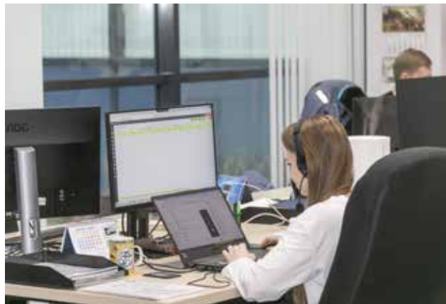
С помощью новых технологий легче внедрить идеи

В прошлом году молодёжные проекты позволили значительно оптимизировать разработку технологических процессов, повысить качество обработки деталей, унифицировать узлы и детали автомобилей. При реализации идей активно используются новые технологии, в том числе моделирование процессов с помощью специальных программ, цифровых двойников оборудования. Такие методы помогают оптимизировать затраты времени и материалов.