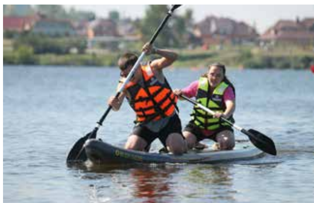
Теперь и на воде камазовцы будут стараться прийти к финишу первыми

а также борются за кубки по футболу, баскетболу и волейболу. Спортивным событием и новинкой 2025 года стало лично-командное первенство по боулингу. Оно объединило около 180 любителей этой увлекательной игры. А в последние годы камазовцы стали состязаться не только на настоящих, но и на виртуальных полях благодаря первенству по киберспорту.