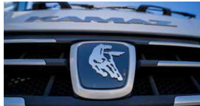
Теперь этот знак широко известен в мире

«КАМАЗа» как фирменное название предприятия и марка большегрузных автомобилей были официально зарегистрированы 31 декабря 1999 года. И они активно использовались в документации автогиганта, буклетах, рекламной продукции.