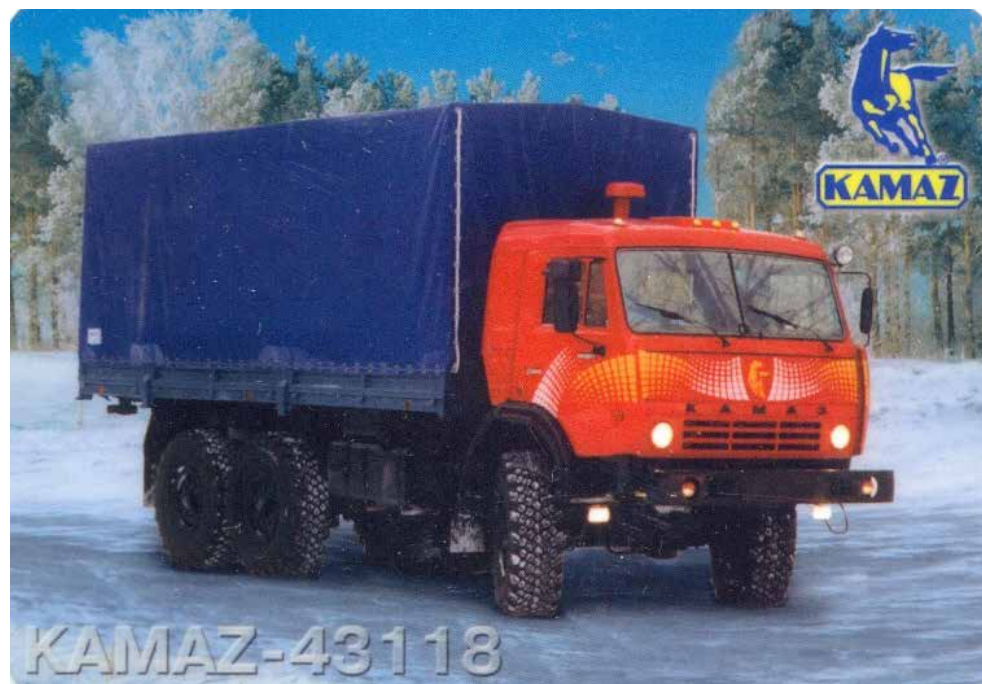
Поначалу кабину КАМАЗа украшал нарисованный аргмак