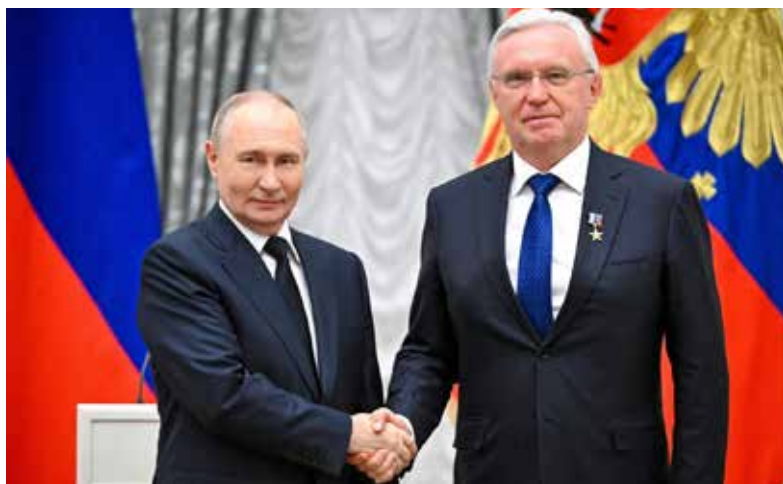
Золотая медаль «Герой Труда Российской Федерации» — знак особого отличия

Комментируя награждение, руководитель «КАМАЗа» отметил, что его награда — это оценка труда всего коллектива компании, делающего всё в это сложное время для того, чтобы страна не испытывала недостатка в надёжной отечественной автотехнике — от грузовиков и спецтехники до пассажирского транспорта.