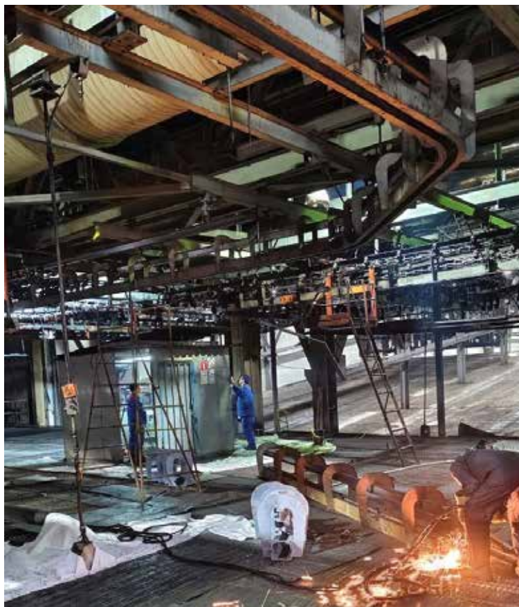
Работы по реконструкции конвейера перемещения рам велись с 29 декабря по 11 января

При удовлетворительной оценке проведённого ремонта и подготовки к нему остаются вопросы по организации работ и обеспечению всем необходимым для восстановления и модернизации оборудования. Они будут решаться в ходе подготовки очередной серии ремонтов, запланированных на майские праздники.