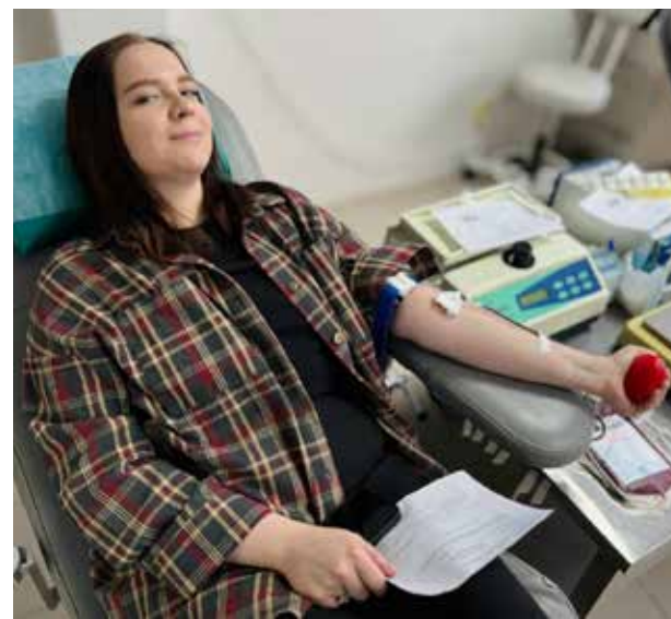
Половина пришедших камазовцев на сдаче крови впервые

Молодёжь «КАМАЗа» больше пяти лет организует подобные акции, и круг их участников неуклонно растёт. За минувший год молодёжь сотрудникам автогиганта удалось сдать 38 литров.