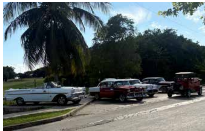
Ретроавтомобили на Кубе встречаются чуть ли не на каждом шагу

— Стоит ли там побывать, пережив два 14-часовых перелёта? Да, это определённо того стоит! Путешествие я запомню на всю жизнь, мне так всё понравилось. Словил, как говорится, кубинский вайб, — уверен Мухаметов.