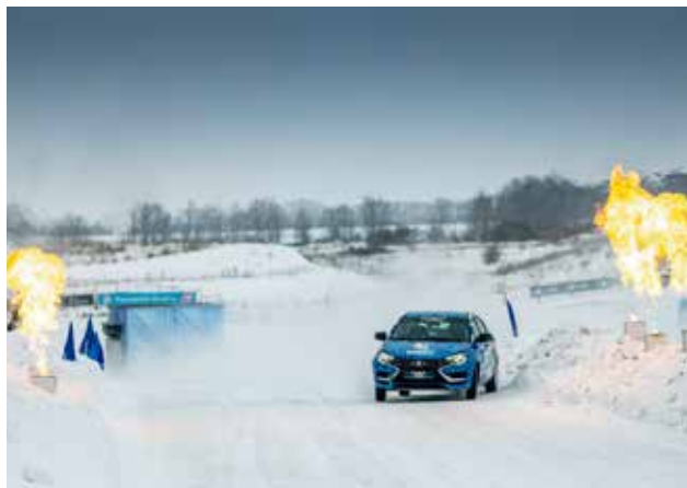
Пилот команды «КАМАЗ-мастер» поборется за главный трофей гонки — «Серебряную ладью»