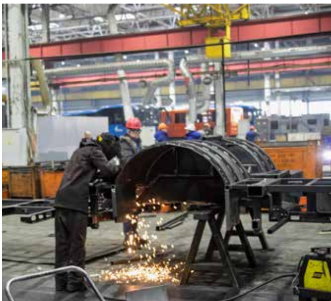
Начальный этап сборки автобуса — сварка рамы шасси

Затем на участке общей сборки-сварки производится внутреннее насыщение каркаса кузова автобуса — устанавливается каркас мотоотсека, подножек, рабочего места водителя, пластиковых арок колёс, приварка профилей. В камере грунтования сваренный кузов автобуса покрывают антикоррозийной грунтовкой, а на участках доработки и облицовки каркаса кузова устанавливают тепло- и шумоизоляцию, твёрдый настил пола из фанеры и обшивают изнутри оцинкованным металлом.