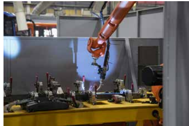
Высокоточное оборудование повышает качество сборки

Подготовила Эльвира Галлямова.