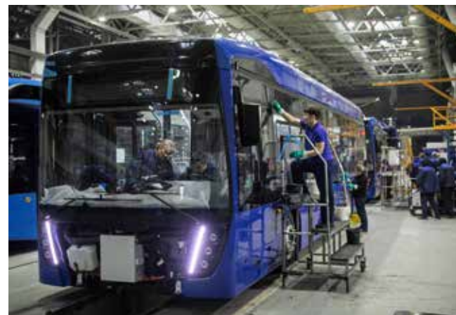
Ещё немного — и этот автобус будет проходить финальные испытания

В конце успешно прошедший испытания и принятый ОТК автобус сдаётся в сбыт ТФК «КАМАЗ» — он готов к передаче заказчику. И уже буквально бьёт колесом, с нетерпением дожидаясь момента, когда сумеет выйти на большую дорогу и открыть двери для пассажиров.