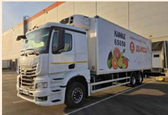
Испытания прошёл, теперь за работу

Модель КАМАЗ-65658 относится к транспортному семейству и предназначена для междугородней перевозки грузов на относительно небольшие расстояния. Её зачастую выбирают ретейлеры для доставки продуктов, и в целом шасси удобно для монтажа разных видов надстроек.