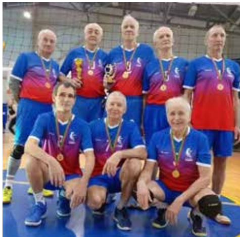
На площадке ветеранам «КАМАЗа» не было равных