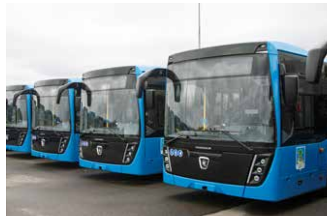
Пассажиры довольны таким удобным транспортом