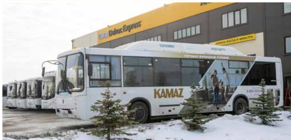
Камазовские вахтовые автобусы узнать несложно