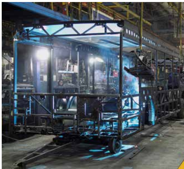
И снова сварка — теперь каркаса кузова