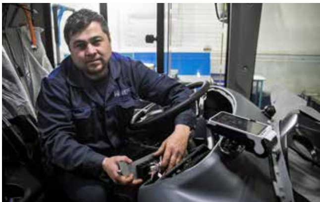
Место водителя требует особого внимания

Ну а финишная прямая — это панель приборов водителя, после установки которой уже крепят лобовое стекло. Оно ставится только после сборки салона, потому что все крупногабаритные элементы заносятся в автобус через этот проём.