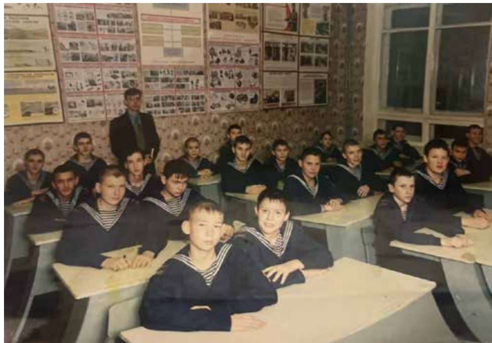
Преподавание в речном лицее стало хорошей школой для молодого учителя

Он любит повторять: «Образование — это не школа, не институт, это развитие самого человека как личности. Тут каникул нет, а успех будет, если сделать правильный выбор». Вот такой он, учитель на производстве.