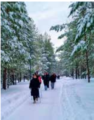
Зима — лучшее время для занятий скандинавской ходьбой

Клуб «Территория женственности» был создан профкомом осенью 2023 года. Его организаторы приглашают на свои заседания известных диетологов, косметологов, стилистов и всегда открыты к обсуждению новых идей.