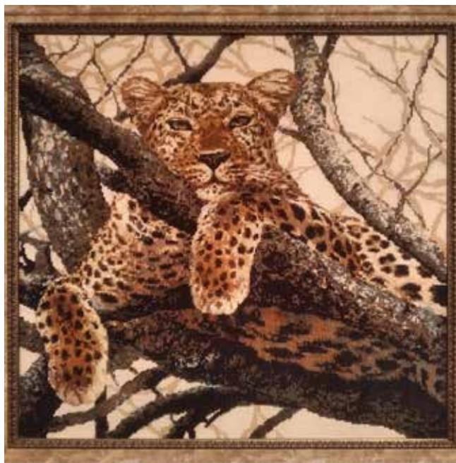
Вот такой грациозный хищник лениво присматривает за домочадцами Натальи каждый день