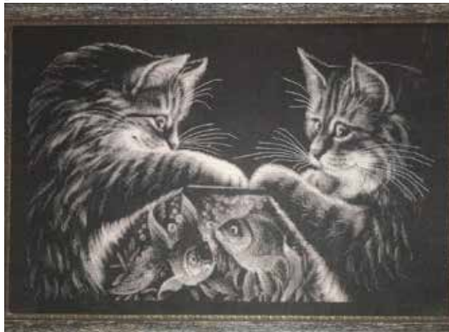
Издали и от настоящего снимка не отличишь — вот что значит фотореализм