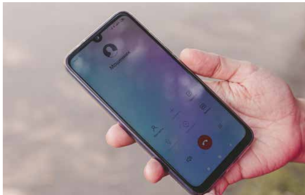
Не разговаривайте с незнакомцами!

Как же не стать очередной жертвой в длинном списке злоумышленников?