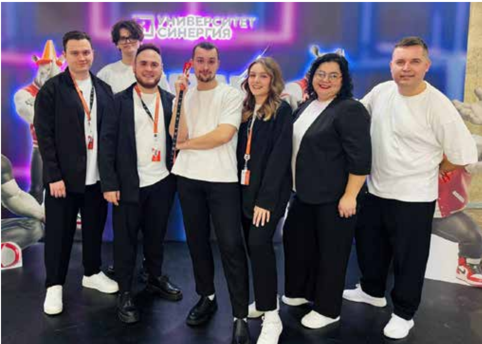
«Нелогичные» получили право участвовать в официальных лигах КВН

— Мне очень понравились выступления «Агрофака» из Ставропольского края и челнинской команды «Инда». Челнинцы вообще вышли в Высшую лигу КВН по итогам сочинского фестиваля, — продолжает