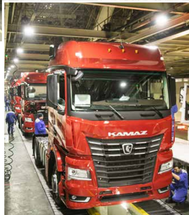
Важнейшая задача на 2026 год — качество выпускаемых грузовиков

В 2026 году необходимо внедрить сквозное плани-