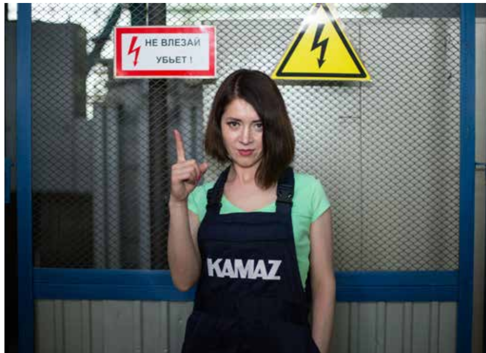
Строго соблюдайте инструкции, и несчастных случаев будет значительно меньше

Постепенно среди травмированных увеличивается число женщин: в 2024 году было восемь случаев, в 2025-м уже десять. Мужчины стали осматривать внимательнее, но они, как правило, получают более тяжёлые травмы.