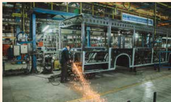
После обучения нефазовцам будет где применить полученные знания

По итогу нефазовцы высоко оценили подобный формат стажировки. Ведь такие курсы создают фундамент для устойчивого развития предприятия, позволяют найти пути решения вопросов снижения себестоимости, повышения качества и гибкости производства.