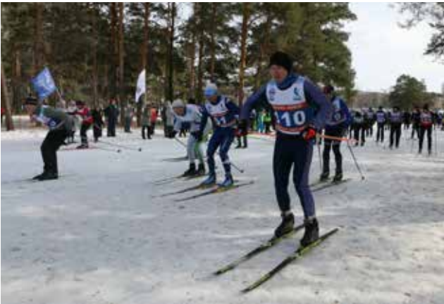
Лыжное первенство традиционно открывает спортивный сезон «КАМАЗа»

«Прибрежный» пройдёт командная эстафета по лыжным гонкам среди членов профсоюза «КАМАЗа». Спустя три дня в той же локации состоится открытое первенство автогиганта по лыжным гонкам. Соревнования будут проводиться среди мужчин и женщин в четырёх возрастных группах: 18-29 лет, 30-39 лет, 40-49 лет, 50 лет и старше. Дистанция для женщин составит 2 км, мужчины пробегут на километр больше. Организаторы обещают устроить весёлый семейный