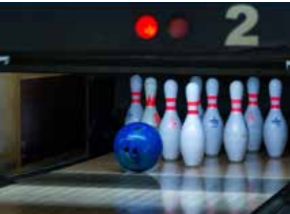
Если шар катится ровно по центру дорожки, значит, будет страйк

К слову, ежегодно камазовские команды не только активно принимают участие в этом турнире, но и занимают призовые места. Так, в 2024 году победу праздновал коллектив завода двигателей, вторым стал центр экономики. В 2025-м «золото» соревнований досталось логистическому центру