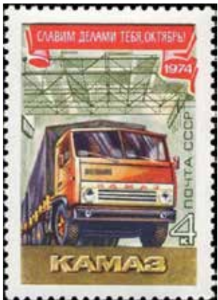
КАМАЗ впервые стал героем почтового знака в 1974 году

Сама марка вошла в серию «57-я годовщина Великой Октябрьской Социалистической революции» и была посвящена ударной комсомольской стройке в Набережных Челнах.