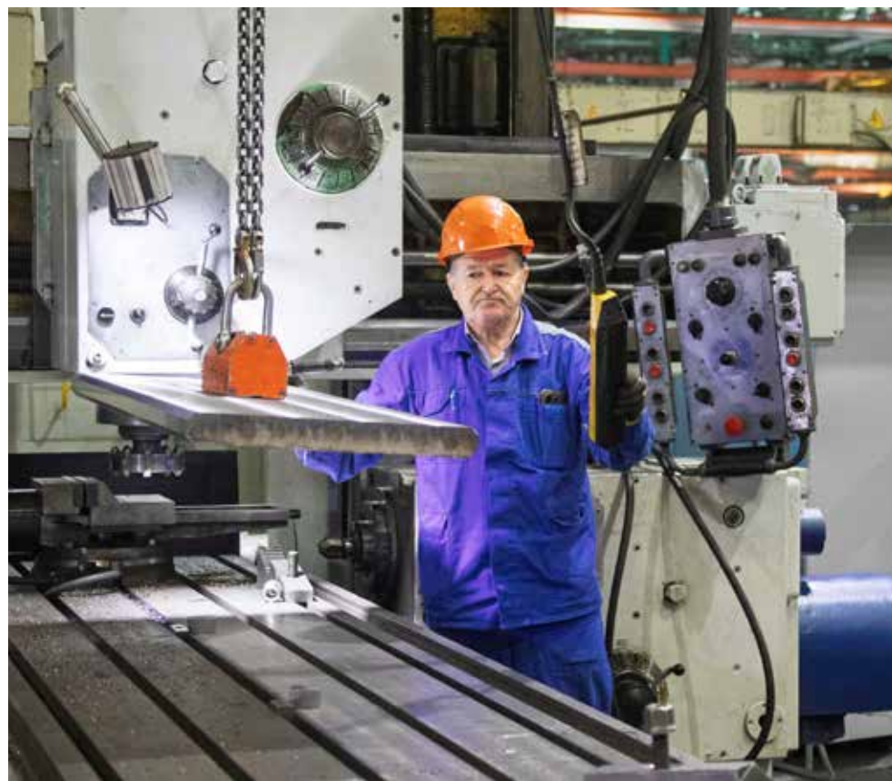
С магнитным захватом стало легче и удобнее поднимать и устанавливать в станок заготовки

— Было очень неудобно стропами доставать тяжёлую габаритную заготовку из тары. Болванку приподнимали с помощью лома и подкладок, чтобы просверлить отверстия под рым-болты. Сами железные стропы сильно изогнутые, приходилось выпрямлять их, — рассказывает фрезеровщик и сравнивает: — А здесь положил на заготовку магнитный захват, как тебе надо — сбоку, с торца, с краю. Далее прикрепил к цепям магнит, в любой момент можно поднять наверх заготовку и перенести на станок. Да и сама подготов-