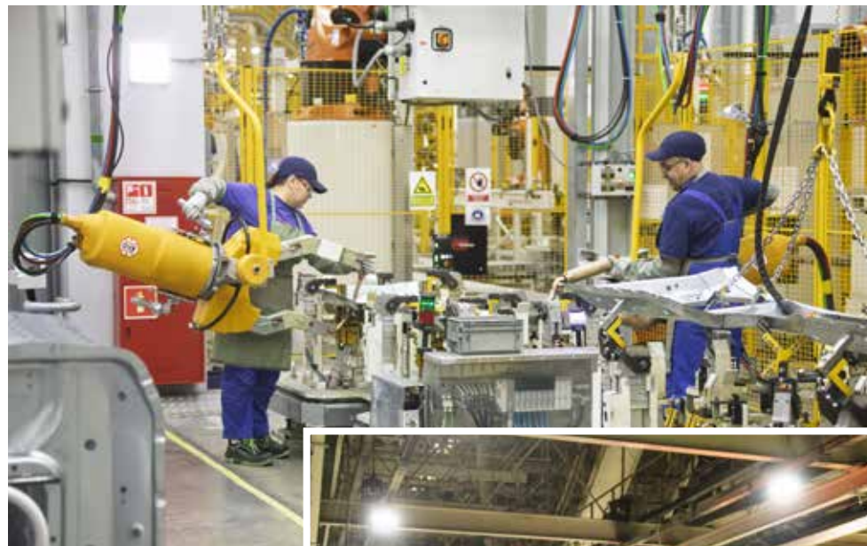
Инструменту будет уделено особое внимание

По направлению «Качество» стоит цель снизить IPHV3mis (количество рекламационных дефектов на 100 единиц автотехники по итогам трёх месяцев эксплуатации) для автомобилей поколения К3 до 17. Для закупок этот показатель должен быть не более 4,128; для производства отливок и производства штампованных поковок — не более 0,06. Требуется снизить уровень для прессового заво-