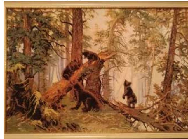
«Утро в сосновом лесу» может быть и таким