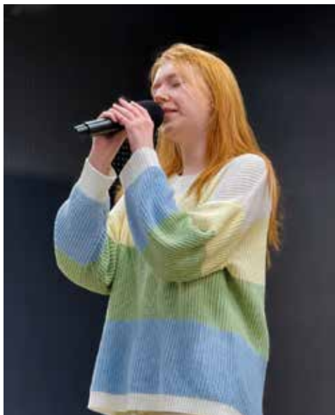
Участники кастинга старались продемонстрировать всю красоту своего голоса

Участники выходили на сцену и исполняли только собственные или известные песни («Город, которого нет» Корнелюка, «Выйду ночью в поле с конём» группы