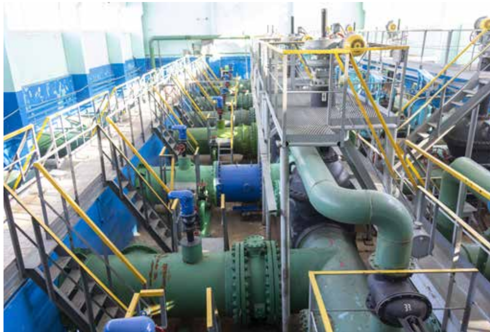
Насосная станция «Челныводоканала» исправно работает уже полвека

— Сегодня у нас особенный день — 30-летие «Челныводоканала» в ста-