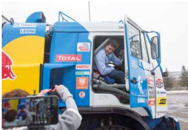
После поездки на болиде «КАМАЗ-мастер» эмоции зашкаливают