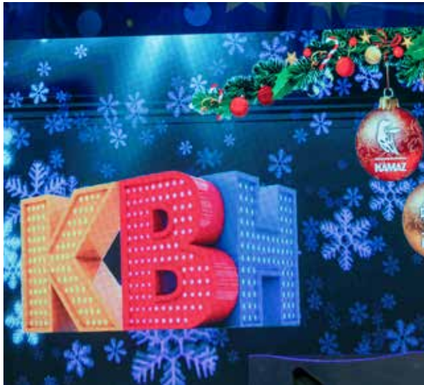
27 февраля стартует 17-й сезон камазовского фестиваля КВН

Первая игра сезона пройдёт в ДК «КАМАЗа» 27 февраля в 18.00. Командам предстоит подготовить выступление продолжительностью до шести минут. Оценивать их будет жюри, в составе которого окажутся и именитые кавээнщики.