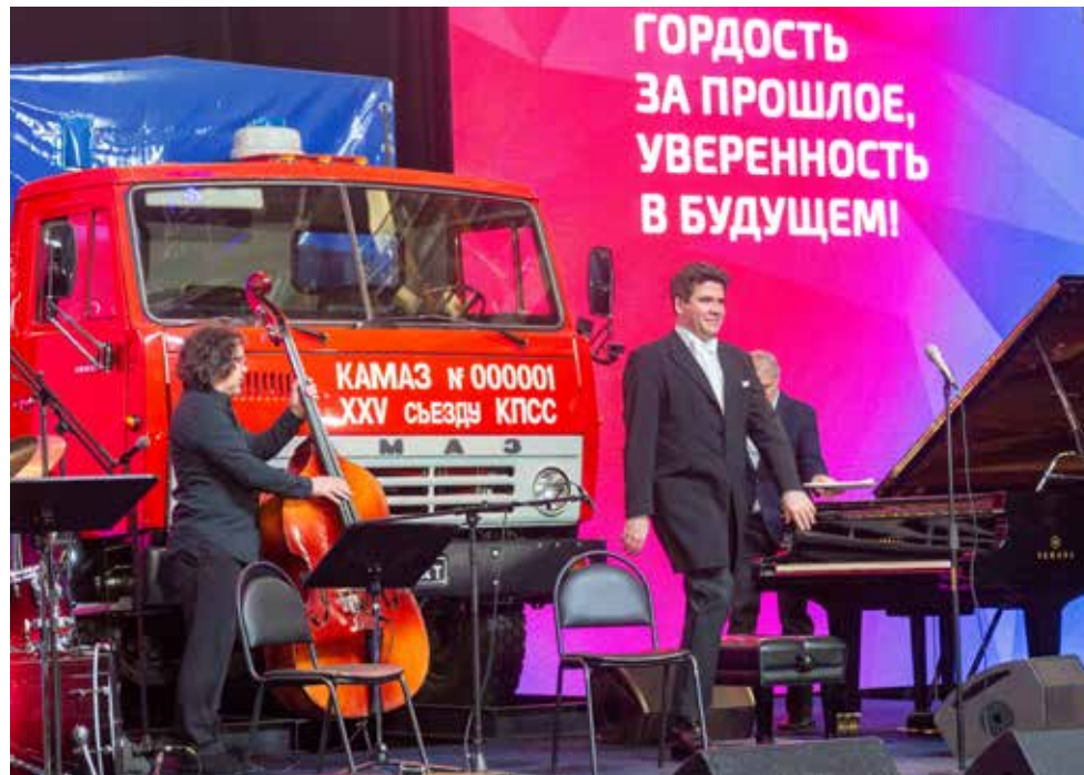
Выступление на сцене, где стоял первый «КАМАЗ», стало для маэстро особенно памятным