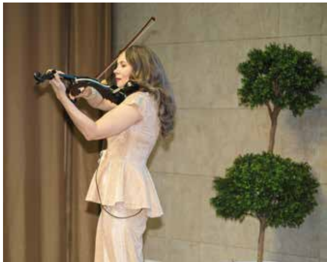
Музыкальные номера — подарок юбилярам