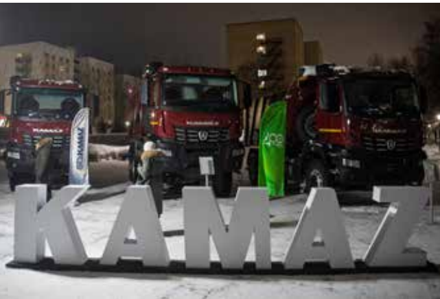
Автомобили поколения K5 — гордость автогиганта

История Набережных Челнов, обсуждали строители, возводившие заводские корпуса, и участники СВО.