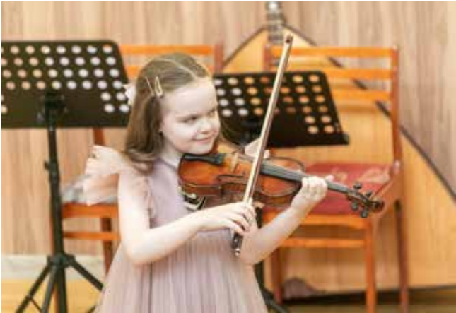
Эта малышка пробовала свои силы в прошлом году. 2026-й несёт новые возможности

кестра им. Е.Ф. Светланова, Академии акварели и изящных искусств Сергея Андрияки. Перенять опыт и получить оценку именитых творческих деятелей — большая возможность для юных талантов. Свои способности они продемонстрируют в