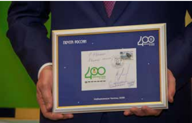
Особая челнинская марка погашена

Тем временем в зале, где в декабре 1976 года был подписан акт о приёмке первой очереди «КАМАЗа», состоялось другое историческое событие — церемония гашения специальной почтовой марки к 400-летию Набережных Челнов.