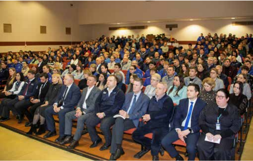
Внушительные итоги работы заставили заводчан задуматься о перспективах развития города и республики

Наиболее распространённые способы обмана — перевод денег на безопасный счёт, сбор средств по инициативе «руководителя», помощь близкому человеку, оказавшемуся в бедственном положении, обращение якобы от лица сотрудников Пенсионного фонда.