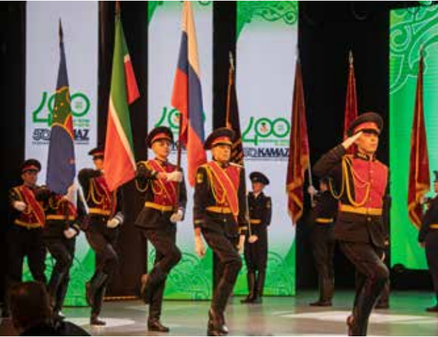
Флаги — на сцену

Видеопоздравление прислала и депутат Госдумы РФ Альфия Когогина: «Из небольшого села Челны выросли в крупнейший промышленный центр, где крепнет индустриальная мощь России. История продолжается — город развивается, растёт, а «КАМАЗ» — это наш вклад в победу, в мирное строительство, в будущее нашей любимой России».