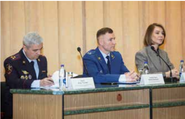
Представителям правоохранительных органов и депутату Госдумы РФ Альфии Когогине важно донести важную информацию и получить обратную связь

— Только за прошедший год было рассмотрено 9000 обращений граждан, — заявил прокурор Набережных Челнов Фанис Шайхаттаров. — Большинство из них от многодетных семей, требующих исполнения федерального закона. Внесено 1425 представлений об устранении нарушений закона, 1282 должностных лица привлечено к дисциплинарной ответственности, 264 исковых заявления, подготовленные в интересах граждан, государства и муниципального образования, направлены в суд.