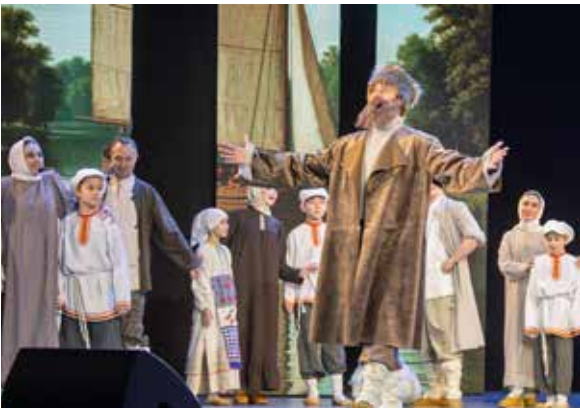
От XVII века — до наших дней

Концертная программа была представлена в новом формате — виртуальную экскурсию по прошлому и настоящему города дополнила театральная постановка. Вот на сцену выплывает чёлн со стоящим на корме Фёдором Поповым и первыми поселенцами, обосновавшимися на левом берегу Камы Чалнинский починок. А в начале XX века на пристани ведут торг купцы, скупающие здесь зерно. Артистам театральной труппы «Саяр», в составе которой был и Габдулла Тукай, плеск Камы навеял мечты о создании на её берегах оазиса творчества и вдохновения. Всё сбылось.