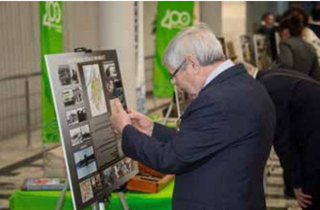
Каждый пришедший нашёл в истории Челнов свою страницу