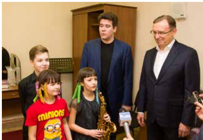
Быть может, скоро юные таланты из Набережных Челнов составят славу российской исполнительской школы

15 февраля в Салехарде завершится мой второй Международный конкурс молодых музыкантов «Симфония Ямала», и мы с нашей командой сразу поедём вместе в Набережные Челны, где будем импровизировать и дарить наше настроение и эмоции потрясающему коллективу «КАМАЗа».