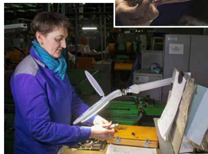
Лупы помогают улучшить качество инструмента и снизить напряжение глаз