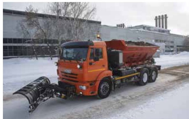
Комбинированная дорожная машина (КДМ) с отвалом и пескоразбрасывателем — незаменимый помощник в уборке территорий

Порой мы даже не задумываемся о том, какой колоссальный труд стоит за очищенными от снега дорогами. Зачастую важность деятельности этих специалистов осознаётся только тогда, когда что-то идёт не так. Работа дорожников — это вклад в комфортную и безопасную трудовую жизнь каждого камазовца. И, возможно, стоит чаще говорить простое спасибо этим незаметным героям нашей повседневности.