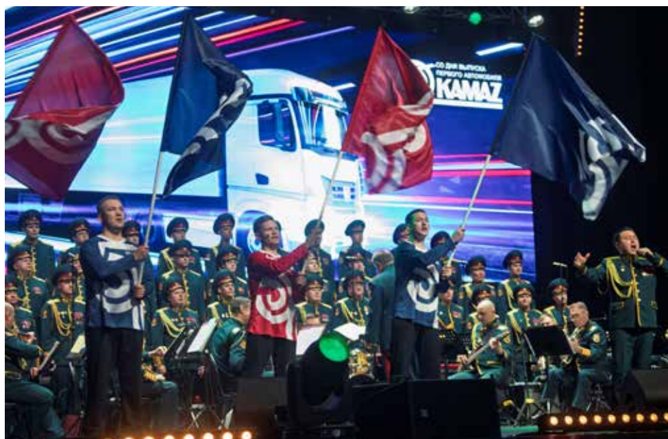
Неофициальный гимн республики вместе с прославленным коллективом исполнили молодые камазовцы

— Мы благодарим вас за труд, за подвиг и за то, что вы вырастили детей и внуков — сегодняшнее поколение рабочих и мастеров, конструкторов и инженеров, которые пошли дальше вас. Сейчас «КАМАЗ» выпускает лучшие в мире магистральные тягачи, электробусы, беспилотники, конкурирующие с представителями мирового автопрома. На ближайшие 50 лет у нас грандиозные планы, и я верю, что они нам по плечу!