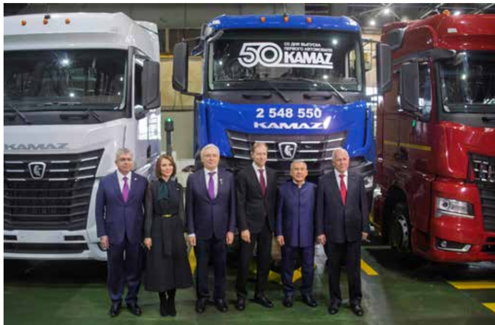
Почётных гостей праздника восхитила сила и мощь нового поколения большегрузов