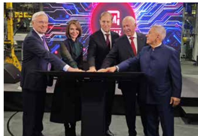
Запуск завода состоялся