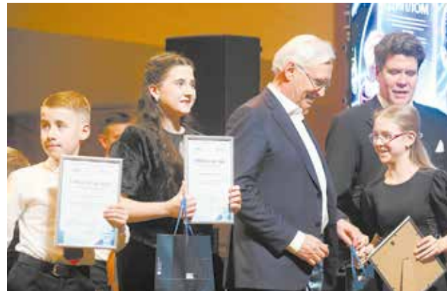
Стать стипендиатом фонда «Новые имена» — это как получить олимпийскую медаль в мире искусства

Концерт по праву можно назвать мощным, незаурядным и впечатляющим — под стать легендарному «КАМАЗу», который, как и 50 лет назад, так и сегодня, звучит успехами на всю Россию.