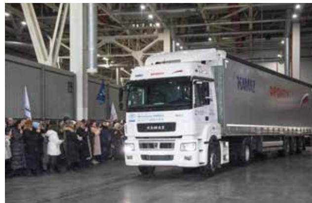
Камазовцы провожали машины аплодисментами