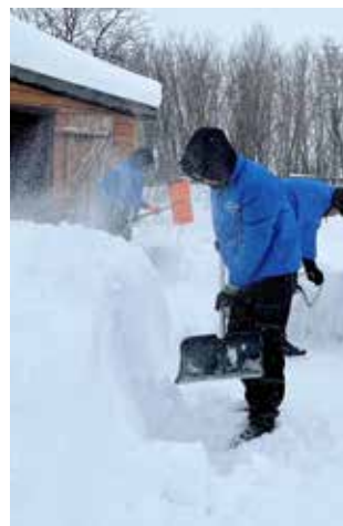
Молодым помощникам на селе очень рады

Для младших и средних школьников студенты организовали мастер-классы по плетению из пряжи, созданию объёмных открыток, а также провели развлекательный квиз и турнир по волейболу. Пожилым жителям села ребята оказали шефскую помощь — почистили снег на территориях, нарубили дров и помогли