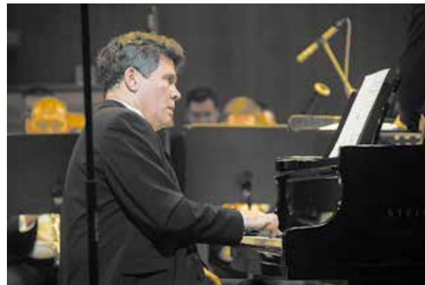
Денис Мацуев: «То, что вы услышите сегодня, прозвучит только раз»