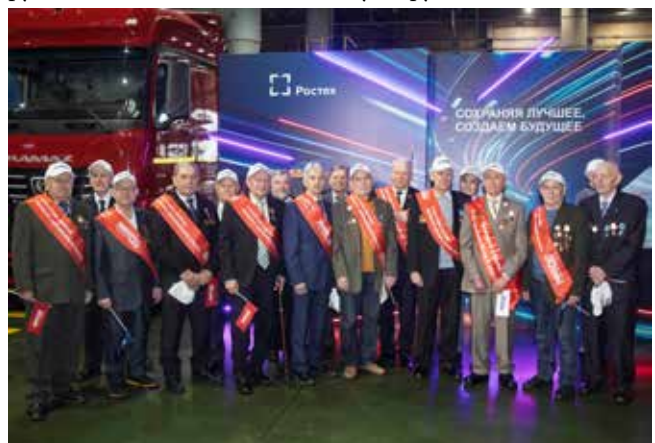
Ветераны, участвовавшие в сборке первого КАМАЗа

— Следуя курсу на развитие, компания совершенствует свой модельный ряд, интегрирует в свои флагманские продукты технологии беспилотного вождения и умные системы управления, — отметил Денис Мантуров. — Будучи одним из символов отечественной промышленности, «КАМАЗ» и сегодня в числе самых узнаваемых российских брендов за рубежом. Его автомобили эксплуатируются более чем в 80