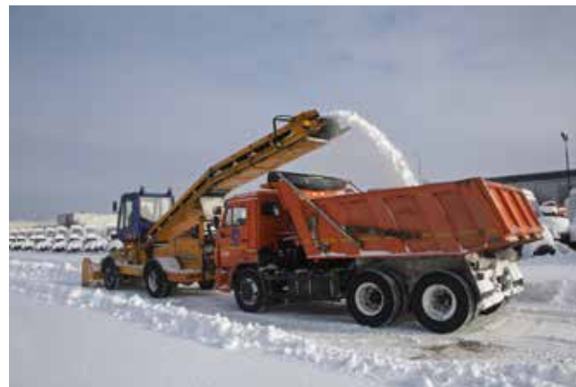
На складе готовой продукции ТФК «КАМАЗ» работает спецтехника

Заблаговременно подразделение начинает подготовку к борьбе с гололёдом. Во второй половине лета специалисты готовят тысячу тонн пескосоляной смеси, которая в зимний период ежедневно используется для ликвидации наледи. Этот реагент разъедает накат и облегчает