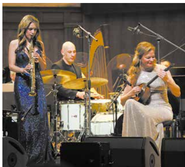
Музыканты показали виртуозную игру на инструментах