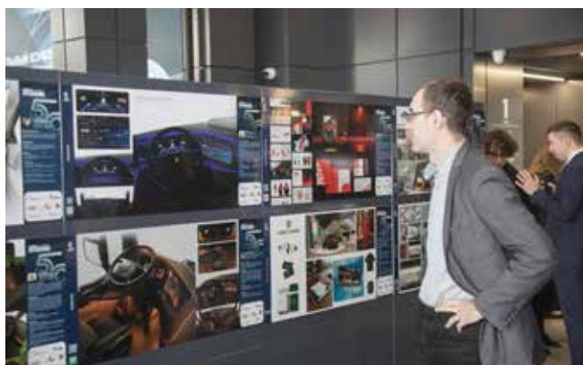
Лучшие работы оказались на стенде в выставочной зоне Визит-центра

Событие началось с презентации лучших работ. Концепты разместились на стендах во временной экспозиционной зоне. Здесь можно было найти ин-