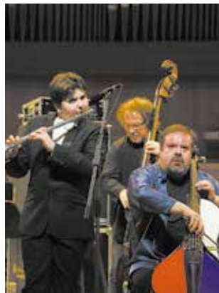
Их унесло в экстазе симфоджаза...

Чика Кория. Изюминкой номера стал интерактив со зрителем: дирижёр и оркестр задали ритм аплодисментами, а зал их подержал.