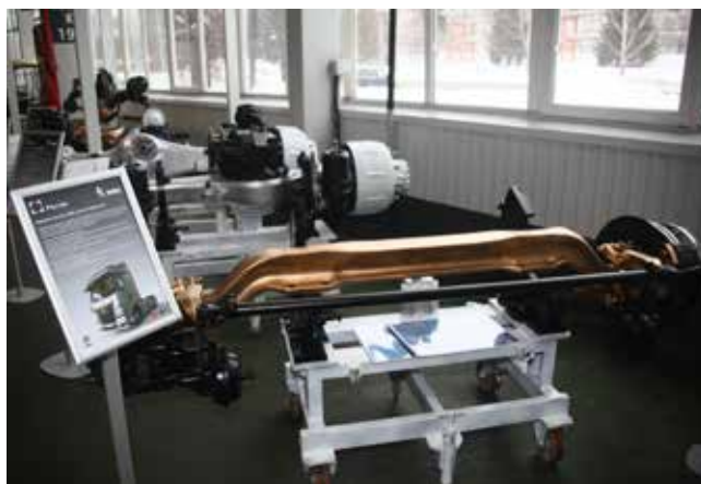
У грузовиков поколения К5 появятся собственные мосты

Завод под руководством Максима Минеева будет выпускать мосты для автомобилей поколений К3 и К5.