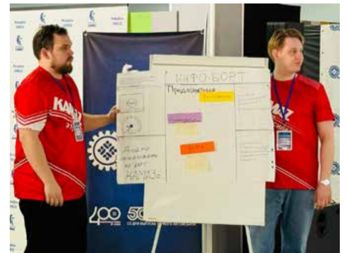
К защите своих проектов все участники форума отнеслись ответственно