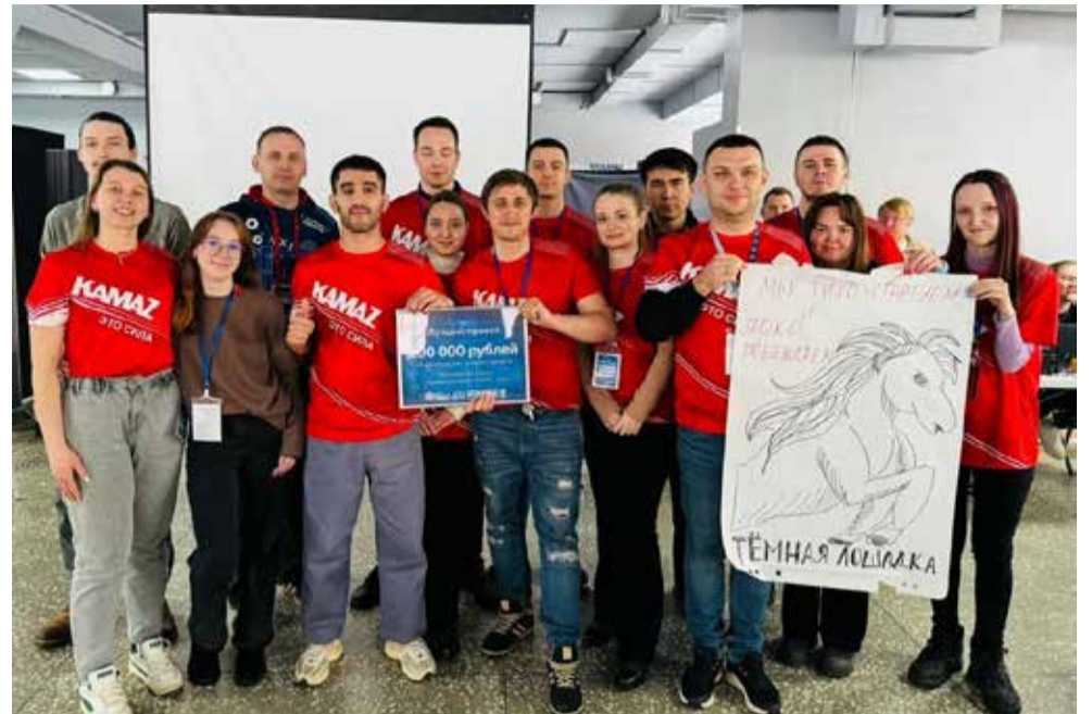
Команда «Тёмная лошадка» — победитель конкурса проектов