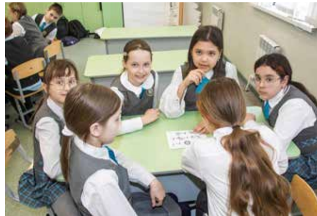
Над ребусами пришлось поломать голову, но результат того стоил

готовить сопроводительный текст, подобрать музыку и смонтировать по итогу короткий фильм. В каждом клипе школьники рассказывали о том, чем занимались в течение насыщенного событиями дня, и делились своими впечатлениями и эмоциями. Победители конкурса получили свои заслуженные