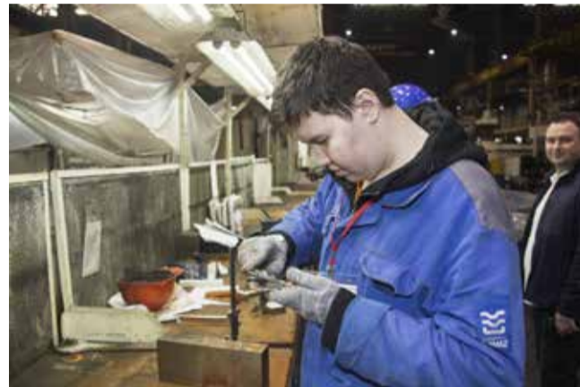
Сделал шаблон — измерь!

чтобы увидеть результат окраски: его можно оценить только через час сушки.