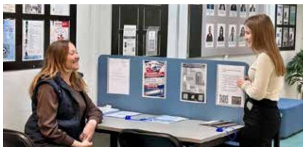
Задача HR-специалиста — раскрыть человека и предложить ему подходящую работу

Удобный диван и мягкие пуфы создают уют, что помогает посетителям и сотрудникам настроиться на обстоятельный разговор, результаты которого и определяют наиболее оптимальный вариант трудоустройства.