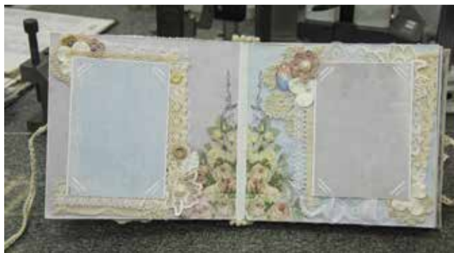
Роскошный альбом для лучших фото