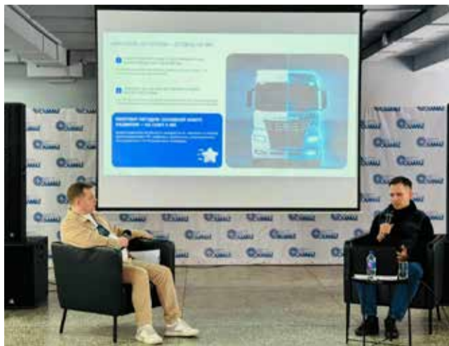
Гости рассказали о современных тенденциях в автопроме