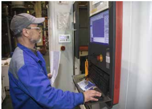
Для наладчика выполнение задания начинается с выбора режима резания

Ремонт не терпит суеты, но ведь вы на конкурсе, а на кону — победа, — напутствовал коллег Фанус