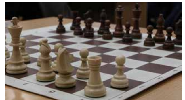
За шахматной доской камазовцы продемонстрируют всё своё мастерство

Каждый игровой день стартует с регистрации участников в 17.30, а первый ход белых намечен на 18.00. По итогу определится тройка сильнейших команд «КАМАЗа».