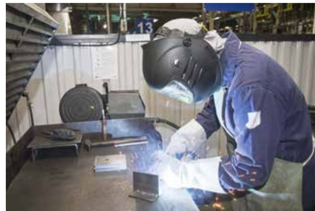
При сварке важна и точность, и качество шва

Здесь, на конкурсе, многие маляры впервые по стандартной операционной карте готовили к работе эмаль. Это для них непростая задача, ведь на многие рабочие места она подаётся из краскоприготовительного отделения. Терпение потребовалось и для того,