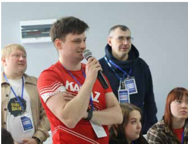
Участники форума не стеснялись задавать самые каверзные вопросы спикерам

Два дня протекли незаметно, но оставили у участников форума яркие положительные эмоции. А главное — все обрели новые знания и друзей.