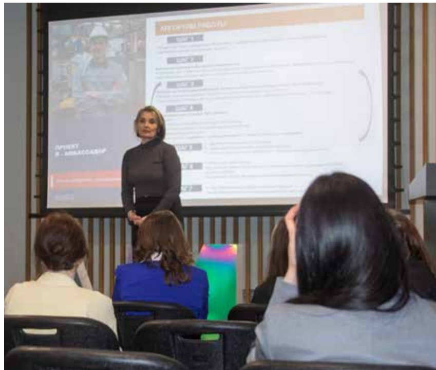
О вкладе в развитие положительного имиджа компании амбассадорам «КАМАЗа» рассказали на первой встрече

проекта «Я — амбассадор» пройдут обучение. Обретение новых компетенций и получение уникального опыта создания медиаконтента под руководством профессиональных наставников — несомненные плюсы для камазовцев. Ещё один бонус — узнаваемость: стать лицом, и за которым будет следить в соцсетях весь коллектив автогиганта, очень приятно и ответственно.