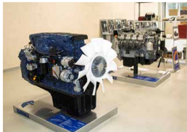
Эти моторы будут в топе самых востребованных экспонатов в фонде Музея

Вместе с автоцентром на эту землю пришли тягачи, самосвалы, бортовая и коммунальная техника, с помощью которой стало проще обустроить мирную жизнь на донецкой земле, разбить цветники и скверы.