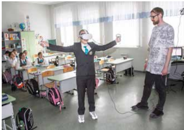
В виртуальную реальность? Чур я первый!

Для 4-5-х классов организаторы подготовили активную игру «Авторалли», в которой ребята смогли примерить на себя камазов-