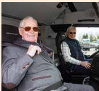
Главный дальнбойщик России снова в кабине КАМАЗа!