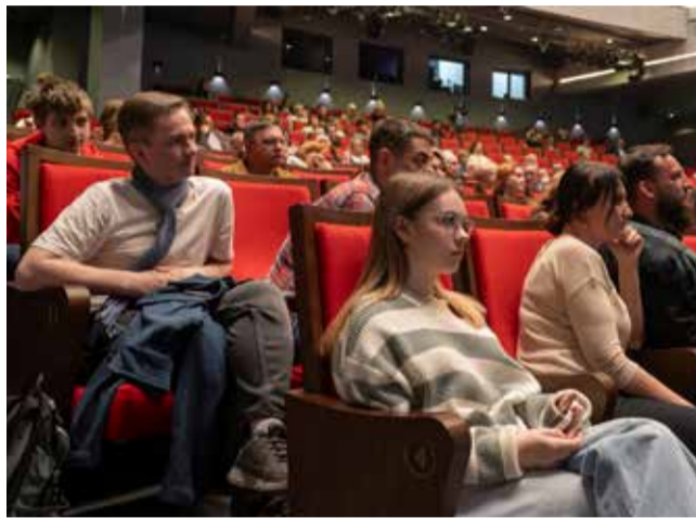
Подкованность публики в вопросах истории поразила даже лекторов

Но программа была расписано чётко. Вторую часть