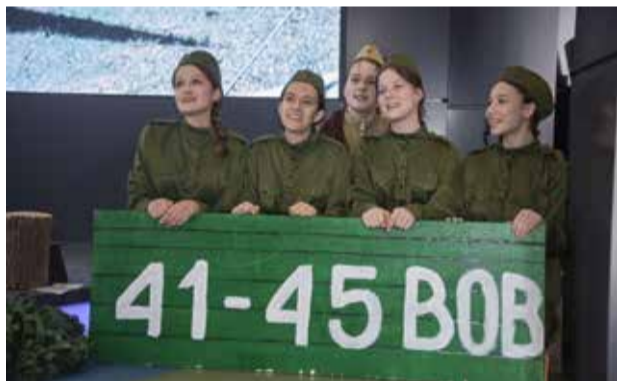
Таковыми девушки уезжали на своё главное в жизни задание

Зрители горячо благодарили юных артистов. Знаменитая повесть Васильева нашла ещё одно достойное воплощение в лице школьников. Можно быть уверенными: с такими ребятами память о героях прошлого забыта не будет.