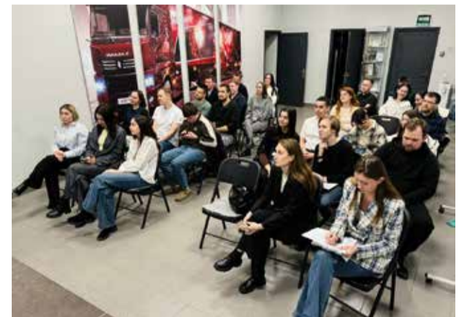
Участники кастинга внимательно слушали выступающих и сами старались презентовать себя достойно

стрельбе из пневматического оружия и спортивных состязаниях. На днях мы определимся с окончательным списком нашей делегации, — рассказывает Ирина. — После майских праздников, набравшись сил и хорошо отдохнув, мы планируем приступить к спортивным тренировкам и подготовке номеров в КВН.