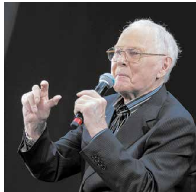
Харизма Владимира Гостюхина с годами только усиливается

Финал фестиваля участники ждали с особым волнением — в программе значился визит легендарного актёра театра и кино Владимира Гостюхина. Знаменитого гостя «Цифровой истории» зал приветствовал стоя. Его полю-