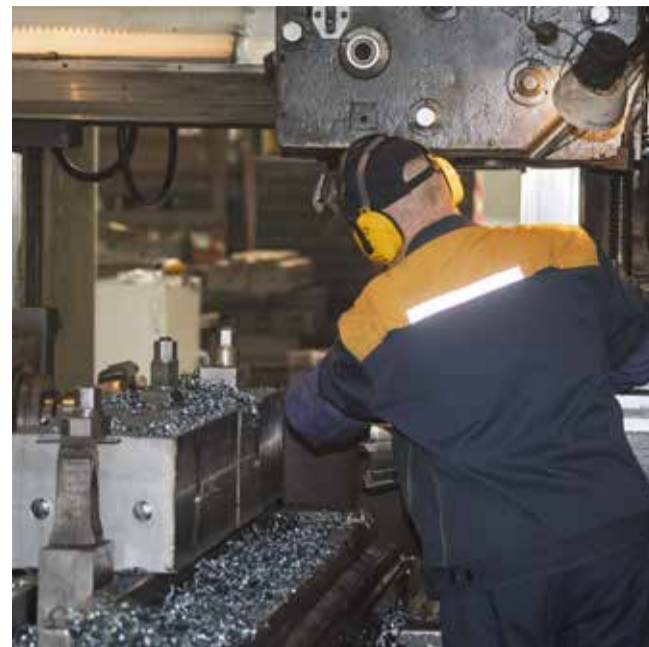
На КЗ обновления коснулись и станков, и формы рабочих

В ШИКе «генерал» и его замы отправились на обновлённый участок изготовления габаритов и штампов «Прямоугольные в плане» с продольно-фрезерными станками, на которых трудятся ветераны-станочники широкого профиля. Маторов подчеркнул: здесь установили новый кран,