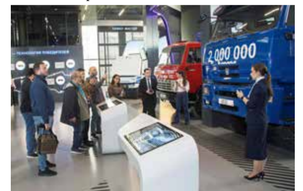
Гости остались под впечатлением от мощи камазовской техники

ствуется во всем. Вы — не просто работники одной организации, вы похожи на семью, очень сплочённые, и это то, что стоит ценить», — отметил алжирский журналист и автор медиаканала DZDiplomat Хуссам Эддин Беркан.