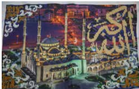
Мастерица осваивает и искусство шамаила