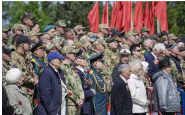
Почётные гости праздника оценивают парад с особым пристрастием