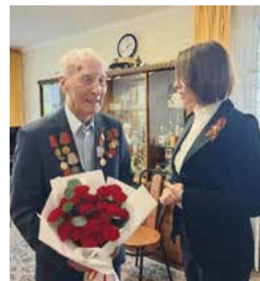
Душевная встреча накануне праздника запомнится ветерану надолго

Сотрудники «КАМАЗ-ЛИЗИНГА» в этом году посетили 26 человек — среди них пенсио-