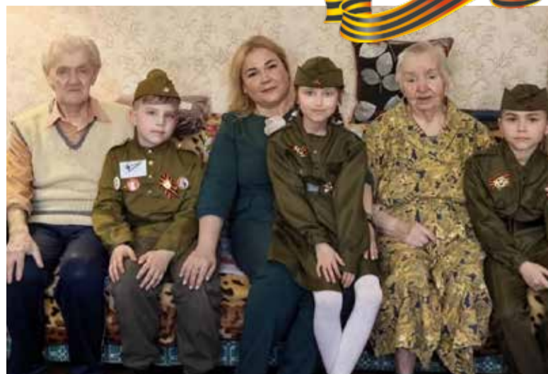
Супруги Зарины, малышами видевшие ужасы войны, с нежностью относятся к ребятишкам

Сила материнской любви и отваги взяла верх в схватке со смертью: Зарины вышли к советским