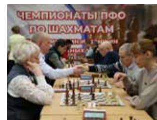
Командное первенство завершено. Ждём личного

Осенью планируется личное первенство «КАМАЗа» по шахматам. Победители этого соревнования примут участие в чемпионате Ростеха в Москве.