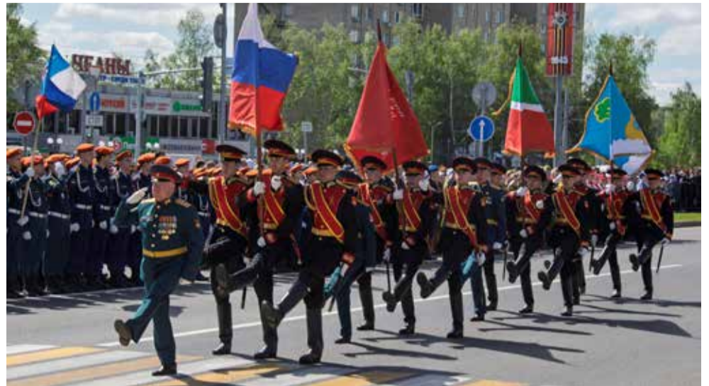
«Плечом к плечу идём единым строем, чеканя шаг по твёрдой мостовой...»

Главным вечерним событием стала постановка «Славе не меркнуть. Памяти — жить!» на майдане парка «Прибрежный». В реконструкции приняли участие студенты, кадеты и волонтеры. Зрителям показали сцены начала вой-