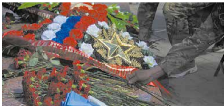
«Я была тогда с моим народом...» А. Ахматова

Есть день один, который год от года Священнее, и ближе, и родней. Я в этот день иду с моим народом Туда, где станут тысячи людей. Меня никто не просит, не неволит, Но голос говорит: ещё могу Примкнуть к единой радости и боли — Чтоб вспомнить, перед кем навек в долгу.