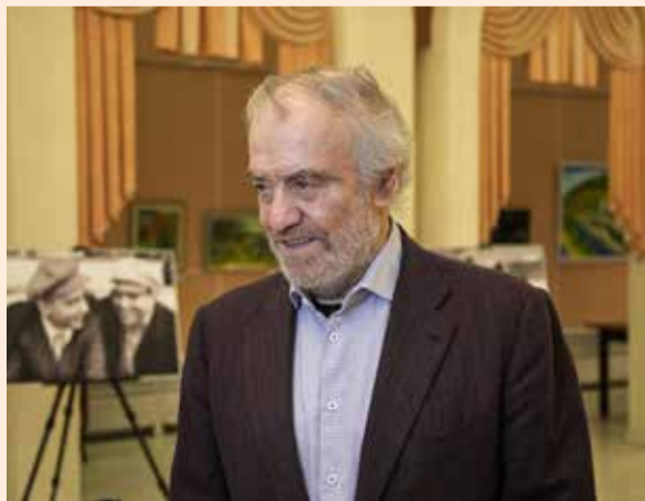
Интервью маэстро смотрите на канале «КАМАЗ-ТВ» (VK Видео)

В Челнах именитые музыканты выступили в 11-й раз. На концерте они исполнили произведения Моцарта и Чайковского, а также «Болеро» Мориса Равеля, триптих «Море» Клода Дебюсси, сюиту из «Жар-птицы» Игоря Стравинского и увертюру к оперетте Иоганна Штрауса-сына «Летучая мышь».