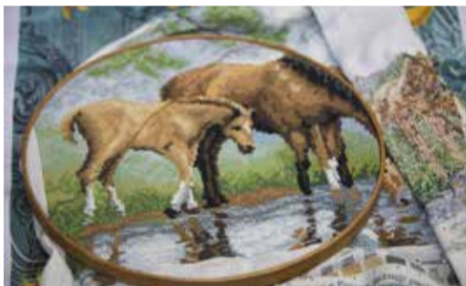
Эта работа сейчас в процессе