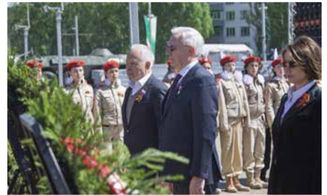
Отдать дань уважения павшим — незыблемая традиция камазовских руководителей