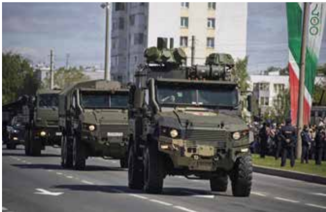
Колонна автотехники — отличительный знак Челнов

Финальным аккордом торжества стали минута молчания в память о павших, лазерное шоу и огни праздничного салюта, раскрасившие небо над Челнами.