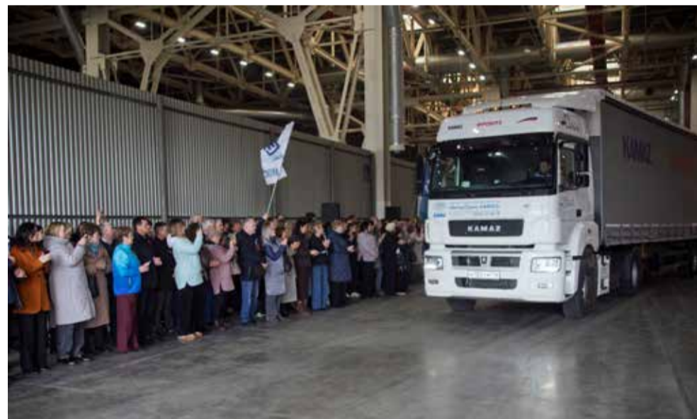
Камазовцы отправили 130 тонн гуманитарного груза