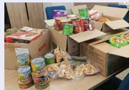
Ветераны «КАМАЗа» с теплотой собирают гумпомощь бойцам