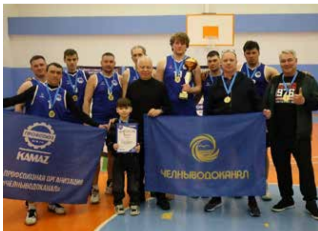
«Челныводоканал» четвёртый раз кряду выиграл первенство по баскетболу