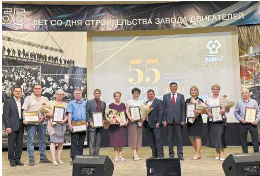
К юбилею завода — награды лучшим работникам

Со сцены обратился к зрителям и почётный гость праздника — заместитель председателя профко-