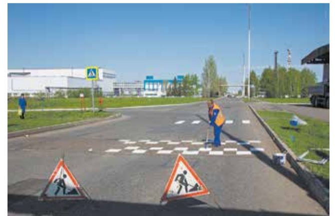
Нанесение дорожной разметки весной обязательно