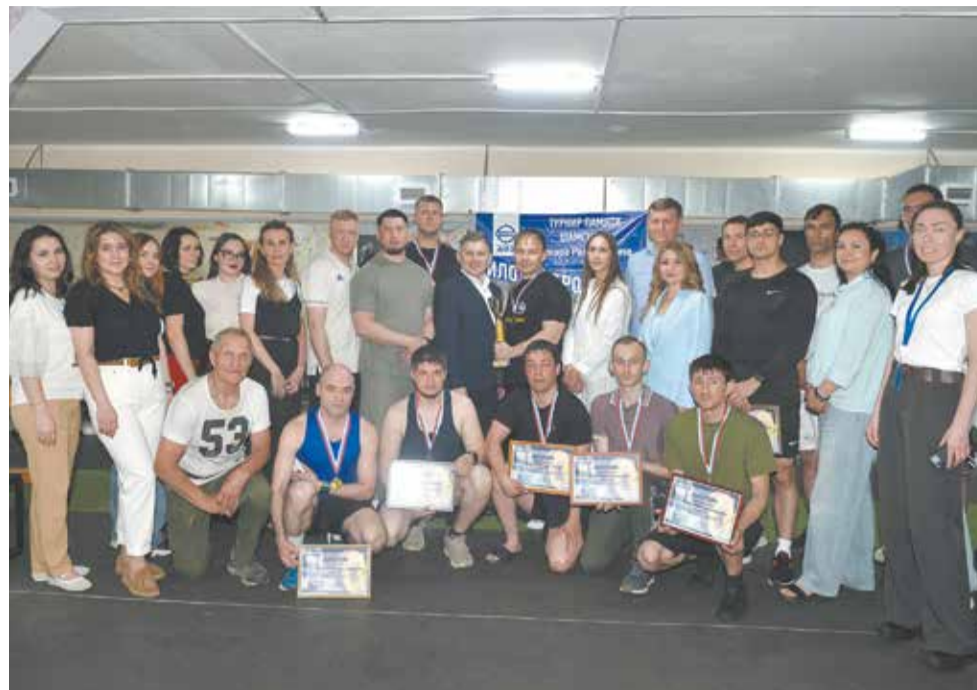
Общая фотография — традиция соревнования

разные значения — 50, 60 и даже 100 кг. Организаторы просили хорошо подумать, прежде чем называть цифру, которая трансформировалась в навешанные на штангу блины. Во второй и третьей попытке брать ниже обозначенного показателя запрещалось. По тому же принципу проводился жим штанги лежа на горизонтальной скамье. Правильное выполнение упражнения — зачёт, в случае неудачи — попытка взять тот же вес. Становую тягу как более сложную дисциплину организаторы оставили на второй день. Коллеги и друзья приходили поддержать спортсменов. То и дело слышалось: «Ты молодец!», «Давай, у