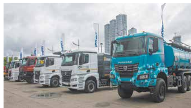
У платформы K5 большой модернизационный потенциал

ющая разметка, хорошие дороги, но нужно ещё решить вопрос со связью и привести логистические технологии в соответствие беспилотному транспорту. Тогда цепочка станет высокоэффективной в целом.