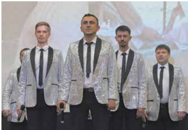
Лирические песни в исполнении мужского ансамбля завораживали зал

Завершился концерт совместным выступлением ансамблей «Орион» и «Лири» с песней «КАМАЗ, атас». Зал с готовностью поддерживал артистов аплодисментами. Расходились гости с широкими улыбками. Всё как положено на юбилее!