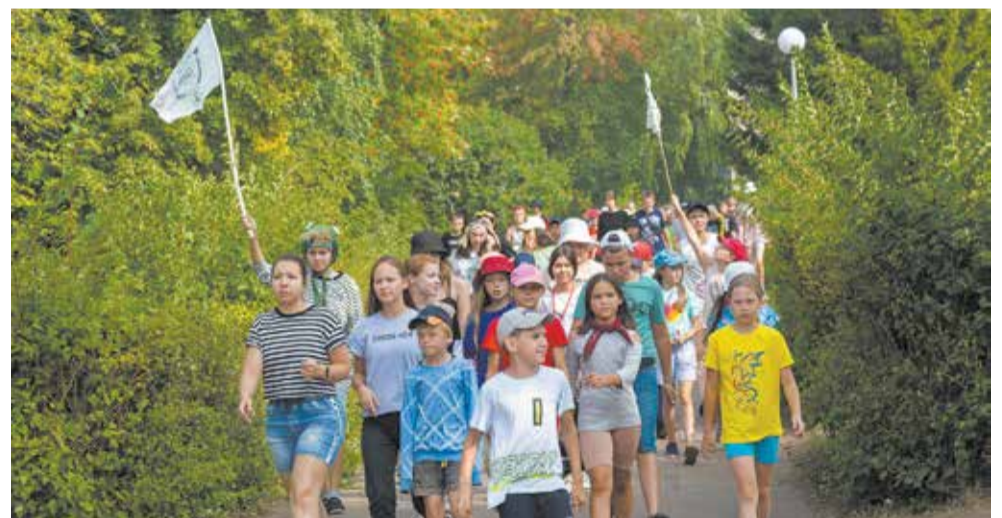
Смены в лагерях «Солнечный» и «Крылатый» всегда проходят интересно

Завершит летний марафон проект «Наследники Великой Руси» (с 9 по 29 августа). Его участников ждут богатырские игры, испытания на смекалку и