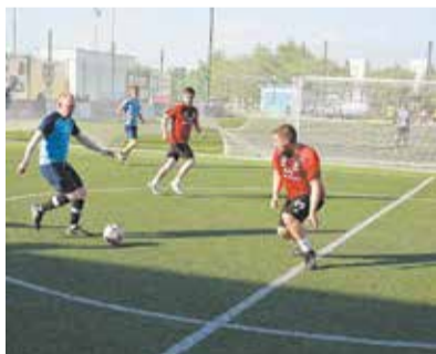
Обыграть соперника на мини-футбольном поле — задача сложная

Следующие матчи состязания пройдут 30 и 31 мая.