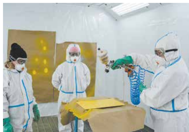
... а затем работают краскопультом