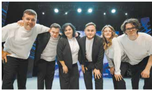
«Нелогичные» впервые в Лиге КВН «Поволжье» — и уже в полуфинале фестиваля

«Нелогичные» выступали в первый день и соревновались с «Прикамцами» (Пермь), кавээнщиками из «Перспекта металлургов» (Магнитогорск), «Сборной Высшей школы нефти» (Альметьевск); «Жигулёвского заповедника» (Самара). Команды демонстрировали визитку, пели в музыкальном домашнем задании, а также