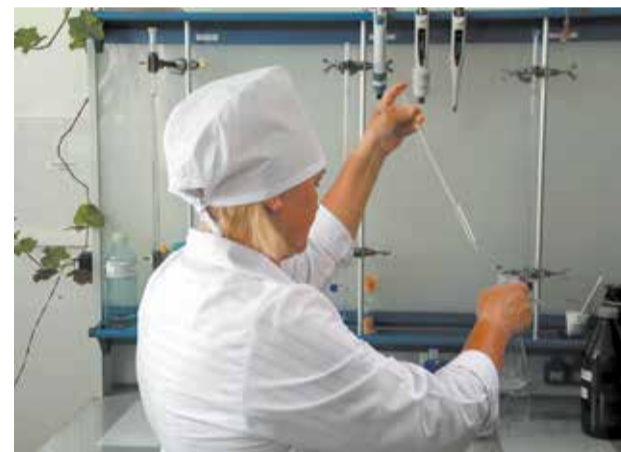
Профессионализм лаборантов «ЧВК» вызывает уважение

Лаборатория аккредитована в национальной системе аккредитации (Росаккредитация) в соответствии с требованиями Федерального закона № 416-ФЗ «О водоснабжении и водоотведении». Одним из обязательных условий аккредитации является участие в программе проверки квалификации — межлабораторных сравнительных испытаниях (МСИ). Аналитическая лаборатория «Челныводоканала» на протяжении многих лет участвует в них и неизменно демонстрирует высокие результаты. Участие в первом квартале 2026 года не стало исключением.