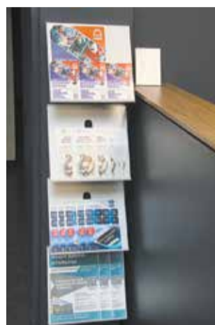
В брошюрах разместились информация о программе профподготовки

В 2026 году желающие могут отучиться на оператора станков с ПУ, слесаря-ремонтника, наладчика станков и манипуляторов с ПУ, контролёра станочных и слесарных работ, электрогазосварщика, станочника широкого профиля, сварщика, наладчика автоматических линий и агрегатных станков. Курс длится примерно полтора месяца, обучение по программам стартовало в середине мая. Последняя