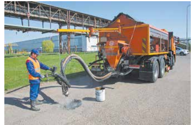
Пневмонабрызг — инновационный способ устранения дефектов дорожного полотна

— На данный момент разметка выполнена на Ав3, ЛЗ, ПРЗ и на ЗД. Мы наносим разметку преимущественно на пешеходных переходах и в районе перекрёстков, где