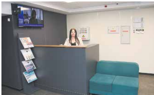
На инфостойке можно проконсультироваться по обучению в МЦПК машиностроения

Записаться на занятия могут и те, кто уже работает на производстве и хочет получить вторую специальность. Главное условие — чтобы слушатель раньше не проходил подобные бесплатные курсы. Нынешнее обучение МЦПК машиностроения реализует в рам-