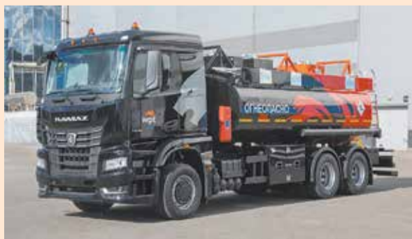
Так выглядит обладатель номинации «Грузовик года» КАМАЗ-65658

Конкурс «Лучший коммерческий автомобиль года в России» проводился в 25-й раз. Торжественная церемония награждения прошла в Москве в рамках выставки COMvex.