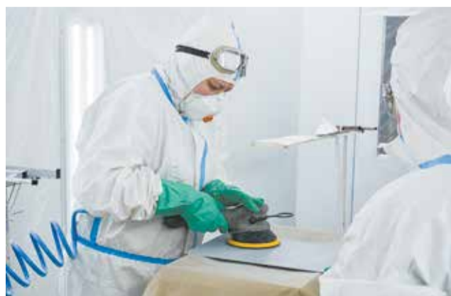
Сначала будущие маляры учатся подготавливать поверхность к покраске...