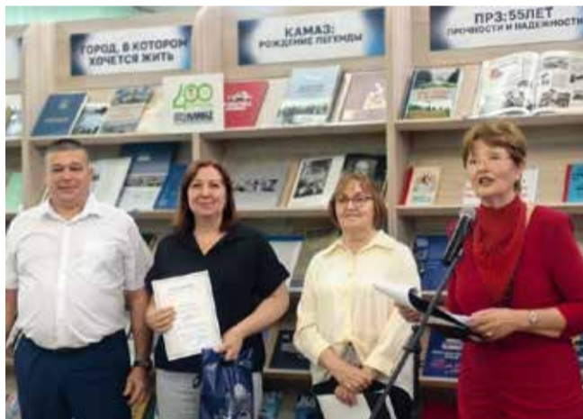
Церемония награждения читателей стала ярким моментом праздника

Сегодня работникам ПРЗ сделать шаг в мир литературы очень просто: достаточно переступить порог заводской библиотеки. Там им обязательно помогут подобрать книгу по душе.