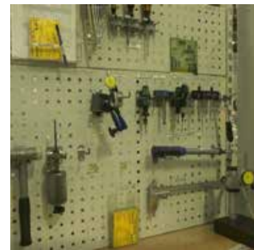
На стандартизированных рабочих местах искать инструмент не придётся — он будет на той же полочке

— Она позволяет передавать информацию о качестве детали сразу на линию. Специальное оборудование — светофор, установленное на линии, показыва-