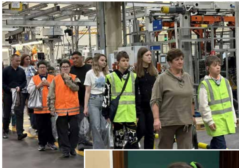
Айда смотреть камазовский двигатель!

Наконец дождалась возможности заглянуть на