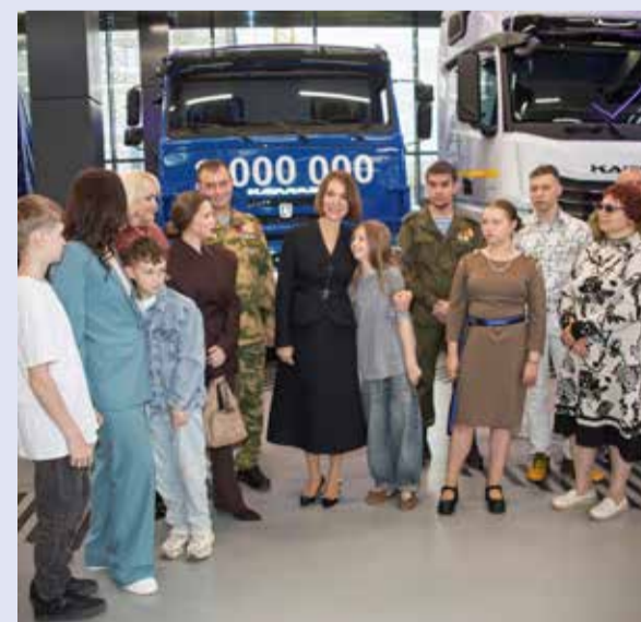
Репортаж о гастролях Театра сатиры — на стр. 7

Кроме того, для гостей Визит-центра провели экскурсию по современному пространству. Специалист промышленного туризма напомнил папам, мамам и их детям о ярких страницах истории завода на Каме.