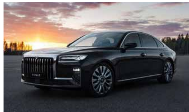
Авто представительского класса SENAT 900

«В истории автопрома Петербурга открывается динамичная и перспективная глава. Мы возрождаем традиции инженерного мастерства, передаём эстафету новым поколениям конструкторов, технологов и рабочих. Запуск SENAT 900 станет новым драйвером развития отрасли и экономики города в целом», — подчеркнул гу-