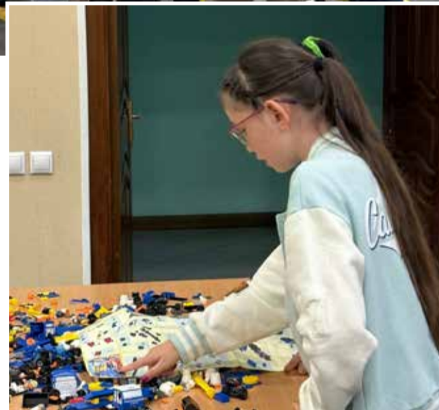
Собирать лего-КАМАЗы интересно даже девочкам

После лекции о технике безопасности детей в четырёх группах провели по арматурно-сборочному производству. Они увидели процесс сборки двигателя, познакомились с работой различных станков и оборудования и смогли пообщаться с опытными