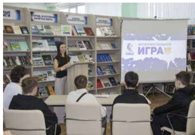
В интеллектуальном квизе о «КАМАЗе» сразились юные гости ПРЗ

— Я впервые попала на «КАМАЗ». Здесь работают мои мама и папа. Посмотрела на мощный прессово-рамный завод, поучаствовала во всех мастер-классах. Круто! Будет