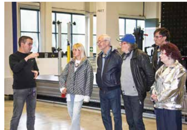
Завод каркасов кабин порастил актёров уровнем роботизации

Первым спектаклем, который подарили артисты Челнам, стали «Маленькие супружеские преступле-