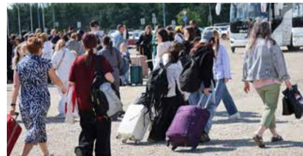
Впереди три недели самостоятельности

Первый заезд положил начало летней оздоровительной кампании. Впереди у ребят — три недели ярких эмоций, новых друзей и незабываемых впечатлений.