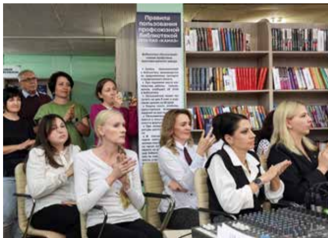
Члены литературной гостиной ПРЗ — неизменные участники всех мероприятий