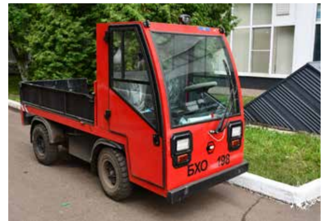
Закупленные заводом новые электрокары расширяют возможности персонала в решении каждодневных производственных задач и эстетично выглядят

Могу с уверенностью сказать, что мы уже совсем