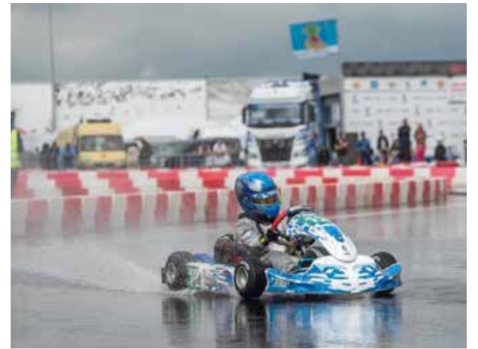
Мокрый асфальт — возможность для гонщика показать своё мастерство

Призёры соревнований в своих классах принимали поздравления от пилотов «КАМАЗ-мастера» Эдуарда Николаева, Дмитрия Сотникова и Айрата Мардеева, а затем сфотографировались с ними. Подводились итоги и среди