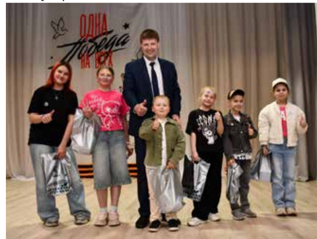
В дни открытых дверей детей сотрудников предприятия узнают историю и традиции завода