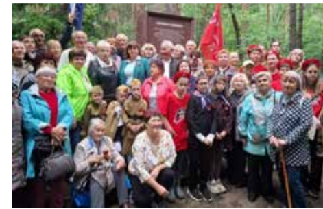
Почтить память воинов в Тарловку приехали 50 ветеранов «КАМАЗа»