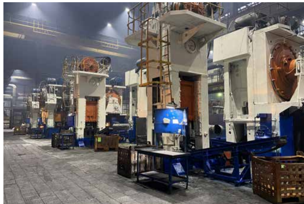
Эталонные участки — часть производственной культуры завода. В этом году запланировано организовать ещё 16 таких участков

работа — идёт заливка фундамента (его глубина 12 метров), к осени эти работы должны быть завершены.